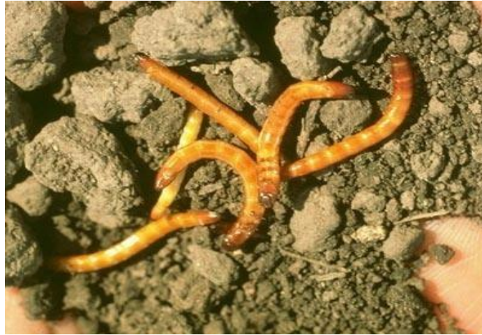
Slika 4. Žičnjaci