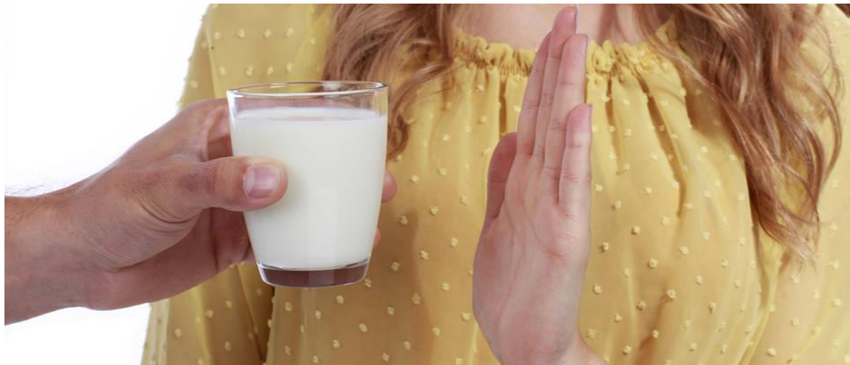
Slika Odbijanje mlijeka zbog laktozne intolerancije

Prema procjenama, danas 5 % europske populacije, pa tako i stanovnika Hrvatske ima poteškoća s probavljanjem laktoze. Laktoza je primarni šećer koji se nalazi u mlijeku sisavaca, a za njezinu probavu je potreban enzim laktaza. Laktaza se proizvodi u tankom crijevu, u kojemu se laktoza razgrađuje na dva jednostavnija šećera. Ukoliko crijevo ne proizvede dovoljnu količinu laktaze ili je uopće ne proizvede, mliječni šećer se tada ne može probaviti. Zatim se pomiče u debelo crijevo gdje ga bakterije fermentiraju proizvodeći vodik, ugljični dioksid i organske kiseline. Posljedice fermentacije su nelagoda u trbuhu, plinovi i proljev. Postoji primarno, sekundarno i urođeno nepodnošenje laktoze (Mozaik knjiga, Zagreb, 2001.).