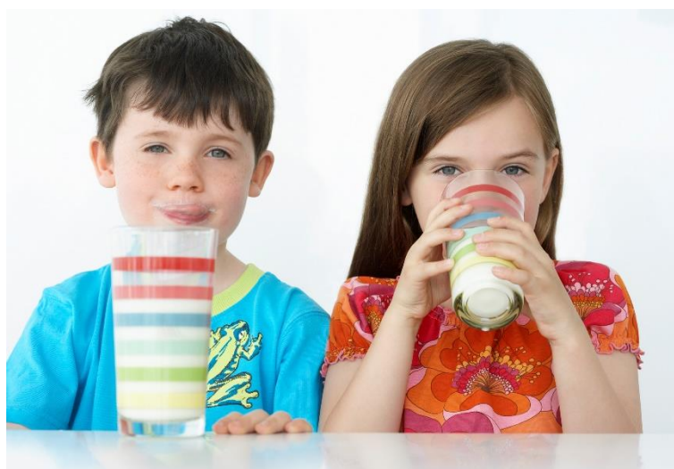
Slika 3. Svakodnevna konzumacija mlijeka kod djece

Mlijeko i mliječni proizvodi su neizostavne namirnice u prehrani ljudi, osobito kod djece. Voda je najzastupljenija supstanca u ljudskome tijelu i ima brojne važne uloge kao npr. prijenos hranjivih tvari, reguliranje tjelesne temperature, sudjelovanje u otklanjanju otpadnih tvari i slično. Zbog toga je vrlo važno unositi dovoljnu količinu tekućine u organizam jer u tome ima veliku ulogu i mlijeko.