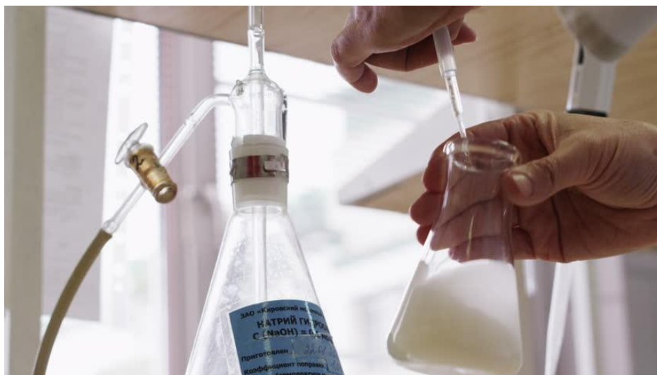
Slika 4. Istraživanje mlijeka

Iako sfingolipidi imaju brojne pozitivne učinke na ljudsko zdravlje, prehrambena znanost još uvijek nije utvrdila njihovu stvarnu količinu u namirnicama. Zbog toga su potrebna daljnja istraživanja pojedinih prehrambenih proizvoda, osobito mlijeka i mliječnih proizvoda (Potočki, 2016.).