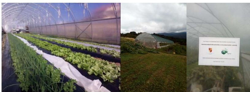
Slika 1. Plastenik na OPG-u „Zvonko Hursa“

Kao jedini problem OPG – a „Zvonko Hursa“ moglo bi se istaknuti manjak poljoprivredne mehanizacije. Naime OPG „Zvonko Hursa“ ne raspolaže sa nikakvom svojom mehanizacijom. Tako da sve poslove pripreme tla za sjetvu i sadnju moraju nadomjestiti uslužno. Gdje im pomaže OPG „Knezić“ iz Lepe Vesi, također iz Donje Stubice koji im pomaže oko svih poslova pripreme tla za sjetvu i sadnju. Oni također strojem za povlačenje folije rade proizvodne trake na površinama, a ujedno polažu i cijevi za navodnjavanje. Sadnu presadnica obavljaju sami ručno. Također i berbu obavljaju ručno. Što se tiče opreme OPG– a „Zvonko Hursa“ ipak bi se mogao istaknuti plastenik (Slika 1.).