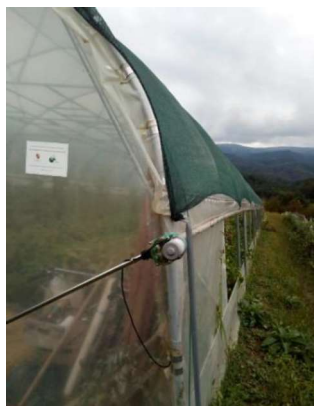
Slika 2. Elektromotor za automatsko podizanje i spuštanje bočnih strana plastenika

Plastenik je podignut uz subvenciju Krapinsko – zagorske županije 2017. godine. Plastenik je veličine 260 m 2 i u njemu se uzgaja sezonsko povrće ( grašak, mladi luk, zelena salata, kupus, rajčica ). Sam plastenik ima automatsko podizanje i spuštanje bočnih strana (Slika 2.).