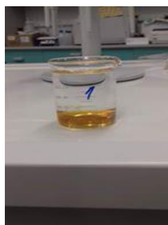
Slika 5. Otopljeni uzorak meda

Prazna staklena čaša se izvažuje na digitalnoj vagi koja se tarira kako težina čaše ne bi bila uračunata u odvagu. U tu istu staklenu čašu odvažuje se 20 g meda, koji će se analizirati. Izvagani uzorak meda otopi se u čaši dodavanjem 80 ml destilirane vode odvojene u menzuri. Otapanje se ubrzava miješanjem staklenim štapićem ili magnetnom mješalicom. Ravnomjerno otopljen uzorak je spreman za analizu.