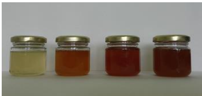
Slika 2. Boja meda s obzirom na vrstu (redom: bagrem, cvjetni, šumski i kestenov med)

Senzorna svojstva, kakvoća, kemijski sastav, količina peludi ovise o podneblju na kojem se odvija pčelinja ispaša, klimi, te pčelarskoj praksi (Mujić, 2014).