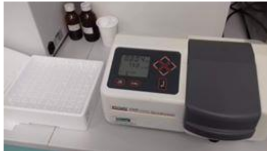
Slika 10. Spektrofotometar

Spektrofotometar je uređaj za kvantitativnu analizu spektra elektromagnetskog zračenja koje prolazi ili se reflektira kroz uzorak u kiveti kao funkcija valne duljine. Spektrofotometrijsku metodu koristili smo za određivanje ukupnih fenola i antioksidansa u medu.