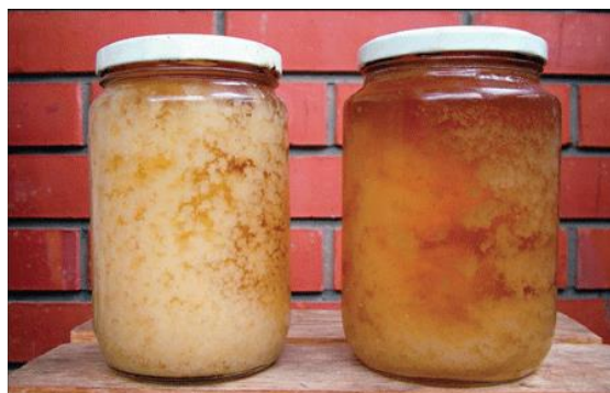
Slika 3. Kristalizirani med