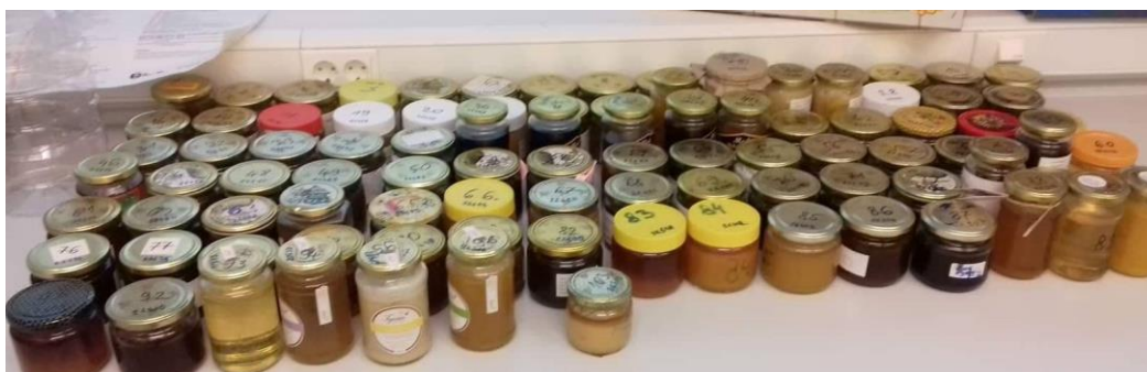
Slika 4. Skladišteni med prije analize

Posebnu pažnju treba obratiti na skladištenje meda. Med treba čuvati u čistim, suhim i tamnim prostorijama s dobrim provjetranjem. Prostorija ne smije biti vlažna jer med lako upija vlagu te stoga lako prihvaća druge mirise. Isto tako med ne treba čuvati na niskim temperaturama. Najpovoljnija temperatura je od 17 do 19° C. Ukoliko je med proizveden prema pravilima struke vlaga ne smije prelaziti 20% (ovisno o vrsti meda). U tim uvjetima opstanak bakterija i gljivica gotovo je nemoguć. Osim što nije preporučljivo med čuvati u metalnim posudama (zbog reakcije organskih kiselina i metala), pri konzumaciji meda preporuča se korištenje plastičnog, drvenog ili porculanskog pribora. Nema na svijetu pčele koja proizvodi loš med, loš med rezultat je industrijskog punjenja meda ili nesavjesnog i neobrazovanog pčelara.