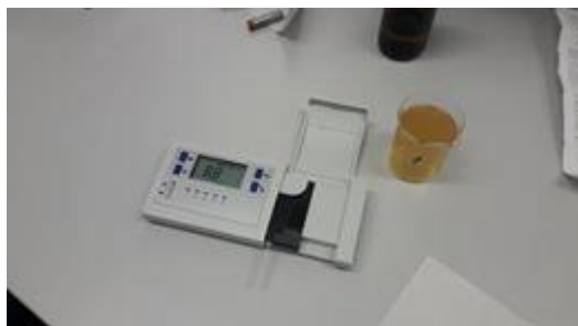
Slika 9. Mjerenje HMF-a

Analiza hidroksimetilfurfurala provodi se reflektokvantom, koji radi na principu mjerenja reflektirane svjetlosti od mjerne trakice. Kao i u klasičnoj fotometriji, razlika u intenzitetu emitirane i reflektirane svjetlosti omogućava određivanje koncentracije specifičnih čestica.