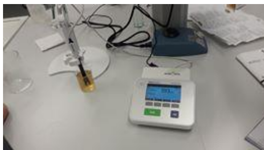
Slika 8. Konduktometar

Prilikom analize električne provodljivosti u otopinama, koristi se konduktometar. Uređaj radi na principu detekcije količine iona u otopini privlačenjem suprotno nabijenih naboja. Elektrode su građene od platine ili legure platine, a uređaj se prije uporabe kalibrira uz pomoć standardne otopine.