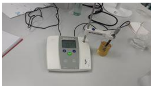
Slika 7. Mjerenje pH meda

Za analize pH otopina, koristi se pH metar. Površina kojom se mjeri je staklena membrana, koja se uranja u otopinu. Unutar membrane na određenoj udaljenosti postavljaju se dva elektrolita između kojih dolazi do izmjene iona na obje strane membrane. Razlikom potencijala između otopine koje se mjeri i otopine unutar staklene membrane, senzori određuju koncentraciju vodikovih iona. Prije upotrebe, kalibrira se fosfatnim puferima s \text{pH} = 4 , \text{pH} = 7 i \text{pH} = 9 .