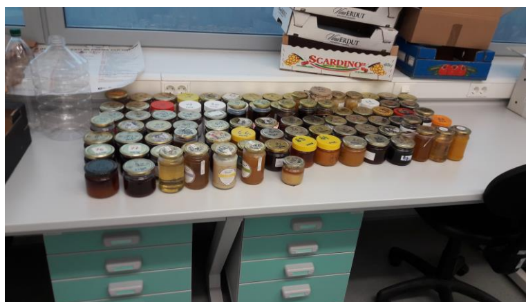
Slika 1. Različite vrste meda za analizu