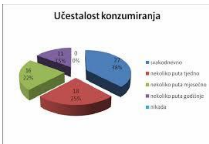
Slika 12. Učestalost konzumiranja meda;

Eksperimentalni rezultati su pokazali da otopine svjetlijih medova imaju niži izmjereni pH, što im daje veću kiselost u usporedbi sa medovima tamnije boje. Električna provodljivost, a paralelno s njom i sadržaj pepela u tamnijim medovima su veći, osobito u medljici.