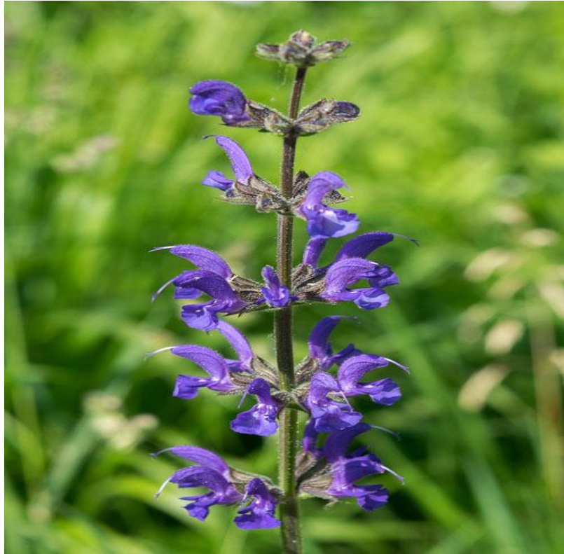
Slika 5. Livadna kadulja