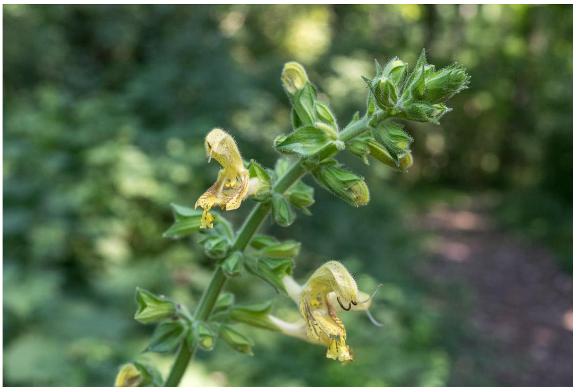
Slika 6. Ljepeljiva kadulja