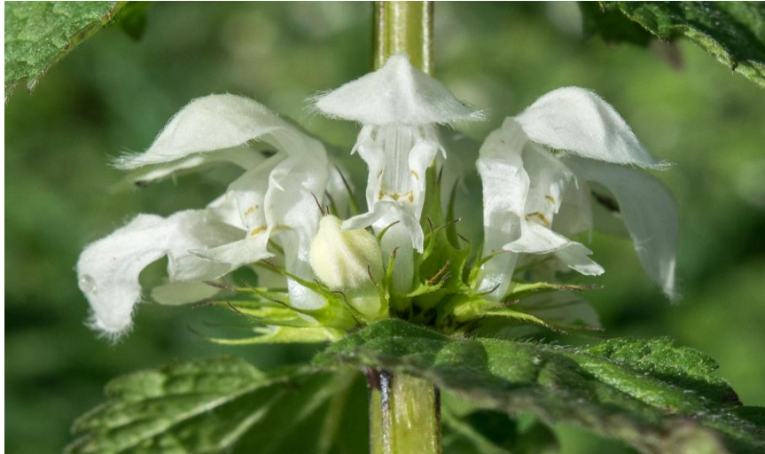
Slika 11. Bijela mrtva kopriva