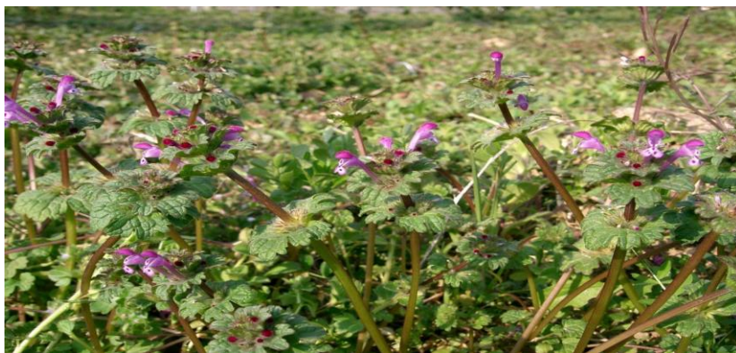
Slika 12. Prikaz obuhvatne mrtve koprive

Jednogodišnja je zeljasta biljka. Obuhvatnu mrtvu koprivu karakteriziraju obuhvatni bubrežasti listovi. Cvjetovi su obično ljubičaste ili ružičaste boje (Slika 12.). Biljka raste u kukuruzištima, vrtovima i voćnjacima, dobro medi i daje dosta peludi. Cvjeta u proljeće od ožujka do svibnja (Forenbacher, 2001.).