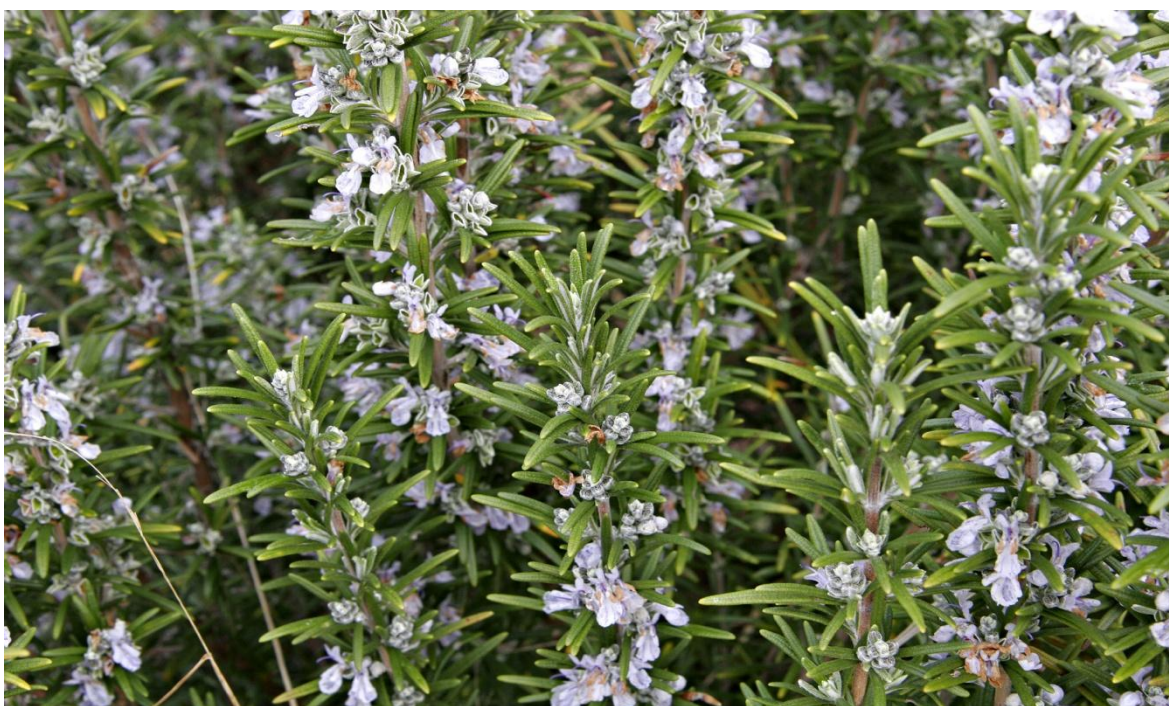
Slika 9. Prikaz ružmarina u cvatnji

ružmarin će procvjetat početkom ožujka i ukoliko vrijeme bude dobro, prinosi meda u proljeće mogu biti veći nego u jeseni. U proljeće cvatnja traje preko 40 dana, a prinosi u dobrim godinama mogu bit i do 60 kg meda po košnici (Šimić 1980). Pašu često ometaju vjetrovi u vrijeme cvatnje. Ružmarin ne medu jednako na svim mjestima, upravo zbog vjetrova koji su promjenjivi. Ružmarin medu na nižoj temperaturi od drugih medonosnih biljaka zato što je zimzelena biljka. Medu na noćnoj temperaturi i ispod 0 °C, a na dnevnoj temperaturi od 14 °C. Med je bez mirisa, blagog je i ugodnog okusa. Ovaj med karakterizira prozirnost, svjetlost i bistroća, brzo se kristalizira u bijelu boju sitnih kristala.