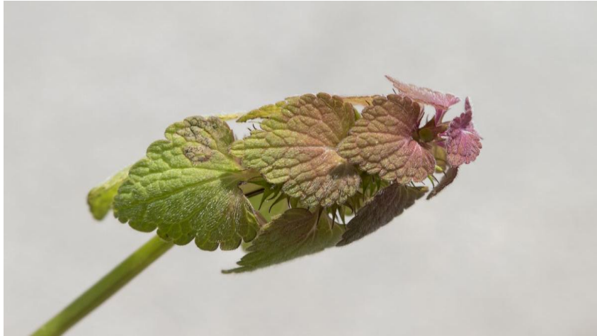
Slika 15. Prikaz grimizne mrtve koprive