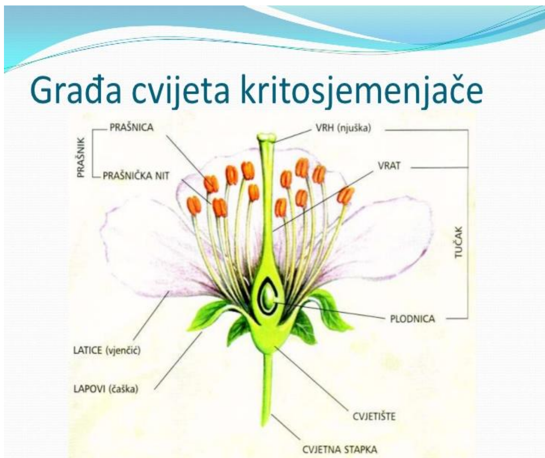
Slika 1. Građa cvijeta kritosjemenjača

Najbrojnija skupina biljaka jesu kritosjemenjače, biljke koje imaju pravi cvijet iz kojega se razvija plod. Njihovi sjemeni zamci skriveni su unutar plodnice tučka, te su tako zaštićeniji i osiguravaju veću mogućnost preživljavanja. Cvijet je spolni organ biljke zadužen za razmnožavanje. Osnovni dijelovi cvijeta su (Slika 1.): cvjetno stajalo, ocvijeće, andrecej, ginecej.