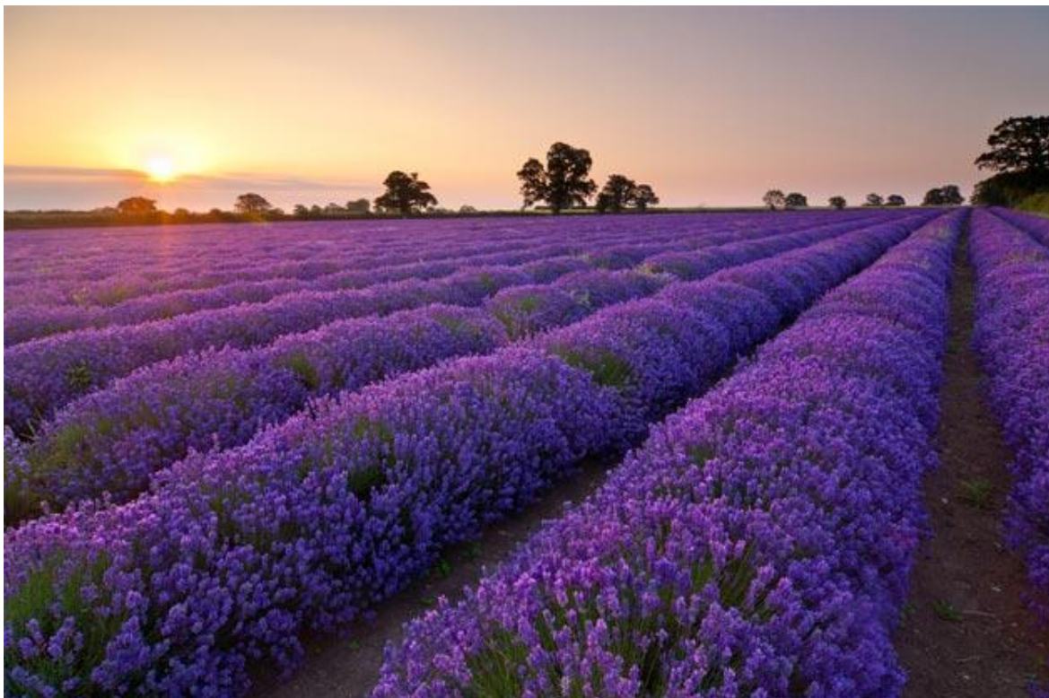
Slika 4. Plantaža lavande

Lavanda se često uzgaja i kao ukrasni grm. Pogodna je za cvjetne gredice (Hulina, 2011.).