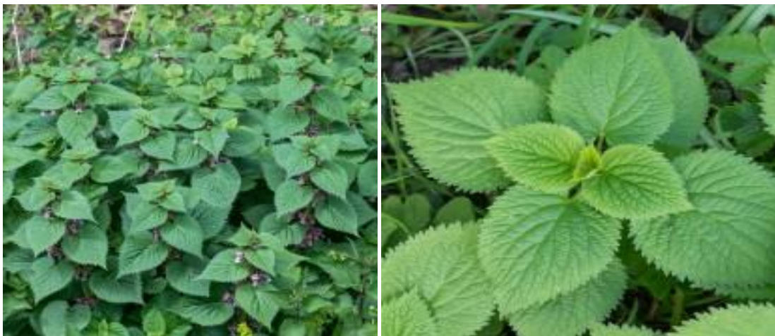
Slika 14. Prikaz velike mrtve koprive

Velika mrtva kopriva je ilirski geoelement i značajna je vrsta u šumama kitnjaka i graba u jugoistočnoj Europi (Hulina, 201.).