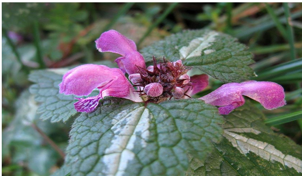
Slika 13. Prikaz pjegave mrtve koprive

Trajna zeljasta biljka koja obično naraste do 50 cm. Listovi su u obliku trokuta i s karakterističnom svjetlom šarom. Cvjetovi su crveno-ljubičasti, dok je donja usna bijele boje (Slika 13.). Donju usnu prekrivaju ljubičaste točkice. Obično raste na zapuštenim vlažnim mjestima, šumskom tlu, putovima, vrtovima itd. Ime je dobila po latinskom imenu vrste „maculatum“, što znači pjegav. Često je nazivaju i “ljubičasti zmaj“, jer joj cvjetovi nalikuju na zijevalice. Ova biljka cvijeta od travnja do rujna (Forenbacher, 2001.). Ovo je vrlo varijabilna vrsta (Franjić i Škvorc, 2014.).