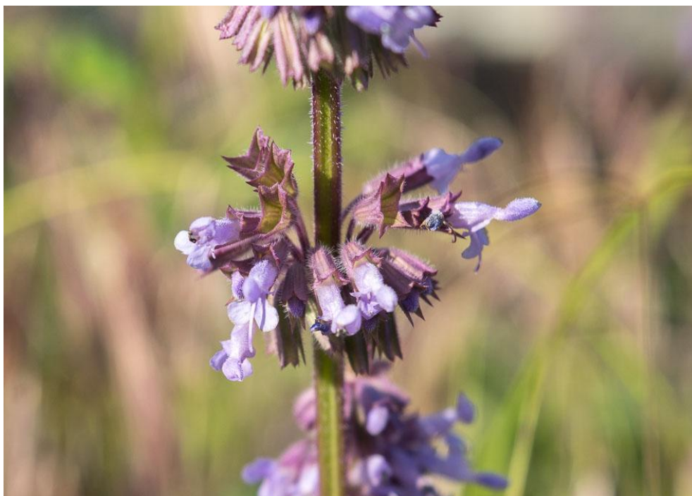
Slika 7. Pršljenasta kadulja