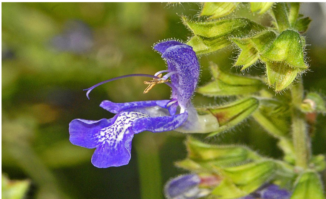
Slika 2. Građa cvijeta

Cvjetovi se razvijaju u pazušcima listova. Obično su skupljeni u cimozne cvati pri vrhu stabljike (Kojić, 1988.). Cvjetovi su dvospolni s dvostrukim ocvijećem i nepravilni (zigomorfni). Čaška je cjevasta (Slika 2.)