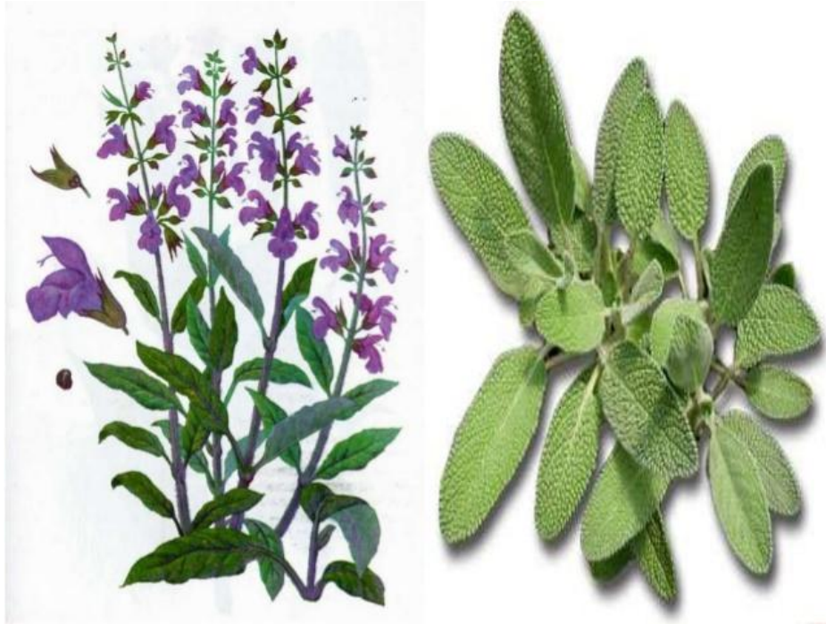
Slika 8. Ljekovita kadulja