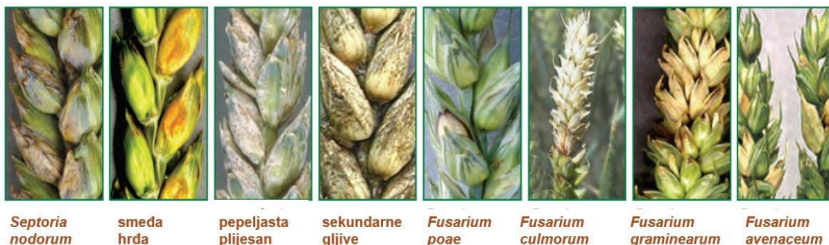
Slika 1: Bolesti pšenice