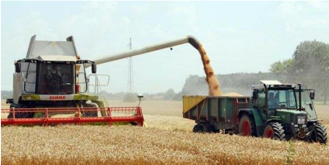
Slika 2: Žetva pšenice

Žetva pšenice može biti jednofazna, dvofazna i višefazna. Jednofazna žetva izvodi se kombajnama. Jednofazna žetva počinje još u voštanoj zrelosti s vlagom zrna 35-30% i organizira se tako da se završi za 5-8 dana. Pri jednofaznoj žetvi gubici zrna su najmanji. Dvofazna žetva sastoji se od kosidbe pšenice na 20-30 cm visine. Ona se tako ostavi osušiti u otkosima, a zatim se vrši kombajnom. Dvofazna žetva ima niz prednosti nad jednofaznom kosidbom, jer omogućuje pravovremenu žetvu i ostvarivanje većeg prinosa..