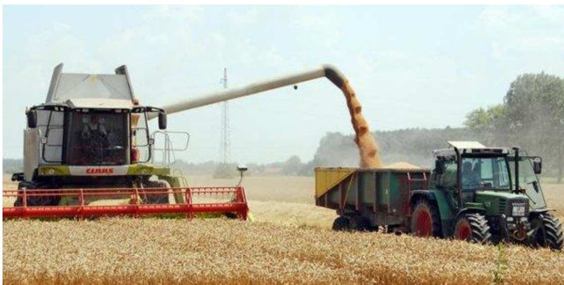
Slika 2: Žetva pšenice

Žetva pšenice može biti jednofazna, dvofazna i višefazna. Jednofazna žetva izvodi se kombajnama. Jednofazna žetva počinje još u voštanoj zrelosti s vlagom zrna 35-30% i organizira se tako da se završi za 5-8 dana. Pri jednofaznoj žetvi gubici zrna su najmanji. Dvofazna žetva sastoji se od kosidbe pšenice na 20-30 cm visine. Ona se tako ostavi osušiti u otkosima, a zatim se vrši kombajnom. Dvofazna žetva ima niz prednosti nad jednofaznom kosidbom, jer omogućuje pravovremenu žetvu i ostvarivanje većeg prinosa..