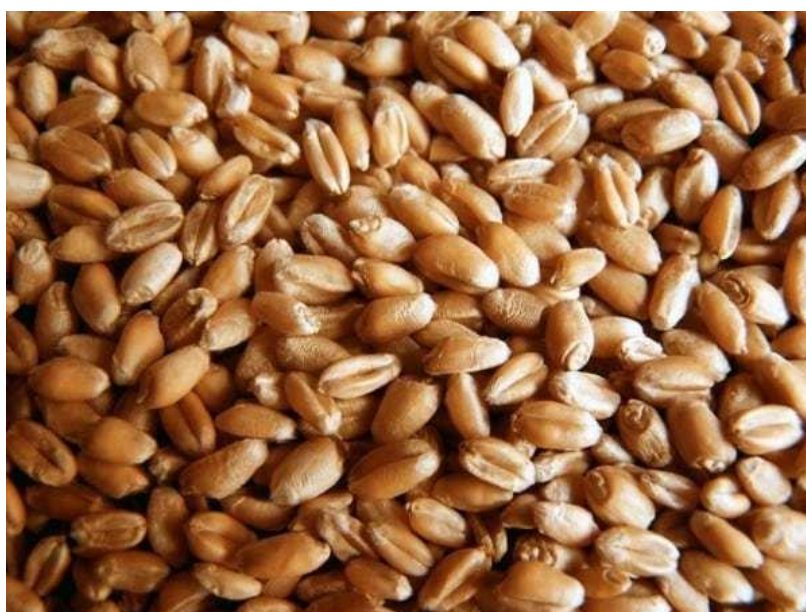
Slika 7. Zrno pšenice