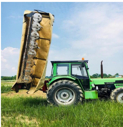
Slika 4. Rotaciona kosa