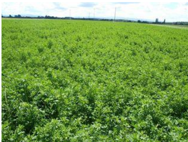
Slika 3. Lucerna pred košnju

Vrijeme kosidbe - od vremena kosidbe ovisi produkcija krme, njezina kakvoća, probavljivost i trajanje lucerišta. Optimalna faza u kosidbi lucerne u intenzivnoj proizvodnji je faza pupanja do početka cvjetanja, jer se tada postižu najveći prirodni kvalitetne hrane. Kosidbom u ovoj fazi lucerna u uvjetima istočne Slavonije daje pet porasta.