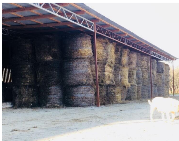
Slika 6. Skladište bala

Odabir, priprema i zaštita mjesta skladištenja presudni su čimbenici uspješnog čuvanja. Bale sijena se na gospodarstvu skladište u poluotvorenom skladišt. Ovo skladište je poluotvorenog tipa i ima prolaz za traktor radi lakše manipulacije balama.