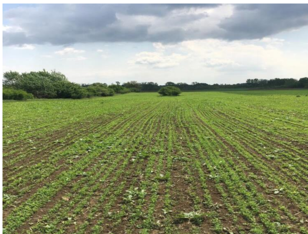
Slika 1. Lucerna

Na OPG-u Vučković sjetva je obavljena 27. ožujka 2019. na površini od 40 ha. Odluka da se sjetva obavi rano u proljeće donešena je zato što je tlo isušilo zbog visokih temperatura u ljetnom periodu. Količina kupljenog sjemena bila je 600 kg, namijenjenih za površinu od 40 ha što znači da je sijano 15 kg/ha. U skladu s preporukama Stjepanovića i sur. (2009.) koji preporučuju 12 do 18 kg/ha. Sjetva se obavljala Amazone sijačicom koja ima 25 sijačih aparata. Sjetva je obavljena na dubini od 2 – 3 cm, a međuredni razmak bio je 12,5 cm. Brzina sjetve bila je 10 km/h.