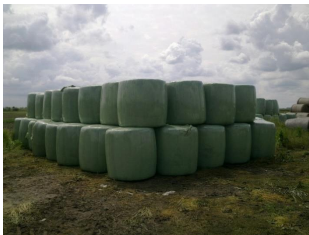
Slika 7. Način skladištenja sjenaže

Kod skladištenja umotanih bala treba birati zaklonjeno mjesto s dobrim (tvrdim), pristupnim putem, ali podalje od skloništa glodavaca. Rolo bale najbolje je postaviti uspravno jer ravna površina bale ima više slojeva folije za zaštitu od padalina. Složene bale dobro je pokriti polietilenskom folijom da se umani utjecaj oborina i odvraći glodavce od bušenja bala. Ovakav način skladištenja bala i čuvanja sjenaže zahtijeva i stroj pomoću kojeg će se bale prenijeti do farme kako bi se koristile za hranjenje stoke. Na gospodarstvu se koristi samohodni kombinirani utovarivač s vilicama gdje vilice ulaze u središte bale i vrši se njezin transport do farme. Vilice služe samo za transport do farme dok se za skladištenje i slaganje bala umotanih u foliju koriste hvataljke koje se postavljaju na utovarivač umjesto vilica.