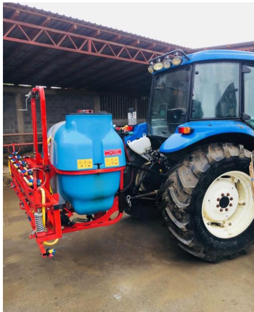
Slika 2. Prskalica

Pojedine korove stoka odbija jesti zbog oštih osja ili bodlji. Ako se korovi osjemene, zbog velikih vitalnosti sjemena mnogih korova ono ostajući klija desetak i više godina pa su izvor zaraze kako za usjev lucerne u slijedećim godinama, tako i za kulture koje će se sijati u slijedećim godinama. Na pojavu korova lucerna je osobito osjetljiva u godini sjetve, jer joj usporava razvitak, razrjeđuje lucerište pa je kod jače pojave korova katkad nužno lucerište preorati. Mehaničko suzbijanje korova vrši se drljanjem usjeva i kosidbom mladog zakorovljenog usjeva. Kosidba mladog usjeva lucerne nije preporučljiva do cvjetanja lucerne, ali u slučaju velike zakorovljenosti, ona je nužna. Ovu radnju treba obaviti po mogućnosti kad lucerne dostigne bare oko 30 cm visine. Visina kosidbe treba biti 8 do 10 cm, kako bi se lucerna što brže obnavljala, jer se ona u slijedećem porastu u povoljnijim uvjetima brže raste od većine korova. Kemijsko suzbijanje korova provodi se herbicidima. Uništavanje korova obavlja se primjenom herbicida prije sjetve, nakon sjetve, prije nicanja lucerne, nakon nicanja lucerne, kada je lucerna razvila 2 do 4 prava lista, te za vrijeme mirovanja vegetacije. (Bukvić i sur., 1997.)