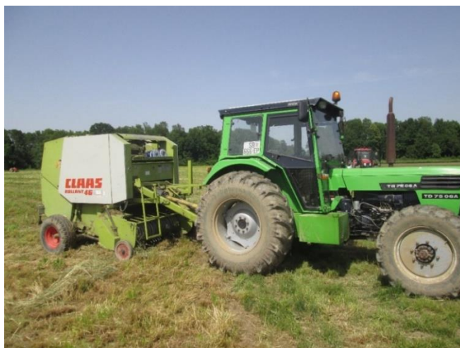
Slika 5. Rolo preša