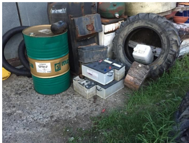
Slika 6. Odlaganje starih akumulatora na poljoprivrednom gospodarstvu

Najveći postotni udio vlasnika (40%) stare akumulatore baca u smeće, dok njih samo 20% vraća dobavljaču, pri čemu ostvaruju popust na kupovinu novog akumulatora.