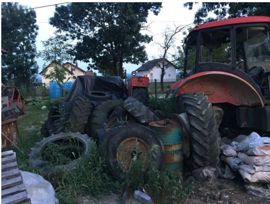
Slika 7. Odlaganje starih guma

Oštećene i neispravne gume vlasnici ostavljaju na gospodarstvu, slika 7.