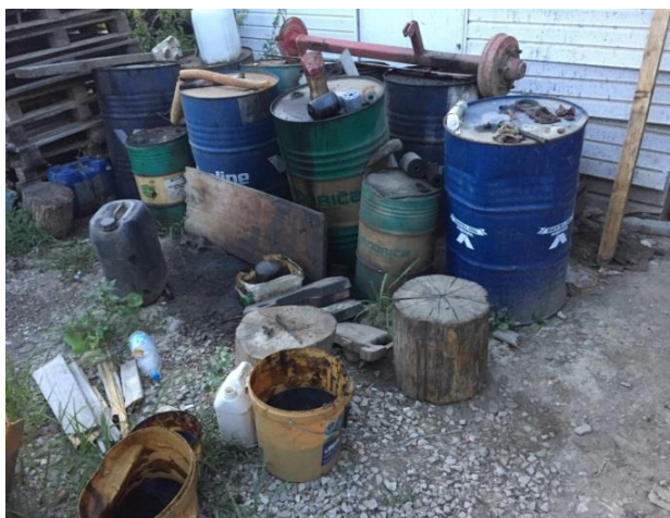
Slika 5. Prikupljanje rabljenog ulja u bačve

Pored rabljenog ulja, pri redovitim servisnim radnjama, mijenjaju se pročištači ulja koji predstavljaju također opasni otpad.