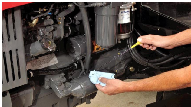
Slika 2. Provjera razine ulja u motoru