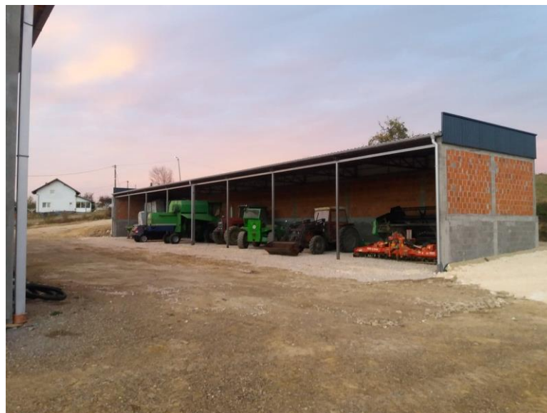
Slika 4. Garažiranje strojeva pod nadstrešnicom

Ništa nije bolja situacija glede garažiranja poljoprivrednih strojeva, gdje svega 4 vlasnika garažira svoje strojeve, od kojih 3 vlasnika pod nadstrešnicom, slika 4., i jedan vlasnik u zatvorenom prostoru.