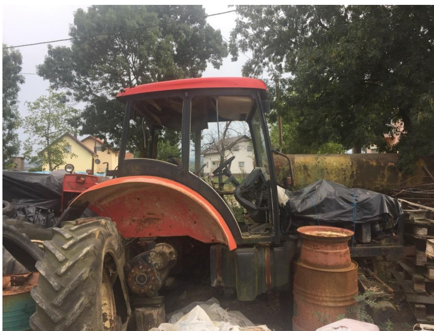
Slika 8. Dotrajali traktor

Dotrajale traktore i kombajne vlasnici obično prodaju ili odvoze na otpad. Jedan dio vlasnika stare i dotrajale traktore i kombajne ostavlja na gospodarstvu za rezervne dijelove, slika 8.