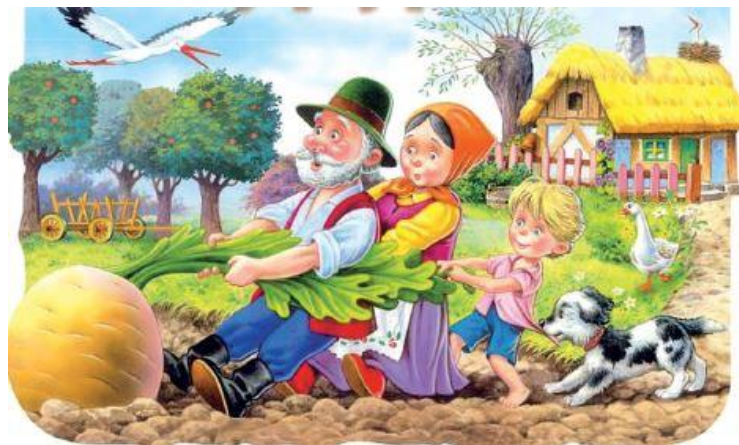
Stara pouka o udruživanju iz narodne priče, pomalo je zaboravljena, no na zahtjevnom europskom tržištu, hrvatski poljoprivrednici trebat će udružiti snage kako bi se mogli othrvati konkurenciji europskih poljoprivrednika