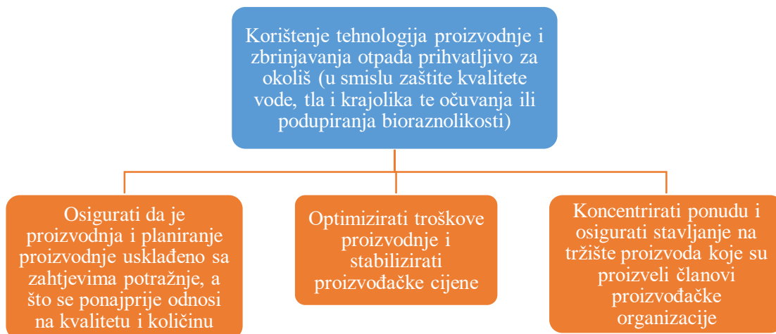
Slika 2. Ciljevi proizvođačkih organizacija

Proizvođačka organizacija se osniva na inicijativu proizvođača te se radi o organizaciji proizvođača jednog ili više proizvoda koji su namijenjeni isključivo preradi čiji su ciljevi prikazani slikom 2.