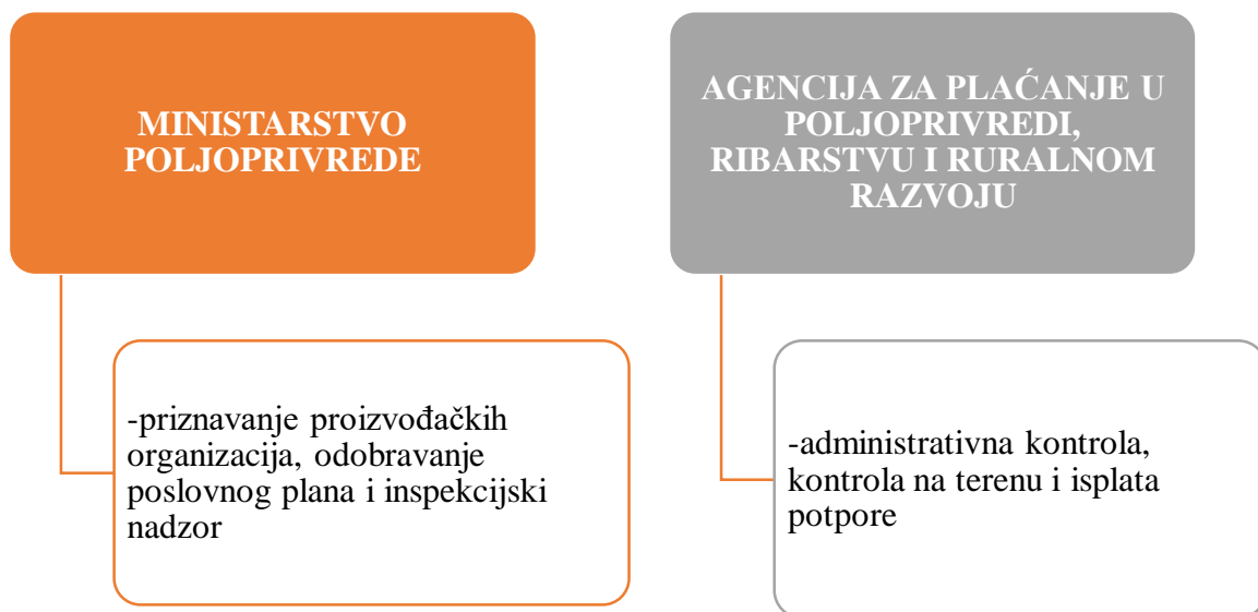
Slika 4. Nadležna tijela proizvođačke organizacije