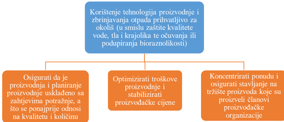
Slika 2. Ciljevi proizvođačkih organizacija

Proizvođačka organizacija se osniva na inicijativu proizvođača te se radi o organizaciji proizvođača jednog ili više proizvoda koji su namijenjeni isključivo preradi čiji su ciljevi prikazani slikom 2.