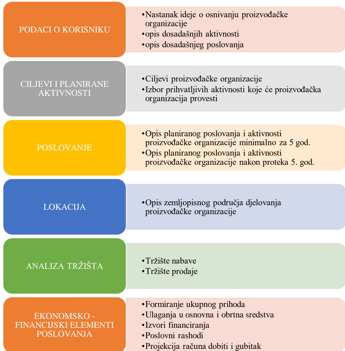
Slika 5. Sadržaj poslovnog plana

Ako se kupi prostor, prihvatljivi troškovi ograničeni su na troškove najma tog prostora po tržišnim cijenama. Prilikom dostavljanja poslovnog plana proizvođačka organizacija treba dostaviti i prikaz troškova za svaku nabavu opreme, plaću, najam i uslugu. Prikaz mora biti u obliku tablice, a iznos troškova mora biti izražen u hrvatskim kunama. (Pravilnik o priznavanju i potporama za početak rada proizvođačkih organizacija, 81/15)