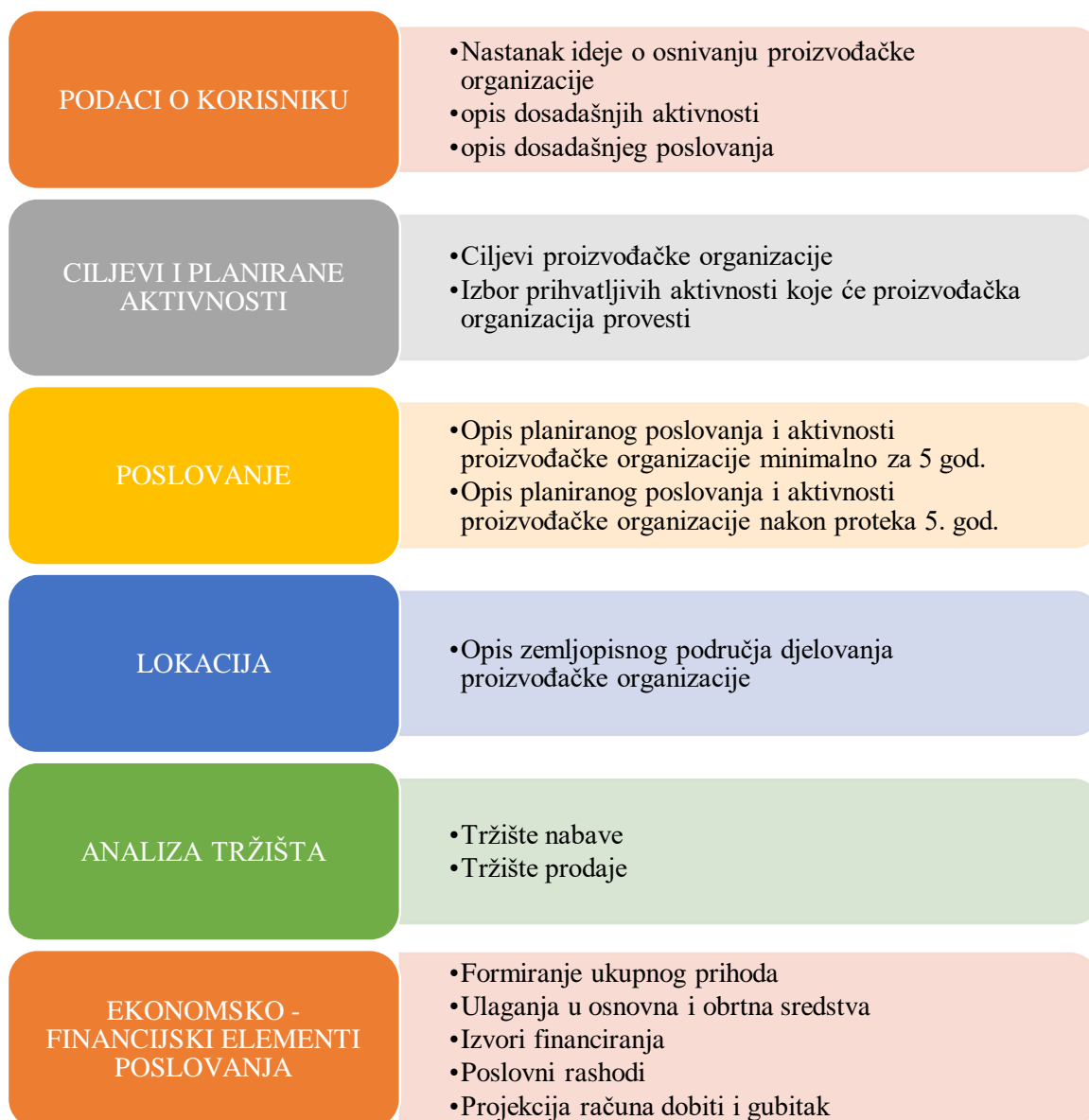
Slika 5. Sadržaj poslovnog plana

Ako se kupi prostor, prihvatljivi troškovi ograničeni su na troškove najma tog prostora po tržišnim cijenama. Prilikom dostavljanja poslovnog plana proizvođačka organizacija treba dostaviti i prikaz troškova za svaku nabavu opreme, plaću, najam i uslugu. Prikaz mora biti u obliku tablice, a iznos troškova mora biti izražen u hrvatskim kunama. (Pravilnik o priznavanju i potporama za početak rada proizvođačkih organizacija, 81/15)