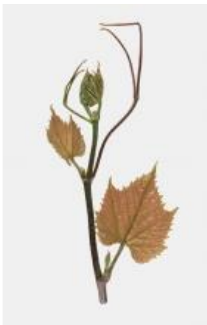
Slika 4. Mladi listovi i vrh mladice kod podloge Kober 5BB

( https://plantgrape.plantnet-project.org/media/cache/fiche_thumb/img/greffes131.jpg )