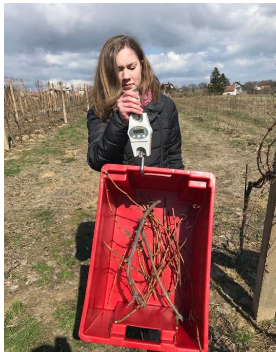
Slika 9. Vaganje orezane rozgve