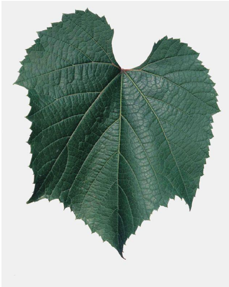
Slika 6. List loze kod podloge Kober 125AA

Smatra se dobrom podlogom za hladnija vapnena tla sjevernijih krajeva te u tim uvjetima pokazuje znantno bolje rezultate od Kober 5BB podloge. Bitno je obratiti pozornost na gnojidbu zbog mogućnosti osipanja cvjetova uslijed pretjerane bujnosti što je pogotovo uočljivo kod stolnih kultivara. Posebnu pažnju treba posvetiti pri izboru kultivara V.vinifere s obzirom na dob dozrijevanja u hladnijim uvjetima. Zbog mogućnosti kasnijeg dozrijevanja ima vrlo dobre prirode reznica u matičnjaku (Mirošević, Turković, 2003.).