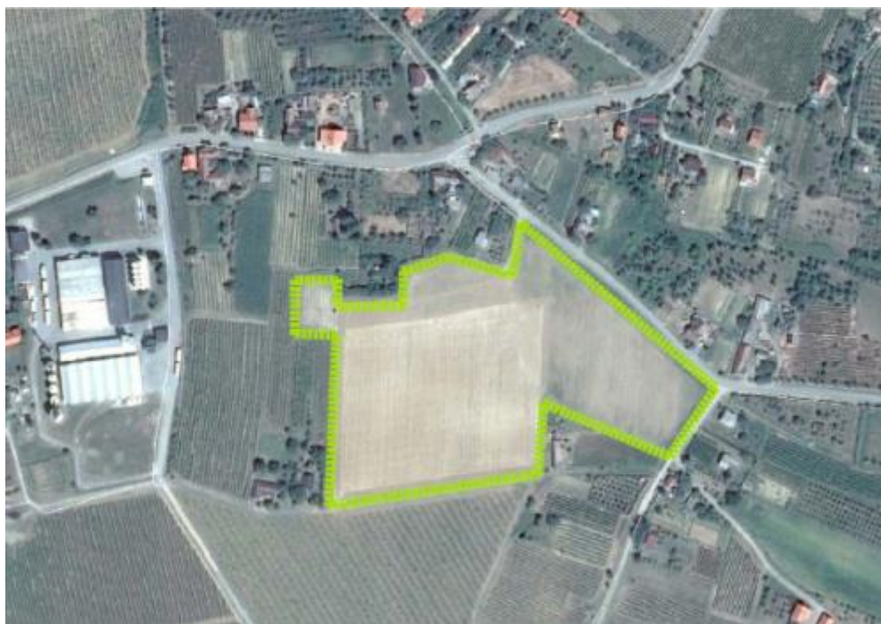
Slika 2. Površina pokušališta u Mandićevcu

Svrha pokusnih površina je odrediti učinke podloga i klonova te različitih agro i ampelotehničkih zahvata na urod i kakvoću grožđa pojedinih sorata ( http://www.fazos.unios.hr/hr/o-fakultetu/ustrojstvo-fakulteta/pokusalista/mandicevac/ ).