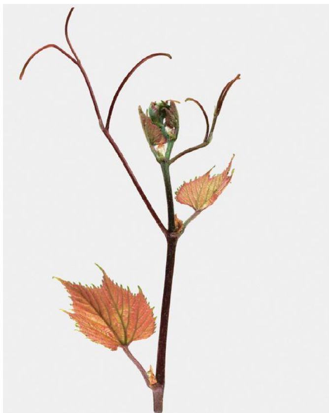
Slika 7. Mladi listovi i vrh mladice kod podloge Kober 125AA

( https://plantgrape.plantnet-project.org/img/greffes143.jpg )