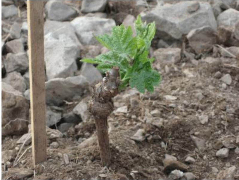
Slika 3. Izgled podloge i plemke kod mlade loze

( https://i1.wp.com/www.gnojidba.info/wp-content/uploads/2013/06/Cijep-vinove-loze.png )