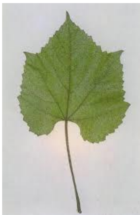
Slika 5. List vinove loze kod podloge Kober 5BB

( https://plantgrape.plantnet-project.org/media/cache/fiche_thumb/img/greffes131.jpg )