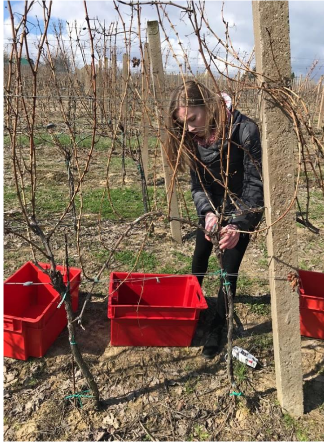
Slika 8. Orezivanje rozgve