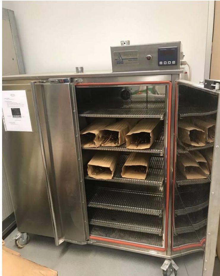
Slika 10. Priprema uzoraka za sušenje u sušioniku

Daljni tijek pokusa nastavljen je na Fakultetu agrobiotehničkih znanosti Osijek gdje su još isti dan nakon rezidbe određena dva prosječna uzorka (po jedan za svaku ispitivanu loznu podlogu) od uzoraka orezane rozgve dobivenih u vinogradu. Prosječni uzorci su zatim stavljeni na sušenje (Slika 10.) u sušionik (tip ST 800 T, 5000 W).