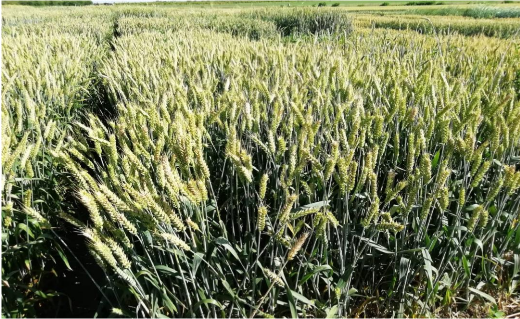
Slika 4. Kultivar Sana

U Hrvatskoj je 1995. godine priznata po mnogima najkvalitetnija krušna pšenica Divana (Slika 5.). Kultivar farinografske kvalitetne grupe A1, poboljšivač, s oko 16% bjelančevina koja je preko 20 godina standard za kvalitetu u Hrvatskoj komisiji za priznavanje kultivara. Poboljšivači su visokokvalitetni kultivari s visokom količinom bjelančevina, visoke kvalitete te imaju veliku sposobnost miješanja u smjesama s manje kvalitetnim kultivarima te im na taj način poboljšavaju krušno pekarska svojstva. Cilj prilikom stvaranja ovoga kultivara išao je u smjeru ekološke poljoprivrede s naglaskom na vrlo visoku kvalitetu (Jošt, 2016.). Višegodišnji prosjek uroda u pokusima sorte komisije iznosio je oko 5,5 t/ha.