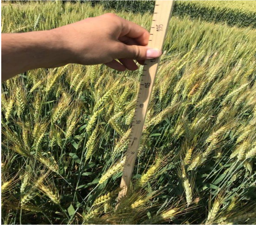
Slika 6. Mjerenje visine stabljike pšenice, lipanj 2018.