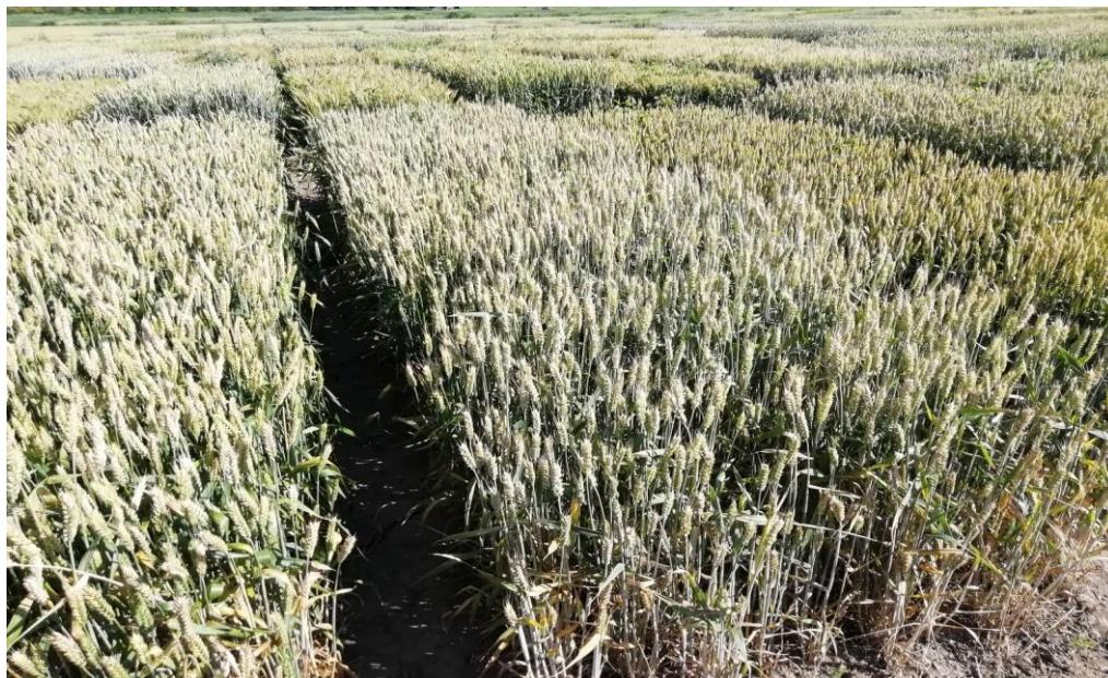
Slika 2. Kultivar Žitarka

Žitarka (Slika 2.) je srednje rani kultivar ozime pšenice, proizveden na Poljoprivrednom institutu Osijek. Polupatuljasti kultivar visine stabljike oko 70 cm. Genetski potencijal rodnoći veći je od 9 t/ha. Kvalitetan je krušni kultivar, kojemu masa 1000 zrna u prosjeku iznosi 42 g. Žitarka ima vrlo dobru otpornost prema niskim temperaturama, vrlo je tolerantna prema najčešćim bolestima i jedna od najotpornijih kultivara prema polijeganju ( www.agroportal.com ).