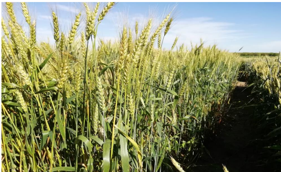
Slika 5. Kultivar Divana

U Hrvatskoj je 1995. godine priznata po mnogima najkvalitetnija krušna pšenica Divana (Slika 5.). Kultivar farinografske kvalitetne grupe A1, poboljšivač, s oko 16% bjelančevina koja je preko 20 godina standard za kvalitetu u Hrvatskoj komisiji za priznavanje kultivara. Poboljšivači su visokokvalitetni kultivari s visokom količinom bjelančevina, visoke kvalitete te imaju veliku sposobnost miješanja u smjesama s manje kvalitetnim kultivarima te im na taj način poboljšavaju krušno pekarska svojstva. Cilj prilikom stvaranja ovoga kultivara išao je u smjeru ekološke poljoprivrede s naglaskom na vrlo visoku kvalitetu (Jošt, 2016.). Višegodišnji prosjek uroda u pokusima sorte komisije iznosio je oko 5,5 t/ha.