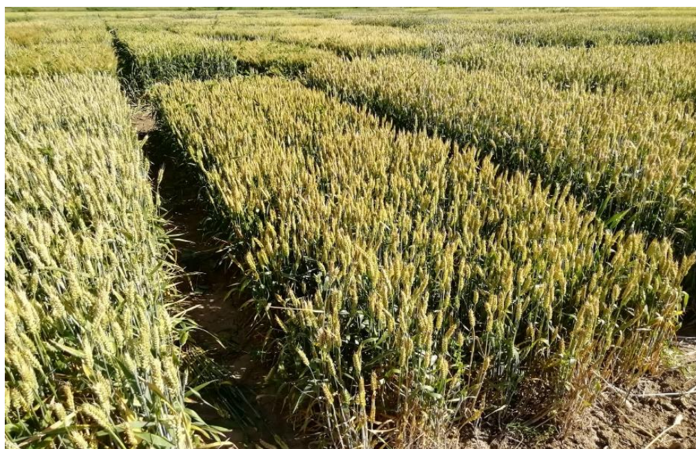
Slika 3. Kultivar Srpanjka

Kultivar Srpanjka (Slika 3.) najraniji je kultivar Poljoprivrednog instituta Osijek, kreirana 1989. godine. Ozima pšenica vrlo niske stabljike, vrlo dobre tolerantnosti na polijeganje uz kvalitetan i visokorodan prinos. Genetski potencijal rodosti veći je od 10 t/ha uz sadržaj vlažnog lijepka od oko 25%. Masa 1000 zrna u prosijeku iznosi 37 g. Tolerantna je na niske temperature i brzo se oporavlja nakon zime. Visoke i stabilne urode zrna ostvaruje temeljem velikog broja rodni klasova po jedinici površine. Optimalni rok sjetve je od 10. do 25. listopada s 650 – 700 klijavih zrna/m 2 (www.poljinos.hr).