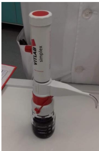
Slika 4: DPPH reagens