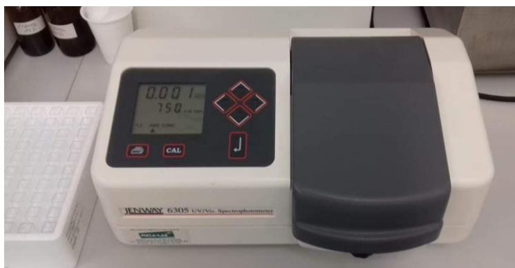
Slika 3: Spektrofotometar

Nakon toga se epruvete ostave na tamnom mjestu 30 minuta te se očita apsorbancija na spektrofotometru pri valnoj duljini od 750 nm.