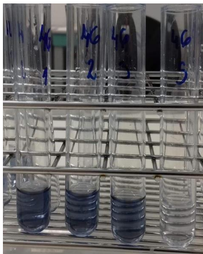
Slika 2: Epruvete sa reagensima nakon 30 minuta stajanja na tamnom mjestu

U laboratorijsku čašu odvaži se 15 g meda, a zatim se taj med otopi s malo destilirane vode. Kada se med otopi, otopina se prenese u odmjernu tikvicu od 50 ml i dopuni se destiliranom vodom do oznake na tikvici. Sadržaj odmjerne tikvice dobro se promućka kako bi se tekućine izmiješale, a zatim se sadržaj vraća u laboratorijsku čašu. Sljedeći korak je priprema 4 epruvete za svaki uzorak meda. Epruvete se označavaju oznakama 1, 2, 3 i S. U epruvete 1, 2 i 3 automatskom pipetom dodaje se 0.1 ml otopine meda. U epruvetu S dodaje se 0.1 ml analog šećera. Epruveta S služi kao slijepa proba. Zatim se u svaku epruvetu dodaje 1 ml 10% Folin-Ciocalteu reagensa. Sadržaj tih epruveta dobro se promućka na vorteksu. Nakon 5 minuta, u sve epruvete dodaje se 1 ml 7,5% \text{Na}_2\text{CO}_3 i ponovno se promiješa na vorteksu. Nakon tog postupka, epruvete se stavljaju na tamno mjestu i ostavljaju 30 minuta. Nakon 30 minuta, spektrometrom se očitava apsorbanca pri 750 nm.