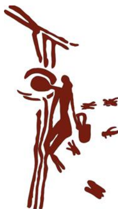
Slika 1: Crtež na kamenu, Bicom, Španjolska, 8000. g. pr. Kr. ( http://www.heathmonthoney.com.au/bees/HoneyHistory.htm )