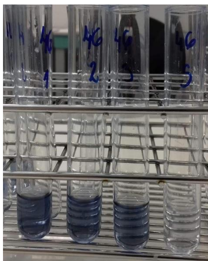
Slika 2: Epruvete sa reagensima nakon 30 minuta stajanja na tamnom mjestu

U laboratorijsku čašu odvažuje se 15 g meda, a zatim se taj med otopi s malo destilirane vode. Kada se med otopi, otopina se prenese u odmjernu tikvicu od 50 ml i dopuni se destiliranom vodom do oznake na tikvici. Sadržaj odmjerne tikvice dobro se promućka kako bi se tekućine izmiješale, a zatim se sadržaj vraća u laboratorijsku čašu. Sljedeći korak je priprema 4 epruvete za svaki uzorak meda. Epruvete se označavaju oznakama 1, 2, 3 i S. U epruvete 1, 2 i 3 automatskom pipetom dodaje se 0.1 ml otopine meda. U epruvetu S dodaje se 0.1 ml analog šećera. Epruveta S služi kao slijepa proba. Zatim se u svaku epruvetu dodaje 1 ml 10% Folin-Ciocalteu reagensa. Sadržaj tih epruveta dobro se promućka na vorteksu. Nakon 5 minuta, u sve epruvete dodaje se 1 ml 7,5% \text{Na}_2\text{CO}_3 i ponovno se promiješa na vorteksu. Nakon tog postupka, epruvete se stavljaju na tamno mjestu i ostavljaju 30 minuta. Nakon 30 minuta, spektrometrom se očitava apsorbanca pri 750 nm.