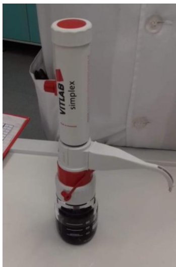
Slika 4: DPPH reagens