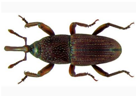
Slika 2. Žitni žižak – imago

Imago je tamnosmeđe do crne boje, dužine 3 – 4,5 mm (Slika 2.). Povoljni uvjeti za razvoj su temperatura 21 – 28 °C, relativna vlaga zraka 50 – 60 %, te vlaga zrna 13,5 – 14 %. Štetu čine ličinka i imago tako što izjedaju unutrašnjost zrna. Mogu imati 6 do 8 generacija.