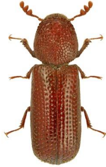
Slika 7. Žitni kukuljičar – imago