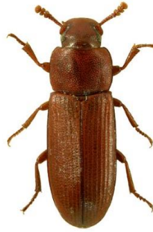
Slika 4. Kestenjasti brašnar – imago