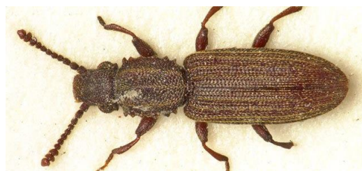
Slika 6. Surinamski brašnar – imago

Sekundarni štetnik, tankog i spljoštenog tijela, tamno smeđe boje, veličine 2,5 – 3,5 mm (Slika 6.). Ličinka blijedožute boje sa smeđim prugama, dužine 4 mm. Optimalni uvjeti za razvoj su temperatura 32,5 °C i relativna vlaga 90 %. Ima 2 – 4 generacije godišnje. Velika pojava štetnika ukazuje da je počeo proces samozagrijavanja mase zrna.