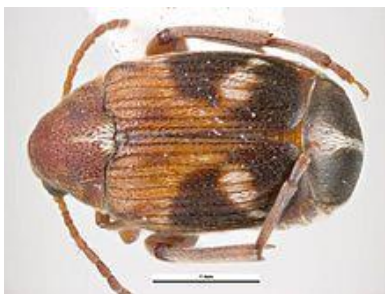
Slika 3. Četverotočkasti žižak – imago ženjke

Imago je veličine 2 – 3,5 mm, tijelo prekriveno kratkim dlačicama (Slika 3.). Ličinke su bijele boje, obrasle dlačicama i bez nogu. Ubušuju se u zrno i tako čine štete koje su vidljive tek nakon što imago izađe iz zrna. Primarni je štetnik. Optimalna temperatura za razvoj je 32 °C, a relativna vlaga zraka i do 90 %.