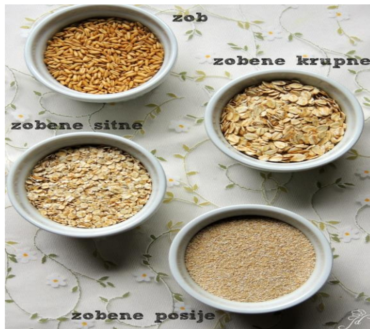
Slika 1. Zobene pahuljice

Zob je ranije korištena za proizvodnju kruha, ali s porastom standarda zob se koristi za proizvodnju prehrambenih proizvoda koji su lako probavljivi i imaju veliku hranidbenu vrijednost, kao npr. zobene pahuljice, gris, flekice, brašno za posebne namjene, itd. (Slika 1.). U zrnu zobi prosječno ima oko 13% vode, 10-12% bjelančevina, 55-60% ugljikohidrata, oko 10% celuloze, oko 5% ulja i oko 4% mineralnih tvari (Gagro, 1997.).