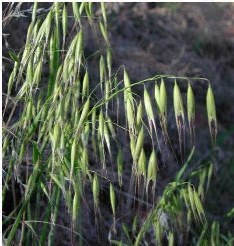
Slika 8. Avena fatua