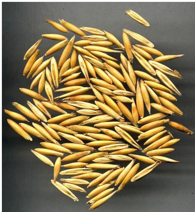
Slika 7. Plod zobi

Masa 1000 zrna iznosi oko 20 do 25 grama, a hektolitarska težina oko 45 do 50 kilograma (Mlinar, 2009.). Razlog tome je veliki udio pljevice.