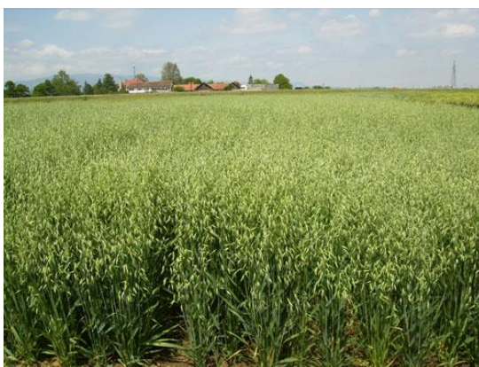
Slika 11. Bc Marta

2008.), na četiri mjesta u Hrvatskoj, sorta zobi Bc Marta ostvarila je prosječan prinos zrna 6.626 kg/ha. Postigla je veći prinos od standardne sorte Džoker za 3,8%. Nova sorta povoljno kombinira svojstva rodnosti i razne komponente kvalitete. Na osnovu kemijskih analiza, sorta Bc Marta sadrži prosječno: 13% bjelančevina, 6,03% masti, 3,42% minerala, 68,16% bezdušičnih ekstraktivnih tvari (NET) i niži povoljni udio celuloze 10,26 %. Sorta Bc Marta ima krupno i dobro ispunjeno zrno. Hektolitarska masa u prosjeku iznosi 51,67 kg/hl a masa 1000 zrna 35,12 grama (Mlinar, 2009.).