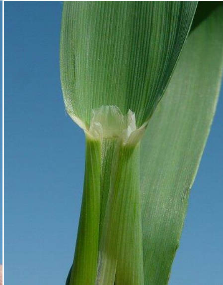
Slika 5. Ligula