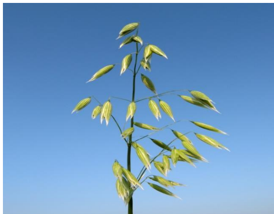
Slika 6. Metlica

Cvat zobi je metlica, koja se sastoji od glavne grane a iz njenih nodija se ravijaju bočne grančice na kojima su manje ili više povijeni klasići (Slika 6.).