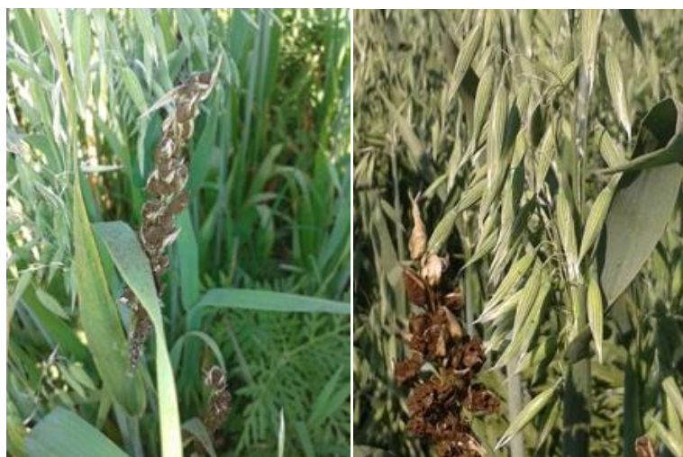
Slika 12. Prašna snijet - Ustilago avenae

Osim prašne snijeti zob napadaju i neke druge bolesti kao što su: narančasta hrđa ( Puccinia triticina ), pepelnica ( Blumeriella graminis ), hrđa ( Puccinia sp. ), mrežasta pjegavost ( Pyrenophora hordei ), pepelnica ( Erysiphe graminis f. sp. hordei ), siva pjegavost.