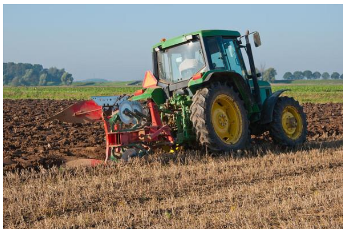
Slika 10. Priprema tla za sjetvu zobi

Cilj mehaničke obrade tla je stvaranje sitno-mrvičaste strukture, kakvu u prirodi najbolje naprave kišne gliste, ako u tlu ima dovoljno organske tvari koju one probavljaju i pretvaraju u humus (Zimmer i sur., 2009.).