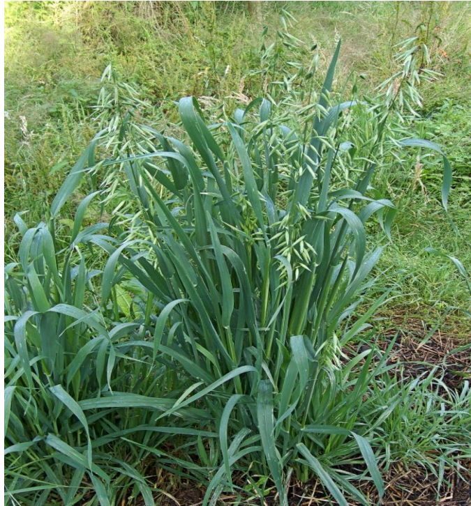
Slika 3. Stabljika zobi