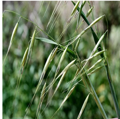
Slika 9. Avena sterilis