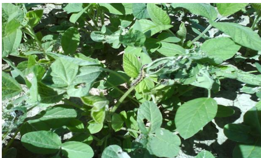
Slika 9. Gusjenica stričkovog šarenjaka ( Vanessa cardui L.)

Šareni leptir koji ima 2-3 generacije godišnje, polifagna je i migratorna vrsta. Leptir na lišću polaže sitna, spljoštena, svijetlozelena jaja, a njegove gusjenice mogu narasti do 4 cm, dlakave su, crne s dvije žute lateralne linije. Napadnuto lišće gusjenice povezuju nitima praveći karakteristična gnijezda. Gusjenice se prvo hrane na korovima (stričak, čičak i dr.), a kasnije prelaze na soju (Raspudić i sur., 2007.). Za suzbijanje štetnika ( Vanessa cardui L.) koristimo insekticide na bazi Cipermetrina u dozi 1.2 l/ha. Karenca je osigurana vremenom primjene i iznosi 42 dana.