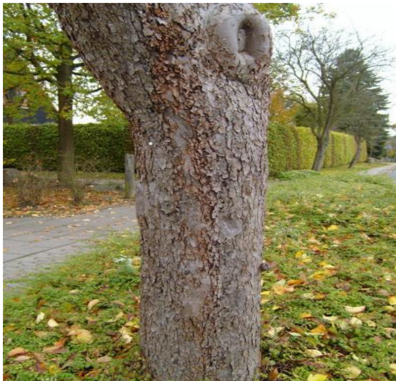
Slika 2. Kora debla jabuke

Deblo je ne razgranati organ voćke. Funkcija mu je da provodi i čuva hranjiva. Početak debla započinje od korijenovog vrata do prvih skeletnih grana krošnje. Visina debla ovisi o uzgojnom obliku i bujnosti same sorte, te o podlozi na koju je sorta cijepljena. Deblo je promjera do 1m, kora debla jabuke (Slika 2.) je ispucana tamno siva i ljušti se (Dubravec i Dubravec, 1998.). Prema visini debla voćke razvrstavamo na: nisko stablašice, polu stablašice i visoko stablašice ( Miljković, 1991.).