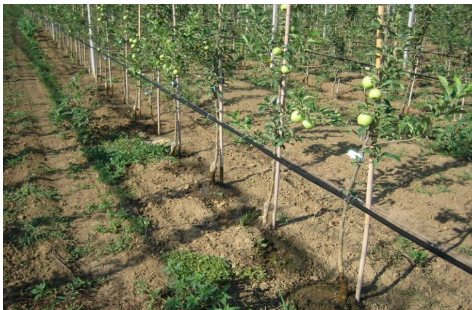
Slika 8. Sustav navodnjavanja kap po kap

Vlaga zraka koja pogoduje jabuci iznosi do 60 %. Kod intenzivnog nasada preporučljiv je sustav navodnjavanja kap po kap (Slika 8.), a najveće potrebe za vodom se očituju u vrijeme cvjetanja. Općenito se može reći da su povoljni uvjeti za uzgoj tamo gdje je od svibnja do rujna palo oko 600 mm oborina (Miljković, 1991.). Jabuka je osjetljiva na vremenske neprilike poput tuče gdje dolazi do oštećenja lista i ploda što pogoduje razvoju bolesti te slabijoj kvaliteti ploda.