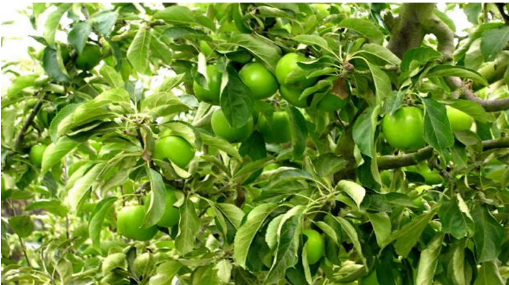
Slika 14. Granny Smith krošnja

U Hrvatskoj se uzgaja još od 1970. godine, a popularnost je stekla zbog specifične arome i karakterističnog zelenog izgleda. Ima jako dugu vegetaciju od cvatnje do berbe treba proći od 180 do 200 dana. Najbolje ju je uzgajati u područjima s dugom vegetacijom. Preporučuje se uzgoj u mediteranskom području uz navodnjavanje i u istočnim dijelovima Hrvatske gdje su jeseni duge i tople (Miljković, 1991.).