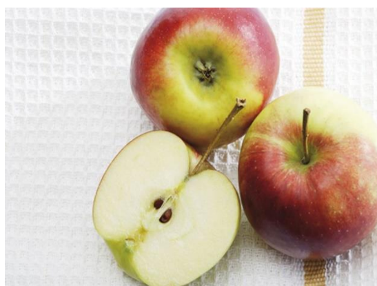
Slika 7. Plod jabuke sa sjemenkama

Plod jabuke (Slika 7.) je okruglastog oblika ovisno o sorti, može biti i blago duguljasto okruglast (Hulina, 2011.). Boja ploda ovisi od sorte a može biti: zelena, žuta, žuto zelena, crvena itd. Plod kod jabuke nastaje iz plodnice i usplođa ( Miljković, 1991.). Vanjski jestivi dio ploda bijele je boje, sočan, kiselkast ili slatkast (Dubravec i Dubravec, 1998.). Unutrašnjost ploda jabuke kod većine sorata je bijele boje, ali se može naći i plod s crvenkasto bijelim nijansama boje. Sjemenke su dugoljaste, smeđe ili crvenosmeđe boje.