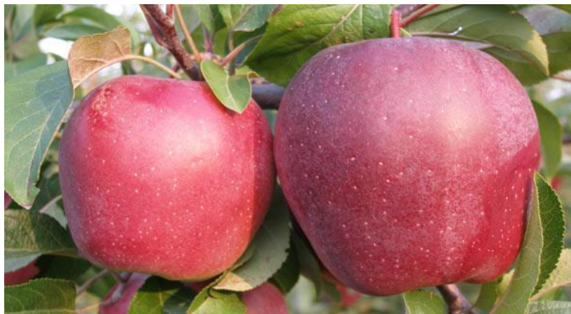
Slika 15. Sorta Gloster

Plodove jabuke Gloster konzumiraju potrošači koji vole oblik ploda Zlatnog delišesa, ali ne vole sladunjavost i mirišljivost delišesa (Krpina, 2004.). Uzgoj ove sorte preporuča se u većim i manjim voćnjacima te u vrtovima (Miljković, 1991.).