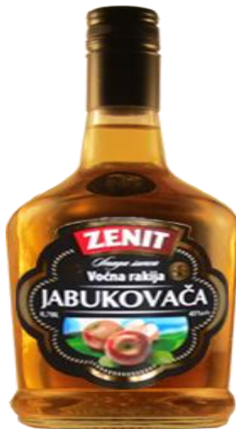
Slika 18. Jabukovača

Za rakiju od jabuka (Slika 18.) se najčešće koriste truli i prezreli plodovi, koji se teško mogu prodati u svježem stanju. Jabuke se znatno više koriste kao svježe i u konzerviranom stanju te se rijetko prerađuju u rakije. Za proizvodnju jabukovače su prikladne sve sorte jabuka, bitno je da su plodovi u punoj zrelosti. U Hrvatskoj jabukovača nije toliko popularna među potrošačima, dok je u Francuskoj pod zaštitom geografskog porijekla zbog iznimne kakvoće. Sadrži dva puta više alkohola nego šljivovica.