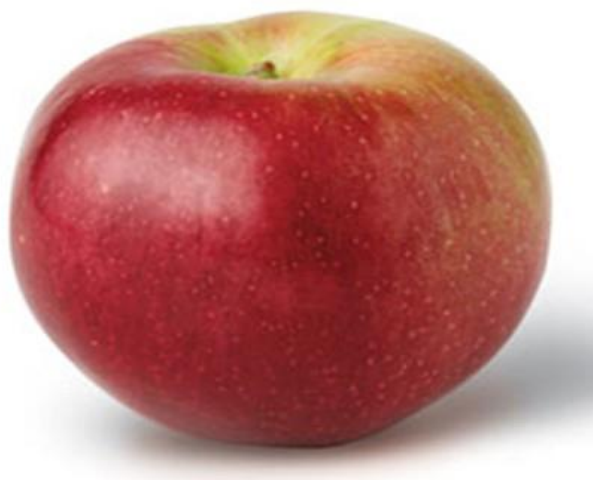
Slika 13. Idared

Plodovi su krupni okruglastog oblika, žućkasto zelene boje prekriveni crvenom nijansom boje. Kožica je debela i glatka. Ima dugu skladišnu sposobnost, zadovoljavajući okus i izgled. Idared je kasna zimska sorta. Za postizanje pune kakvoće ploda potrebno je 156 - 170 dana.