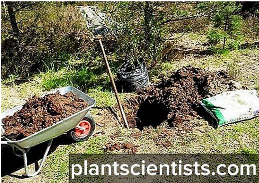
Slika 10. Jame za sadnju sadnica jabuke

Prije sadnje nasada jabuka potrebno je uraditi laboratorijsku analizu tla (Krpina, 2004.). Tom analizom utvrđuje se postoje li ograničenja za uzgoj jabuke (npr. % humusa, sadržaj fosfora i kalija). Ukoliko kakvoća tla nije zadovoljavajuća potrebno ju je popraviti agrotehničkim mjerama poput meliorativne gnojidbe. Prije oranja na dubinu 40 - 50 cm dodaju se fosforna i kalijeva mineralna gnojiva kako bi se umiješala u tlo gdje će se nakon nekoliko godina razviti korijenova mreža. Jame za sadnju (Slika 10.) trebaju biti dovoljne veličine da korijen stane u njih. Sadnja se može obavljati u proljeće ili u jesen. Kod intenzivnog nasada jabuka s uzgojnim oblikom vitko vreteno, razmak sadnje bi trebao biti 3,2 \times 1,2 m što čini 2.605 sadnica po hektaru (Krpina, 2004.).