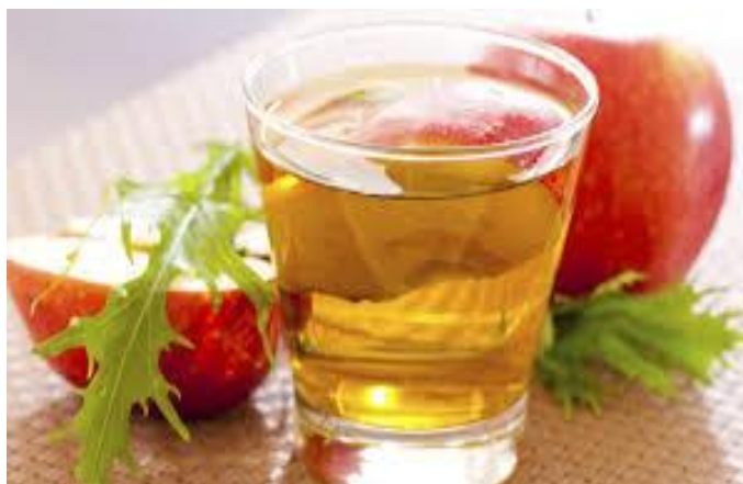
Slika 17. Jabučni ocat

Jabučni ocat djeluje pozitivno na kožu, regulira tjelesnu težinu te čisti organizam. Također je bogat kalijem mineralom koji je bitan za zdravlje ljudskog organizma. Zbog brojnih ljekovitih svojstava poželjno ga je koristiti pri začinjavanju salata, raznih variva.