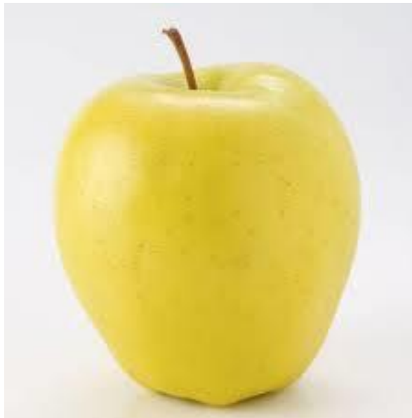
Slika 12. Zlatni delišes

Sorta je nastala u SAD-u, a proširena je u uzgoju u skoro svim zemljama Europe, pa tako i kod nas (Miljković, 1991.). Zimska je sorta i dozrijeva krajem rujna ili početkom listopada.