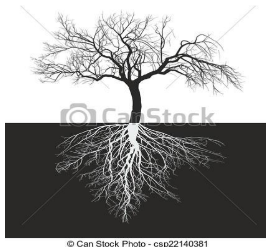
Slika 1. Korijen jabuke

Korijen je podzemni vegetativni organ voćke te ima vrlo važnu funkciju u pogledu opstanka same biljke. On učvršćuje biljku u tlo, upija vodu i hranjive tvari, provodi ih do nadzemnog dijela biljke, a služi i za skladištenje rezervnih hranjivih tvari (Miljković, 1991.). Korijen jabuke (Slika 1.) sastoji se od dubokog korijena te bočnog korijenja. Glavni korijen je sličan mrkvi, a bočno korijenje može dosegnuti širinu i dva puta veću od krošnje stabla jabuke. U proljeće i jesen je najbrži porast korijena. Tijekom ljeta korijen više ne raste jer je zauzet opskrbljivanjem nadzemnog dijela vodom i hranjivim tvarima. Korijenov sustav čini deblje ili skeletno i tanje ili obrastajuće korijenje. Po obliku, građi i funkciji razlikujemo primarnu i sekundarnu građu korijena. Skeletno korijenje čini sekundarnu građu korijenovog sustava, a funkcija mu je učvršćivanje voćke te provođenje vode i otopljenih hranjivih tvari. Tanje korijenje čini primarnu građu korijenovog sustava, na primarnoj građi korijena razvijene su korijenove dlačice koje imaju glavnu apsorptivnu ulogu (Miljković, 1991.).