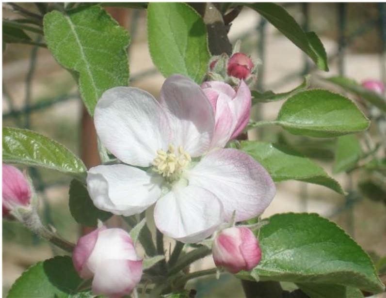
Slika 5. Cvijet jabuke

Cvijet je dio biljke iz kojega se razvija plod sa sjemenom. Jabuka (Slika 5.) počinje cvasti u proljeće, a iz pupoljaka zajedno s cvijetom izbijaju i listovi. Ovisno o sorti cvatnja traje od travnja do lipnja, a cvjetanje traje dvadesetak dana (Hulina, 2011.). Građa cvijeta jabuke prikazana je na (Slici 6). Cvjetovi su pravilni, dvospolni, pentamerni s dvostrukim ocvijećem. Relativno su krupni (3 - 4 cm), skupljeni su u gronjama i bijele su boje s blago ružičastim nijansama (Kojić, 1988.). Latice su duže od lapova. Plodnica je izgrađena od 3 – 5 plodnih listova i srasla je cvjetištem. Prašnika ima 15 – 50. Cvjetne stapke su fino dlakave (Dubravec i Dubravec, 1998.). Središnji cvijet se naziv još i kraljevski on se otvara prvi i iz njega se može razviti veći plod.