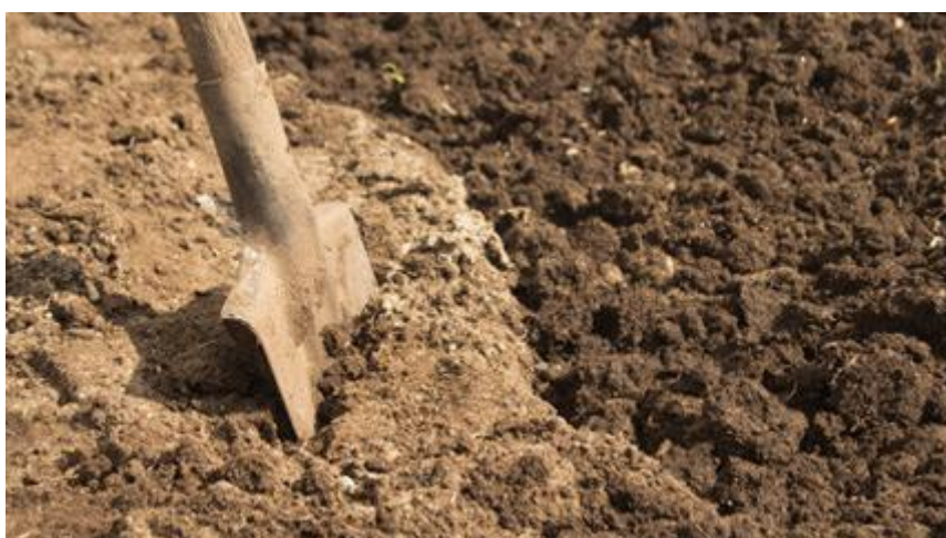
Slika 9. Ilovasto pjeskovito tlo

Dokazano je da postoji uzajamna korelacija između razvijenosti korijenovog sustava i nadzemnog dijela biljke. Stoga će na tlima koja omogućuju dobar razvitak korijena, biti dobro razvijena i nadzemna masa, a samim tim i bolja rodnost (Miljković, 1991.).