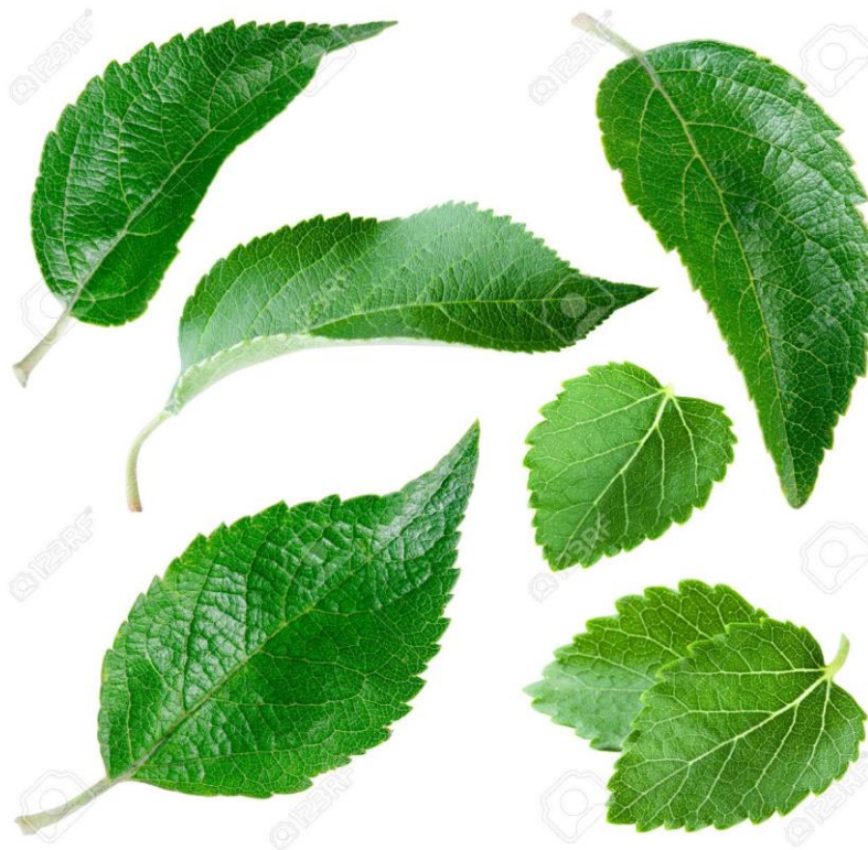
Slika 4. List jabuke

List se sastoji od rukavca, peteljke i plojke. Osim što list stvara hranjiva, izlučuje i vodu kroz sićušne pući na donjoj strani plojke (Miljković, 1991.). Svaka sorta, ili grupa sorti odlikuje se specifičnim oblikom lista, što doprinosi poznavanju sorte (Šoškić, 2008.). Jabuka je listopadna biljka što znači da listovi opadaju prije zime, a ponovo se stvaraju u proljeće. Listovi imaju kratke i dlakave peteljke (Dubravec i Dubravec, 1998.). Rub lista jabuke je lagano nazubljen. Gornja površina lista jabuke (Slika 4.) je tamnozeleno dok je donja površina lista zelenkasto bjelkaste nijanse. Većina kultiviranih stabala jabuke ima ovalne listove. Plojke lista su pri bazi srcolike ili okruglaste, a na vrhu zašiljene.