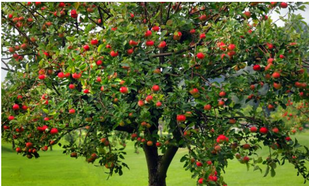
Slika 3. Krošnja jabuke

Krošnja je razgranati dio stabljike koji se nalazi iznad debla. Krošnja (Slika 3.) kod jabuke može biti s provodnicom ili bez provodnice ovisno o uzgojnom obliku. Neki od uzgojnih oblika krošnje jabuke su vitko vreteno i vretenasti grm. Krošnje mogu biti kišobranaste, piramidalne, vretenaste ili kotlaste (Dubravec i Dubravec, 1998.). Na krošnji razlikujemo deblje i tanje skeletne grane.