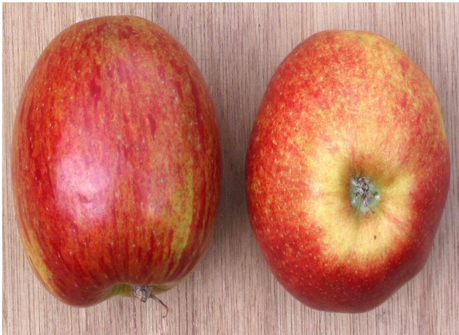
Slika 16. Sorta Jonagold

Odlična je jabuka za jelo voćne salate i pečenje.