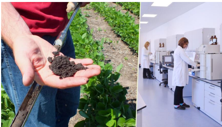
Slika 1. Kemijska analiza tla

važnosti vrijeme i način uzorkovanja biljnog materijala, što ovisi o kulturi koja se uzorkuje kao i o vegetativnom porastu.