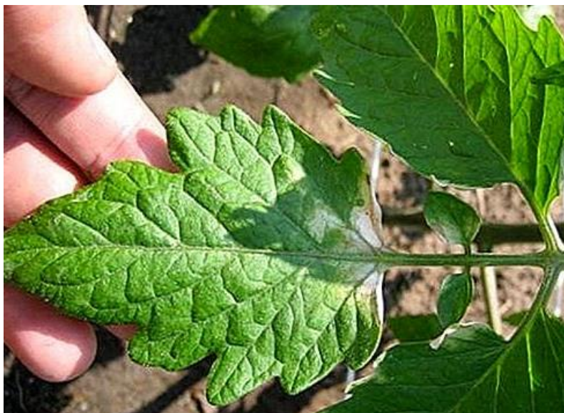
Slika 5. Opekotine na listovima rajčice

U ranoj fazi vegetacije biljke imaju malu lisnu površinu i stoga je njihov kapacitet za usvajanje i akumulaciju hraniva mali te je zbog toga ograničena primjena folijarnih gnojiva.