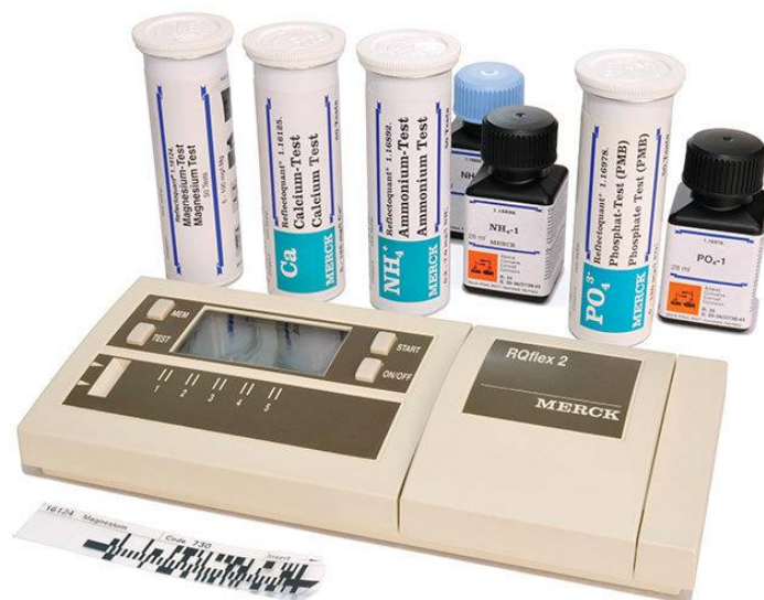
Slika 2. Reflectoquant