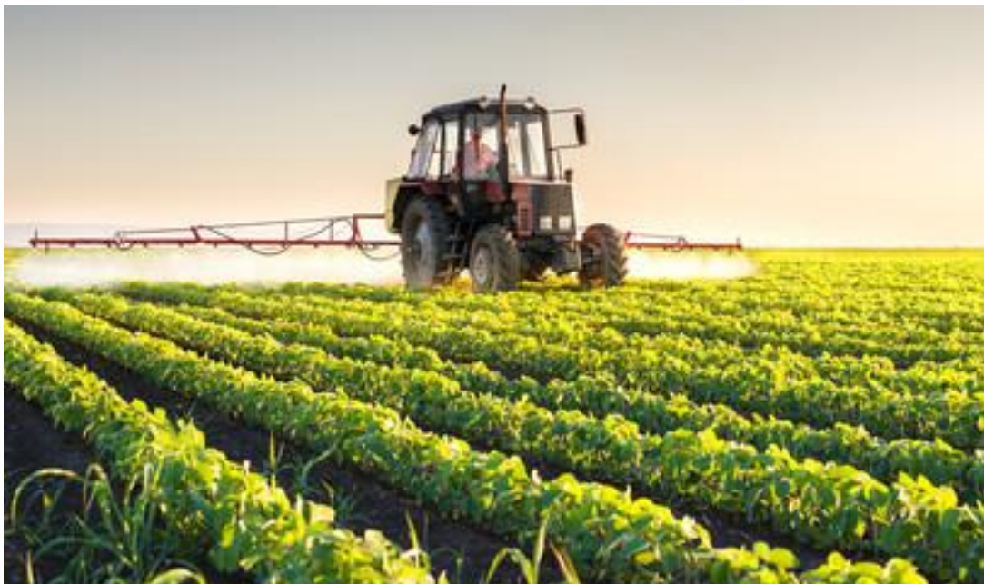
Slika 4. Folijarna gnojidba

Folijarna gnojidba (slika 4.) je tehnika gnojidbe usjeva putem lista ili drugih nadzemnih dijelova biljke. Biljke su sposobne apsorbirati esencijalne elemente biljne ishrane kroz puči i epidermu lista. Folijarna gnojidba je prikladna za primjenu manjih količina gnojiva, osobito mikroelemenata. Folijarna gnojidba zapravo je dodatna gnojidba (prihrana) te ne predstavlja zamjenu za gnojidbu usjeva putem tla, dakle preko korijena, jer su potrebe biljaka za hranivima (tu se prvenstveno misli na makroelemente dušik, fosfor i kalij) najčešće veće od koncentracija koje podnosi lišće, pa bi trebalo vrlo često primjenjivati folijski sprej što nije niti praktično, a niti financijski isplativo.