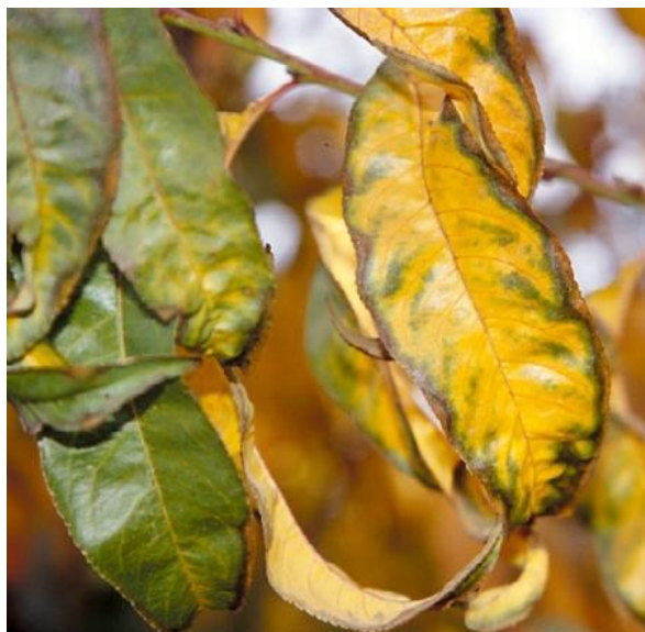
Slika 6. Opekotine listova breskve zbog primjene visoke koncentracije Uree