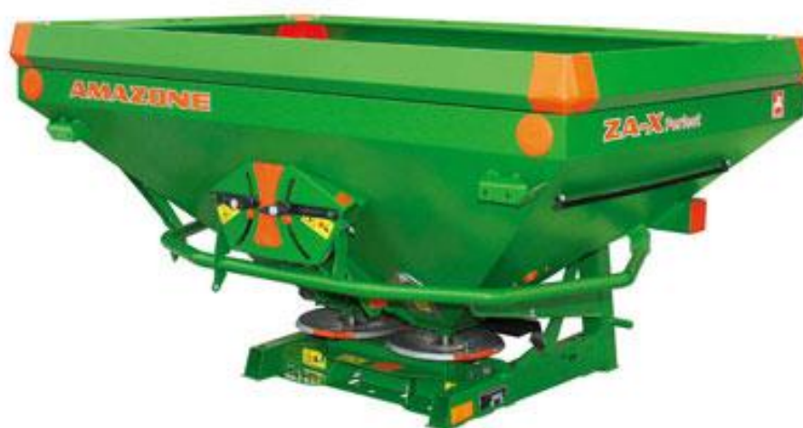
Slika 8. Rasipač za umjetna gnojiva

Dobar rast i razvoj pšenice ovisi o pristupačnosti hraniva u tlu. S odgovarajućim količinama hraniva u svim fazama razvoja pšenice postižu se visoki i stabilni prinosi. Gnojidba mineralnim gnojivima je redovna agrotehnička mjera kod pšenice, a posebice gnojidba s dušikom, fosforom i kalijem (Vukadinović i Lončarić, 1998.). Gnojidba se obavlja rasipačima (Slika 8.).