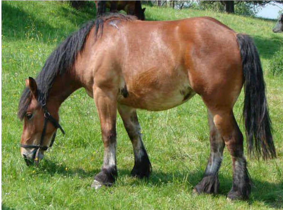
Slika 5. Kestenasti konj s "mearly" bojom dlake