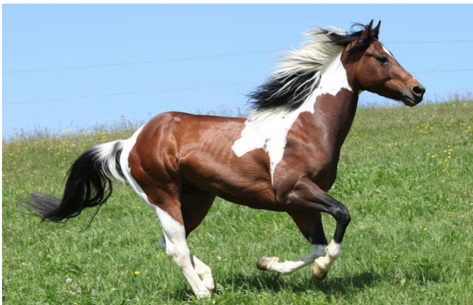
Slika 11. “Overo“ gen