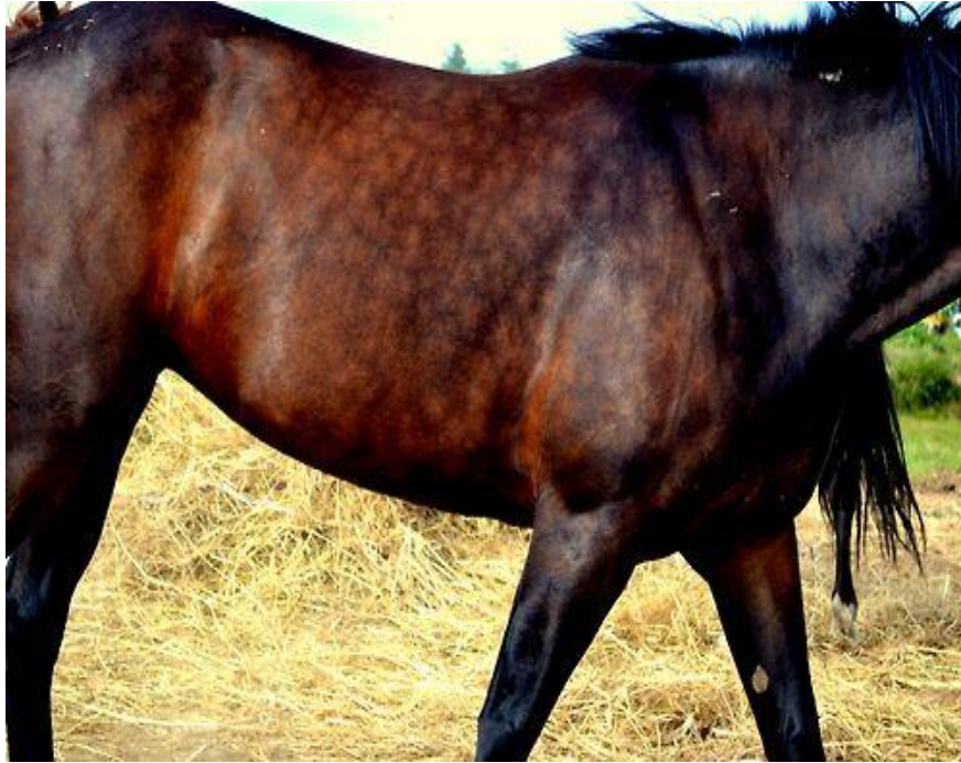
Slika 4. Dorat šarac s "sooty" bojom