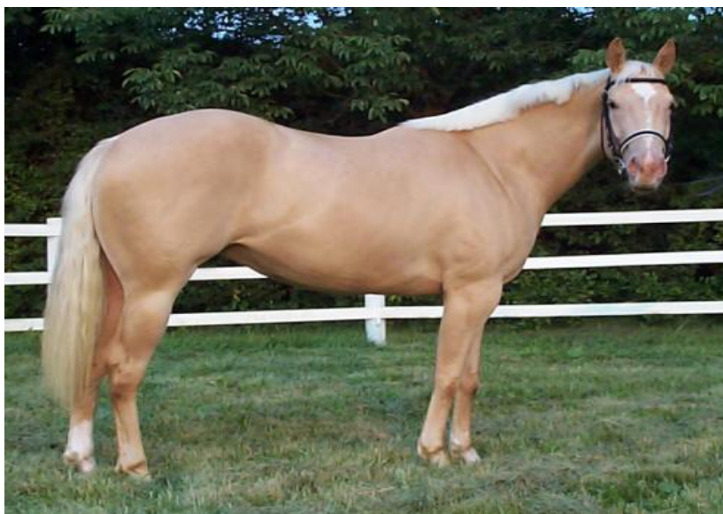
Slika 6. Palomino boja konja