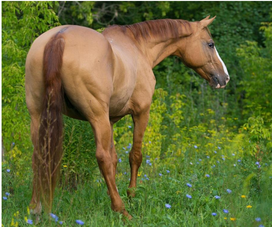
Slika 3. Kestenasti konj s "shade" bojom

(Sponenberg, 1996.). Te su izmjene najuočljivije na crvenoj i smeđoj boji dlake, poput dorata. Na dorat konjima nijansa boje može varirati od vrlo tamnocrvene (krvava smetnja) do isprane žute (svijetla boja). Konji boje kestena također mogu varirati u nijansama. Učinak nijansiranja na crne konje nije očit, međutim, mnogi crni konji izbledje tijekom ljetnih mjeseci zbog vrućine i sunčeve svjetlosti i nazivaju ih “ ljetnim crnim konjima“ .