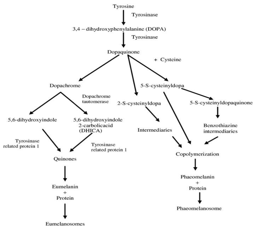
Slika 1. Sinteza melanina - biokemijski put (Robins, 1991)

Melaninski pigment sintetizira se u malim mjehurićima unutar melanocita koji se nazivaju melanosomi. Postoje dvije vrste melanosoma: eumelanosomi i feomelanosomi. Melanosomi proizvode pigmente unutar melanocita. Melanosomi migriraju od sredine do ruba melanocita uz pomoć mikrotubula. Na vanjskom rubu stanice melanosomi oslobađaju svoj pigment procesom egzocitoze, koja prenosi melanosome iz dendritičkih procesa melanocita u epidermalne stanice, koje se zatim ugrađuju u okolne keratinocite i osovinu rastućih stanica kose (Searle, 1968; Moellmann et al., 1988; Sponenberg, 1997).