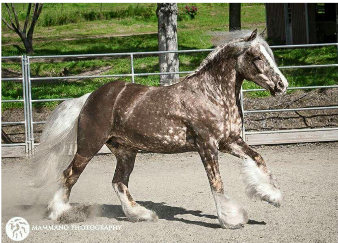
Slika 8. Crni konj s “ silver dapple“ bojom

Castle i Smith (1953.) prvi su opisali treći gen za razrjeđivanje boje, srebrni dapple. Do toga dolazi zbog dominantnog gena (Z) na lokusu . Ovaj gen utječe samo na crni pigment i crveni pigment ostavlja nepromijenjen. Kao rezultat prisutnosti dominantnog gena, crna boja dlake razrjeđuje se u čokoladnoj ili crnoj čokoladno boji, a griva i rep razrjeđuju se u srebrno sivoj ili lanenoj boji. Razrijeđeni dorat konji nazivaju se kestenastim ili srebrnim dapple. Ovaj gen ima malo utjecaja na boju kestena, osim što stvara srebrnu grivu i rep, i naziva se srebrom, ali teško je razlikovati je od srebrene. Castle i Smith (1953) izvijestili su da gen srebrene dapple (Z) u kombinaciji sa sivim genom (G) ubrzava efekt izbjeljivanja G, tako da se konj sa genotipom Z – G može roditi bijelim ili postati takav u dobi od 1 ili 2 godine i naziva se sivo-bijelom. Ovo razrjeđivanje boja najizraženije je u pasminama Shetland, Minijaturni i Islandski, a vrlo je rijetko kod arapskih konja.