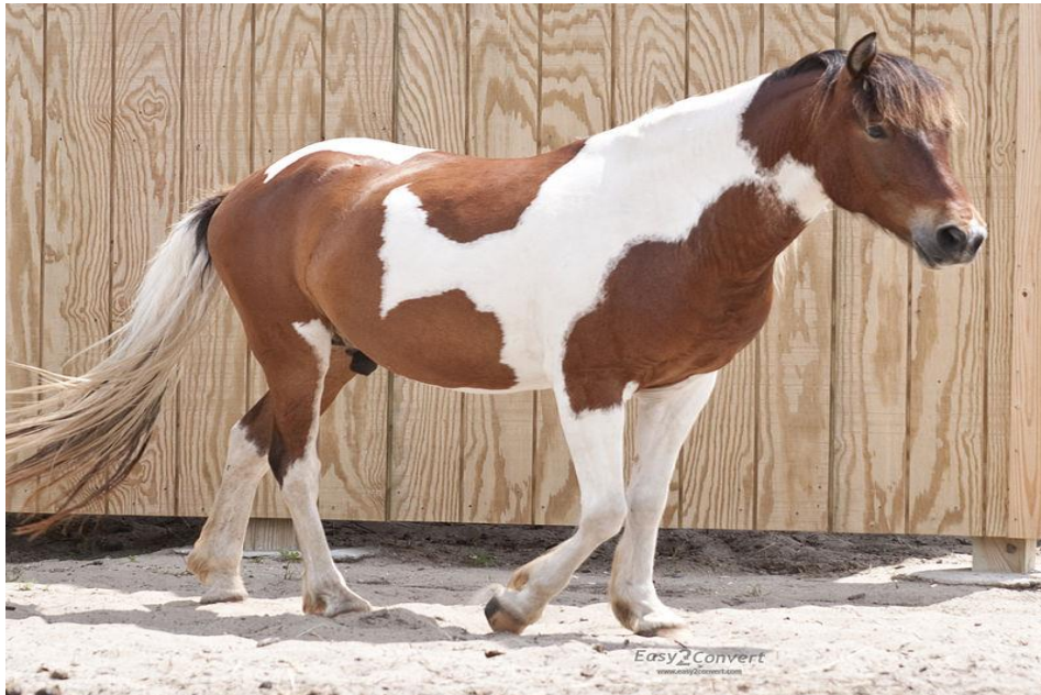
Slika 10. “Tobiano“ gen