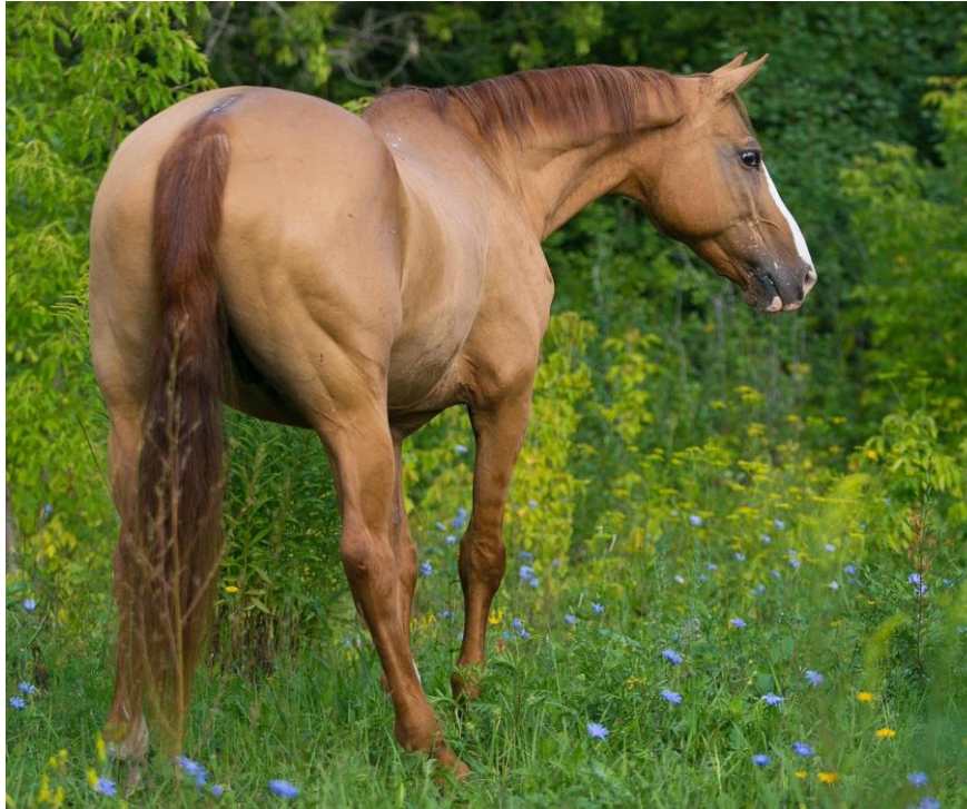
Slika 3. Kestenasti konj s "shade" bojom

(Sponenberg, 1996.). Te su izmjene najuočljivije na crvenoj i smeđoj boji dlake, poput dorata. Na dorat konjima nijansa boje može varirati od vrlo tamnocrvene (krvava smetnja) do isprane žute (svijetla boja). Konji boje kestena također mogu varirati u nijansama. Učinak nijansiranja na crne konje nije očit, međutim, mnogi crni konji izblijede tijekom ljetnih mjeseci zbog vrućine i sunčeve svjetlosti i nazivaju ih “ ljetnim crnim konjima“ .