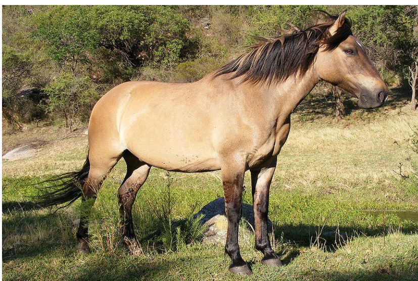
Slika 7. Dun boja ili "classic" i "zebra" dun

Dun gen razrjeđuje i eumelanin i pheomelanin. Crvena boja tijela je razrijeđena do blijedo crvena ili žuto-crvena, a crna boja tijela razrijeđena je do mišje sive. Dun alel proizvodi više ili manje žuto-crvene životinje s crnim točkama s primitivnim oznakama.