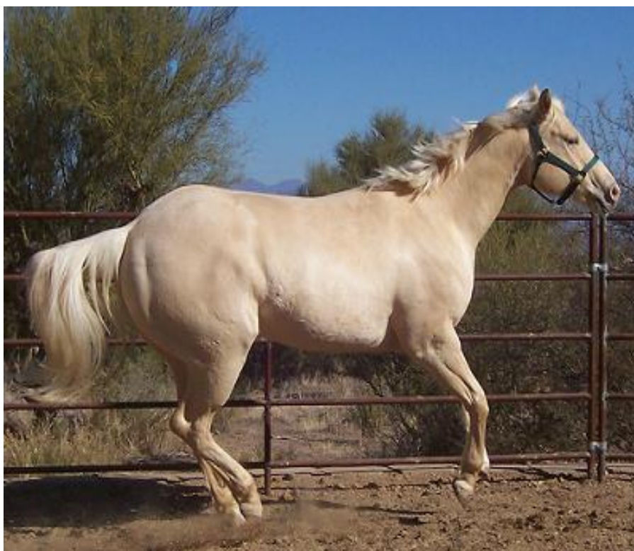
Slika 9. Konj s “champagne“ bojom

Genetska kontrola šampanj skupina boja nastaje zahvaljujući dominantnom genu (Ch). Ovaj alel razrjeđuje crnu do smeđu i crvenu do žutu boju. Recesivni alel divljeg tipa (Ch +) omogućuje izražavanje potpuno intenzivnih boja. U kombinaciji s cremello alelom (CCr), gen pokazuje aditivnu interakciju.