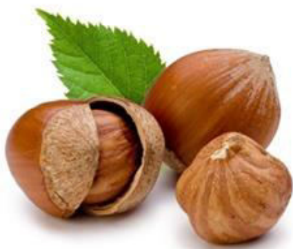
Slika 1. Plod lijeske-lješnjak

Plodovi se beru kada sazriju, a to se događa kada plod dobije žućkasto-smeđu boju. Na većim plantažama lijeske, gdje su zastupljene sorte čiji plodovi lako ispadaju iz kupule, berba se može obaviti posebnim beračicama. Obrani plodovi u omotaču se stave u tanji sloj da se prosuše. Prilikom sušenja omotač puca i plod se oslobađa. Sušenje plodova je završeno kada je postotak vlažnosti u njima manji od 13 posto. Nakon što se završi sušenje, plodovi se sortiraju po veličini. Prosječni randman jezgre je oko 45 posto, odnosno od 37 do 55 posto što ovisi o sorti. Prema Brzici (2002.) u intenzivnom nasadu lijeske može se dobiti prosječni godišnji prirod oko 2000 kg/ha. Pravi prirod se računa po tome koliko se dobije jezgre s jedinice površine.