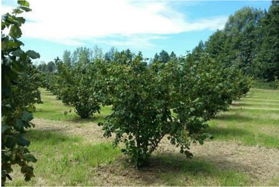
Slika 1. Uzgojni oblik grmolikog veza