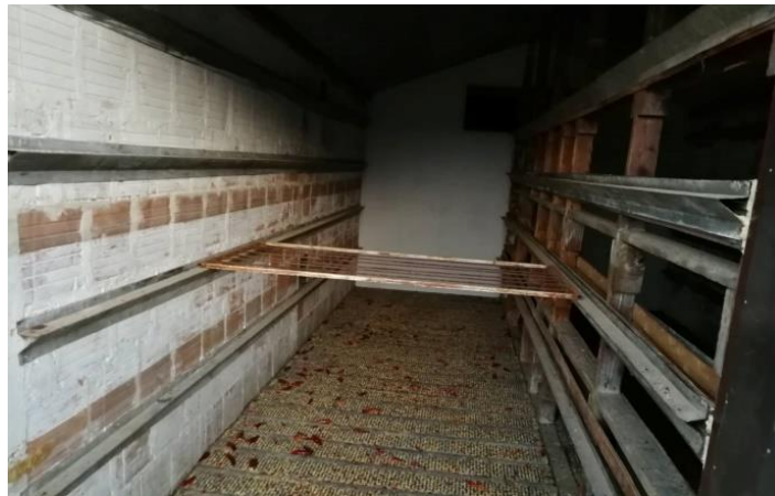
Slika 18. Unutarnji izgled sušare