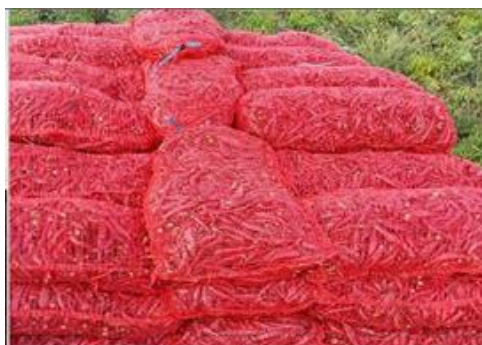
Slika 15. Paprika u mrežastim vrećama

Grane paprike su jako krhke stoga se berba mora obavljati pažljivo kako se ne bi polomile. Nakon što se plod ubere stavlja se u plastične posude. Kada se posuda napuni istrese se u mrežaste vreće (Slika 15.), a vreće se slažu na traktorsku prikolicu (Slika 16.).