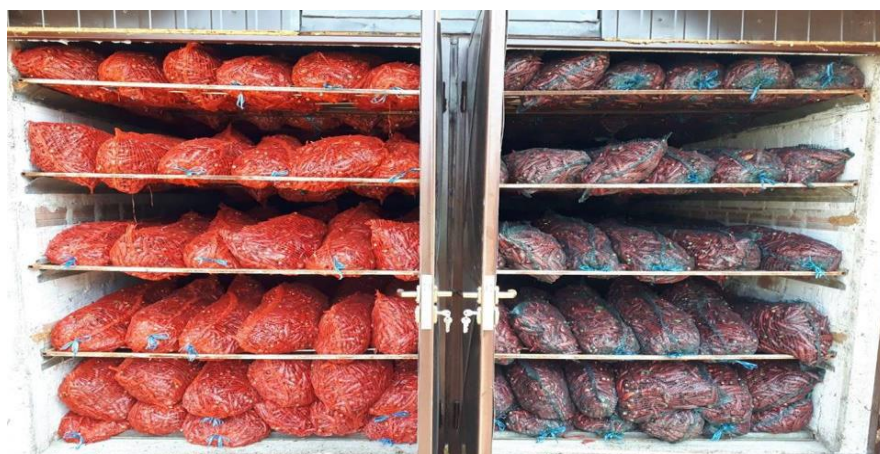
Slika 19. Složena paprika spremna za sušenje