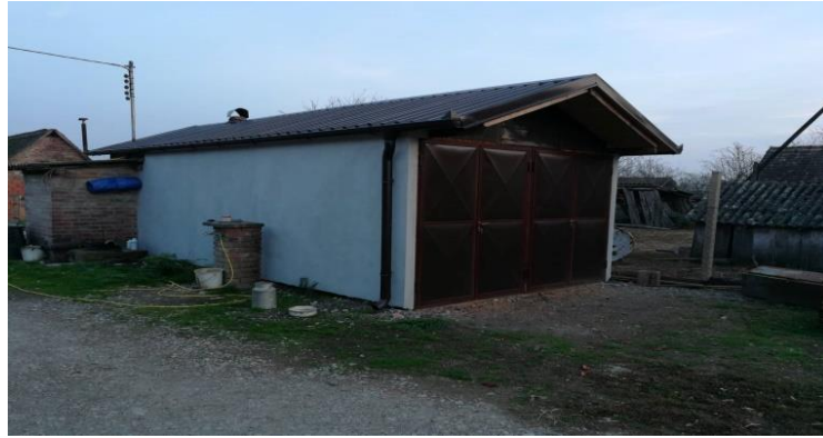
Slika 17. Vanjski izgled sušare