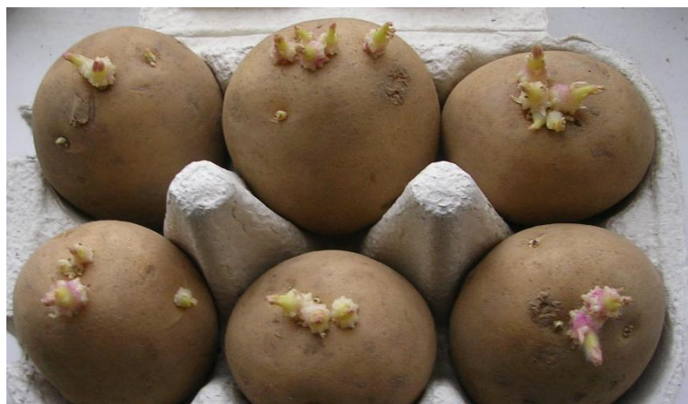
Slika 6. Pravilno naklijali sadni gomolji krumpira