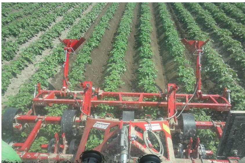
Slika 14. Nagrtanje humaka kada su biljke visine 15 - 20 cm