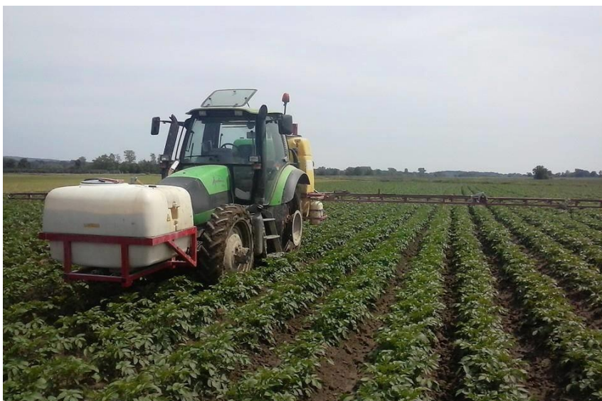
Slika 15. Kemijsko tretiranje nasada