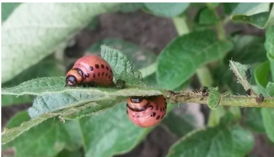
Slika 17. Ličinke krumpirove zlatice