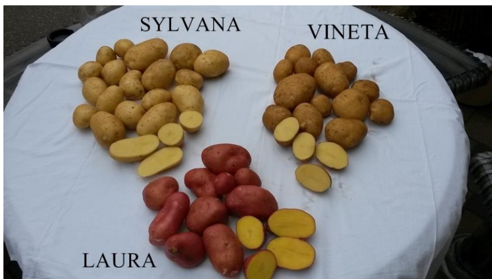
Slika 7. Sorte krumpira na OPG-u Kolarić

Laura je osjetljiva na herbicid Metribuzine (Sencor, itd.). Visoke doze, kao i tretiranje nakon pojavljivanja problema treba izbjegavati.