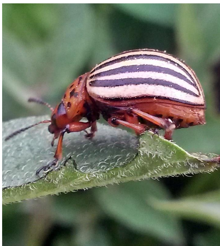
Slika 18. Imago krumpirove zlatice