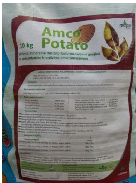
Slika 13. Amco Potato