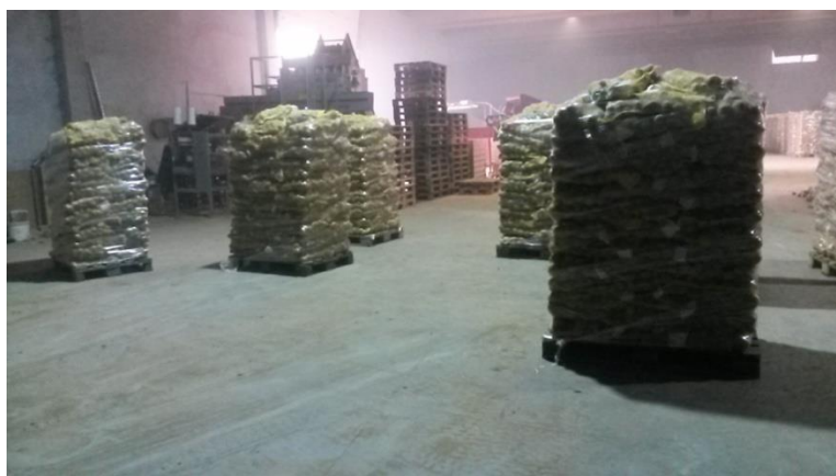
Slika 22. Krumpir na paletama spreman za daljnji transport