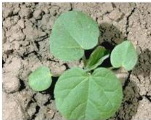
Slika 16. Širokolisni korov ( Abutilon )

Na OPG-u Kolarić aplicirani su herbicidi PLATEEN 2 kg/ha i SENCOR 0,5 kg/ha.