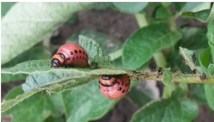
Slika 17. Ličinke krumpirove zlatice