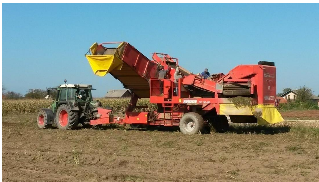
Slika 19. Dvoredni kombajn za vađenje krumpira vučen traktorom