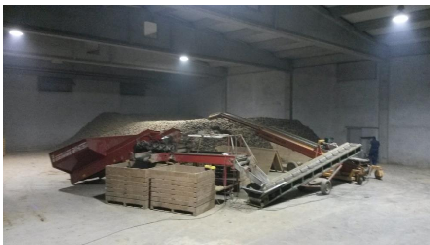
Slika 20. Sortiranje krumpira nakon vađenja i popunjavanje skladišta

Izvađen gomolj na sebi uvijek sadržava nešto zemlje bez obzira što se vadilo po suhom vremenu. Krumpir koji se doprema u skladište s većom količinom zemlje, teže je skladišti te dolazi do gubitaka. Za pravilno skladištenje krumpira vrlo je važno sortiranje gomolja te se na taj način odvajaju pojedine klase krumpira: sjemenski, nekoliko grupa konzumnih (jestivih), stočni (sitni, za hranidbu stoke), oštećeni i bolesni. Sortira se pomoću sortirača (Slika 20.). Sortiranje se ne smije provoditi ako je krumpir vlažan i nečist (ostaci zemlje na gomolju) zbog toga što veliki dio vlažne zemlje ostaje na dijelovima valjaka te je onemogućeno pravilno sortiranje. Prilikom sortiranja najvažnije je da se odvoje bolesni i oštećeni gomolji, što je veoma teško uočiti ako se na gomoljima nalazi veća količina zemlje. Prilikom sortiranja i uskladištenja koristimo sredstvo za posipavanje na bazi klorprofama (Tuberite N) kako bi spriječili proklijavanje gomolja tijekom skladištenja.