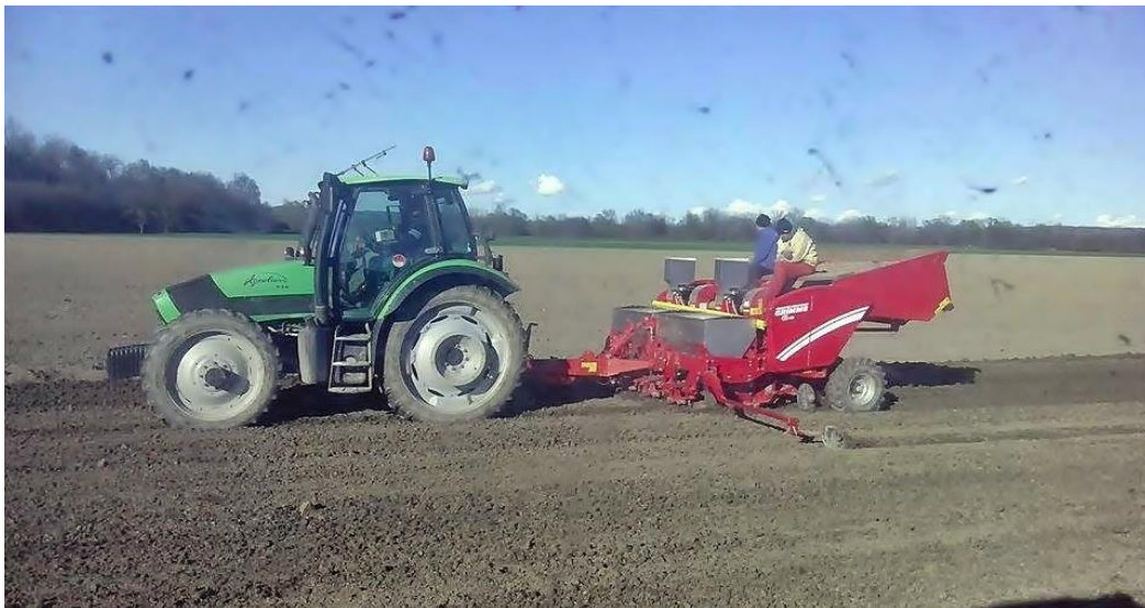
Slika 12. Sadnja krumpira