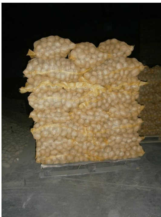
Slika 23. Pakirani krumpir u vrećama od 10 kg