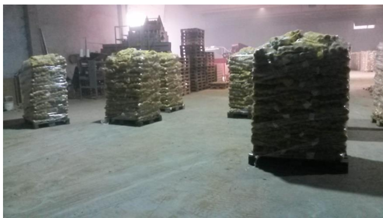
Slika 22. Krumpir na paletama spreman za daljnji transport