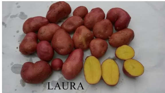
Slika 3. Gomolji sorte Laura

(40–50 cm), a u rahlim i dubokim tlima doseže dubinu i do 1 m. Korijen se razvija na podzemnom dijelu stabljike i bočno se grana 25–45 cm. Korijen se najviše razvija u fazi cvatnje, a dozrijevanjem nasada korijen polagano odumire.