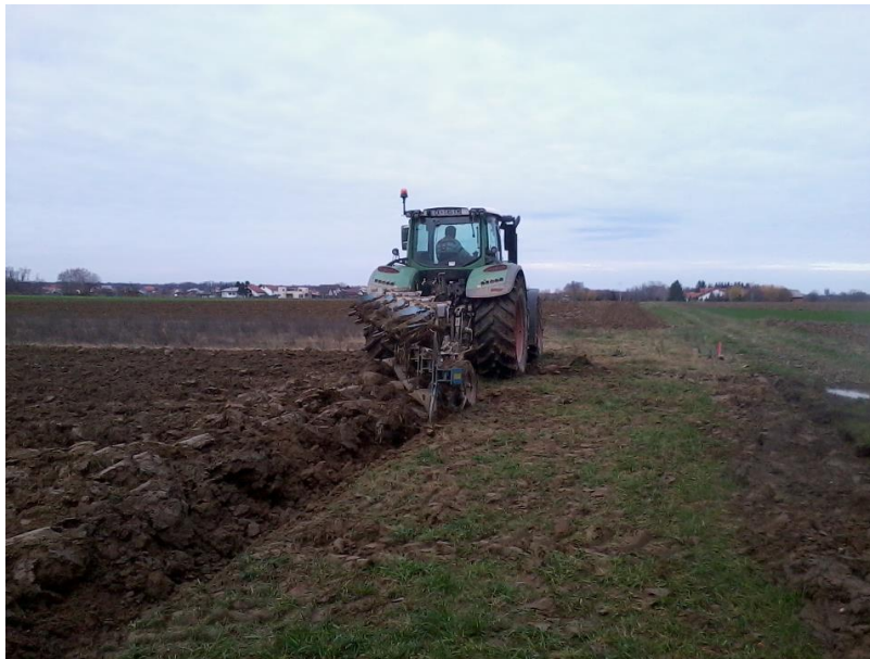
Slika 8. Jesensko oranje

Osnovna obrada odnosno oranje, mora biti kvalitetno izvedena jer naknadne agrotehničke mjere ne mogu ispraviti propuste pa se samim time i smanjuje prinos. Oranjem se u tlo unose biljni ostaci, organska gnojiva, pred startna mineralna gnojiva i drugo (Slika 8.). Oranje se mora provesti pri optimalnoj vlažnosti, jer će se u protivnom tlo nakon okretanja brazde slabo mrviti.