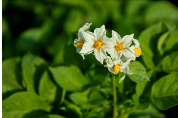
Slika 2. Cvjetovi krumpira

gomolja. Neke sorte cvatu obilno, a neke rijetko. Prerana cvatnja nedovoljno razvijenog nasada ukazuje da je usjev bio pod stresom. Nakon oplodnje, razvijaju se bobice koje u sebi sadrže 100 - 200 sjemenki. Sjemenke su sitne, plosnate i ovalne, a služe u oplemenjivanju pa čak i za direktnu sjetvu što je prednost jer se pravim sjemenim ne prenose ekonomski važni virusi.