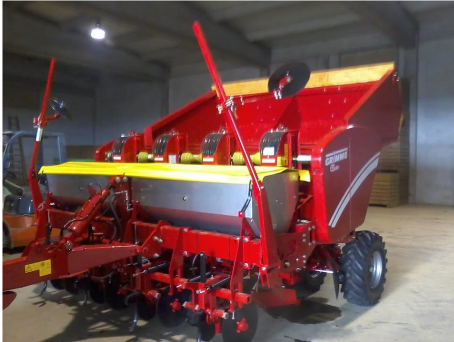
Slika 11. Sadilica za krumpir