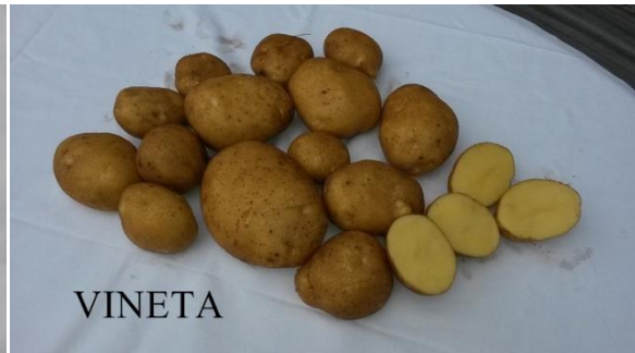
Slika 4. Gomolji sorte Vineta