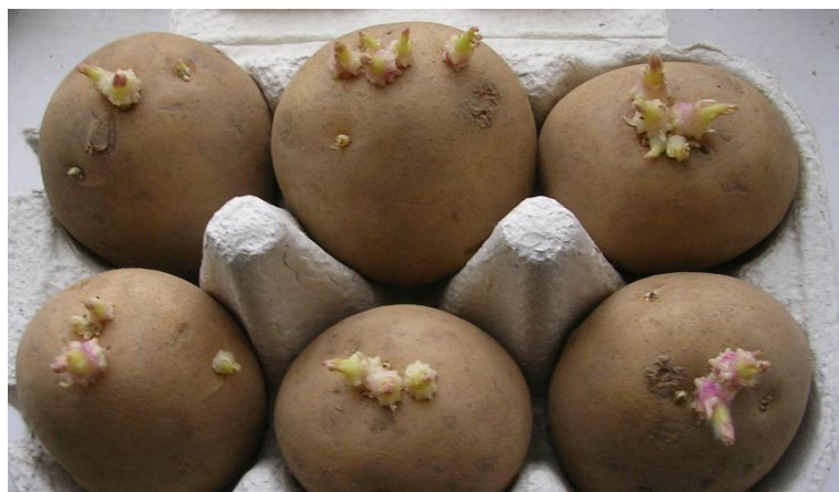
Slika 6. Pravilno naklijali sadni gomolji krumpira