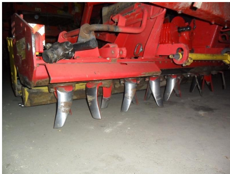
Slika 10. Zupci na rotodrljači

Zupci kod rotodrljača (Slika 10.) horizontalno rotiraju u sjetvenom sloju što je važno jer se time smanjuje stvaranje pokorice, koja je nepoželjna. Primjena rotodrljača nije moguća kod prevelike vlažnosti tla iz tog razloga što se sjetveni sloj ne prorahli već ostaju grude koje ometaju sadnju i stvaranje humaka.