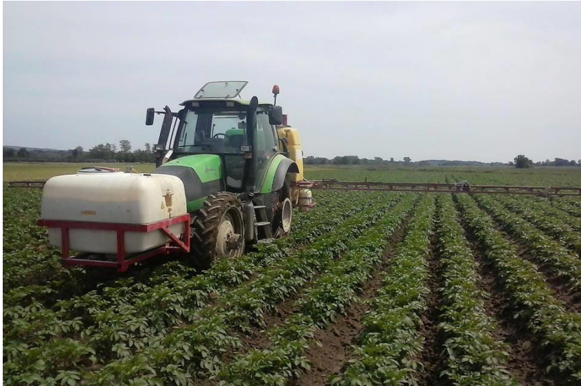
Slika 15. Kemijsko tretiranje nasada