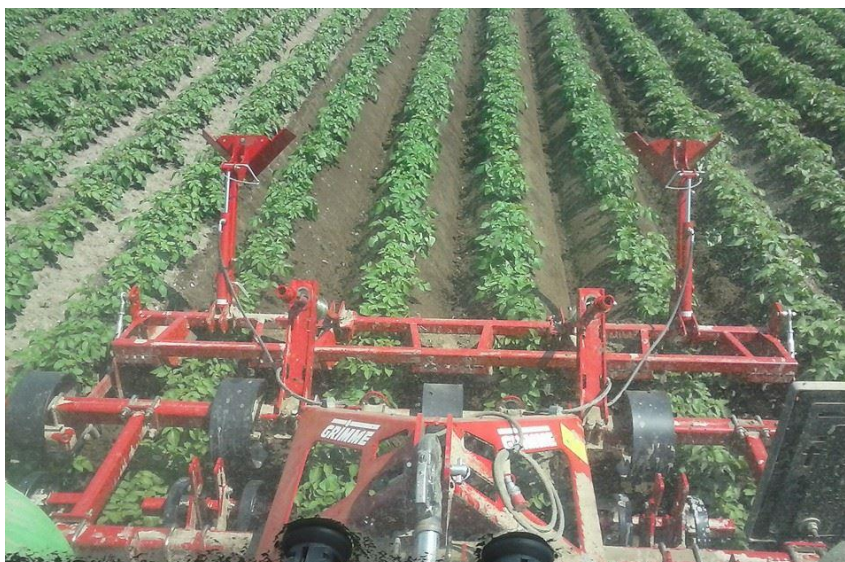
Slika 14. Nagrtanje humaka kada su biljke visine 15 - 20 cm