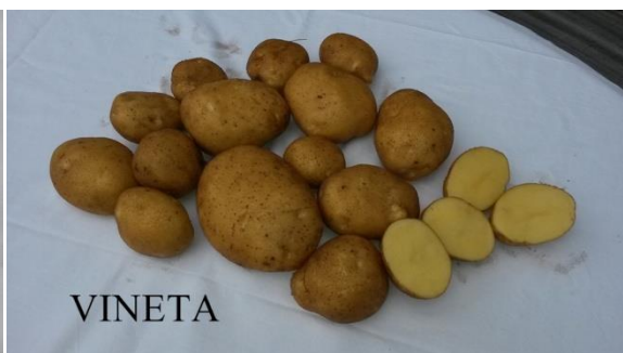
Slika 4. Gomolji sorte Vineta