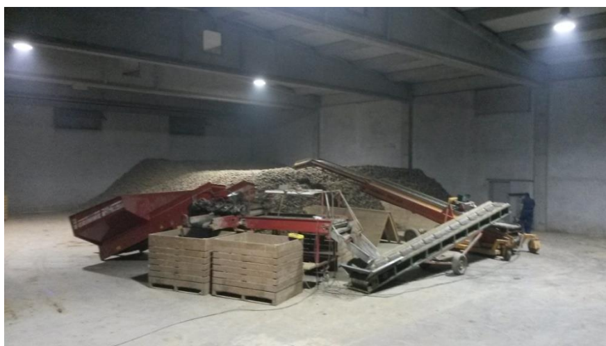
Slika 20. Sortiranje krumpira nakon vađenja i popunjavanje skladišta

Izvađen gomolj na sebi uvijek sadržava nešto zemlje bez obzira što se vadilo po suhom vremenu. Krumpir koji se doprema u skladište s većom količinom zemlje, teže je skladišti te dolazi do gubitaka. Za pravilno skladištenje krumpira vrlo je važno sortiranje gomolja te se na taj način odvajaju pojedine klase krumpira: sjemenski, nekoliko grupa konzumnih (jestivih), stočni (sitni, za hranidbu stoke), oštećeni i bolesni. Sortira se pomoću sortirača (Slika 20.). Sortiranje se ne smije provoditi ako je krumpir vlažan i nečist (ostaci zemlje na gomolju) zbog toga što veliki dio vlažne zemlje ostaje na dijelovima valjaka te je onemogućeno pravilno sortiranje. Prilikom sortiranja najvažnije je da se odvoje bolesni i oštećeni gomolji, što je veoma teško uočiti ako se na gomoljima nalazi veća količina zemlje. Prilikom sortiranja i uskladištenja koristimo sredstvo za posipavanje na bazi klorprofama (Tuberite N) kako bi spriječili proklijavanje gomolja tijekom skladištenja.