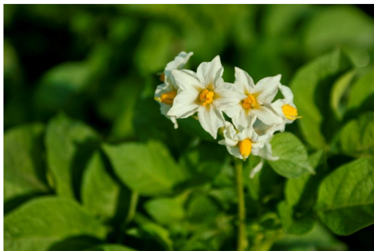
Slika 2. Cvjetovi krumpira

gomolja. Neke sorte cvatu obilno, a neke rijetko. Prerana cvatnja nedovoljno razvijenog nasada ukazuje da je usjev bio pod stresom. Nakon oplodnje, razvijaju se bobice koje u sebi sadrže 100 - 200 sjemenki. Sjemenke su sitne, plosnate i ovalne, a služe u oplemenjivanju pa čak i za direktnu sjetvu što je prednost jer se pravim sjemenim ne prenose ekonomski važni virusi.