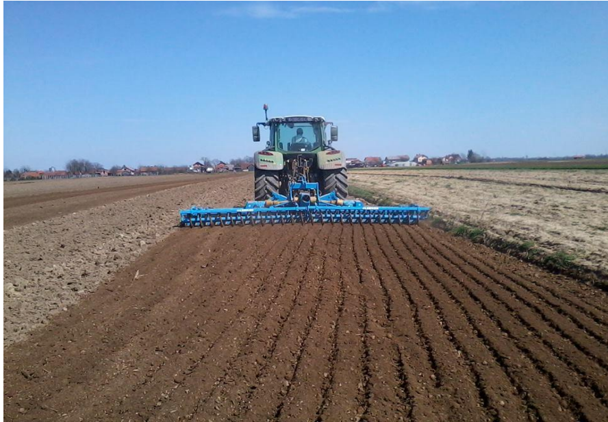
Slika 9. Predsjetvena priprema tla

Zupci kod rotodrljača (Slika 10.) horizontalno rotiraju u sjetvenom sloju što je važno jer se time smanjuje stvaranje pokorice, koja je nepoželjna. Primjena rotodrljača nije moguća kod prevelike vlažnosti tla iz tog razloga što se sjetveni sloj ne prorahli već ostaju grude koje ometaju sadnju i stvaranje humaka.