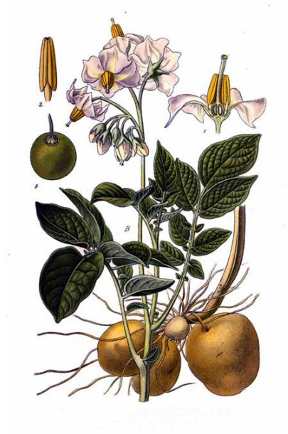
Slika 1. Biljka krumpira