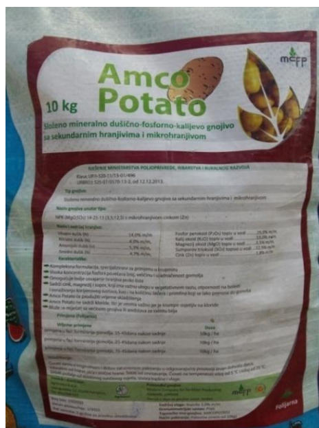
Slika 13. Amco Potato