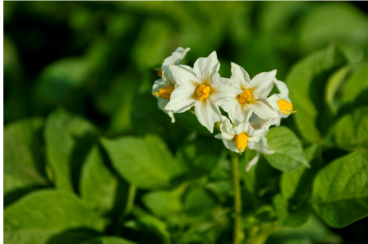
Slika 2. Cvjetovi krumpira

gomolja. Neke sorte cvatu obilno, a neke rijetko. Prerana cvatnja nedovoljno razvijenog nasada ukazuje da je usjev bio pod stresom. Nakon oplodnje, razvijaju se bobice koje u sebi sadrže 100 - 200 sjemenki. Sjemenke su sitne, plosnate i ovalne, a služe u oplemenjivanju pa čak i za direktnu sjetvu što je prednost jer se pravim sjemenim ne prenose ekonomski važni virusi.