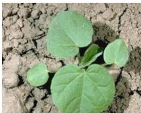
Slika 16. Širokolisni korov ( Abutilon )

Na OPG-u Kolarić aplicirani su herbicidi PLATEEN 2 kg/ha i SENCOR 0,5 kg/ha.