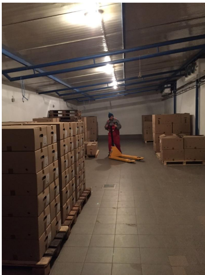
Slika 2. Izgled hladnjače za čuvanje konzumnih jaja

ciklus može se produžiti. Provodi se skraćivanjem svjetlosnog dana, redukcijom hrane i vode. Na kraju proizvodnog ciklusa nesilice se prodaju ili šalju u klaonicu. Broj useljenih kokoši i kokoši u proizvodnji često nije isti zbog mogućih uginuća koja mogu biti posljedica bolesti ili loše selekcije. Najveća moguća nesivost ostvaruje se osiguravanjem što boljih životnih uvjeta, prikladne hranidbe i zdravstvene zaštite. Nesivost izračunavamo tako da broj jaja podijelimo sa brojem kokoši i pomnožimo sa 100 kako bi dobili rezultat u postocima. Jaja treba skupljati više puta dnevno jer stajanjem u peradarniku gube na kvaliteti i mogu poprimiti miris peradarnika. Jaja su u početku sitnija i sa mogućim nepravilnostima, a tek kasnije u sredini proizvodnje postaju krupnija. U prosjeku tijekom proizvodnog ciklusa po jednoj hibridnoj nesilici najviše ima L klase jaja (masa jaja od 63g do 73g). Jaja se nakon skupljanja važu i klasiraju. Jaja koja sadrže nečistoće idu na čišćenje. Jaja se čuvaju u tamnim, hladnim i prozračnim prostorima-hladnjačama (Slika 2.).