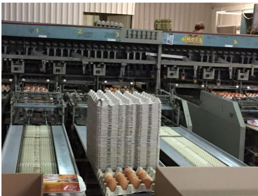
Slika 3. Izgled prostorije i uređaja za klasiranje i pakiranje jaja

(4) Uvjeti koji se moraju ispuniti da bi se odredili pojedini načini uzgoja propisani su posebnim propisima. (N.N. br 115/2006)