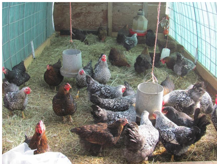
Slika 5. Držanje nesilica na dubokoj stelji

Etažno držanje podrazumijeva da se u peradarniku nalaze prečke za sjedenje nesilica dovoljno dugačke za svaka nesilica ima najmanje 15 cm dužine prečke, prečke moraju biti na međusobnom razmaku od 30 cm i 20 cm od zida. Naseljenost je do 25 nesilica po jednom metru kvadratnom iskoristivog podnog prostora. Nesilice su smještene na više etaža među kojima se mogu slobodno kretati. Ne smije biti više od 4 etaže na minimalnoj visini od 45 cm jedna iznad druge. Prva etaža mora biti odignuta od poda, a feces sa gornjih etaža ne smije pada na one ispod. Hrana i voda mora biti dostupna na svim etažama i moraju biti dostupne svim nesilicama. Pod bi trebao biti prekriven steljom. Sloboda kretanja je veća u ovakovom načinu držanja, a naseljenost peradarnika je slična kao u kaveznom držanju. Ljudski rad je manji nego kod slobodnog i poluintenzivnog držanja jer je za skupljanje jaja automatsko. Higijena jaja je bolja. Nedostatak je manji broj jaja u odnosu na intenzivnu proizvodnju, ali veći nego kod slobodnog i poluintenzivnog držanja. Ovaj način držanja kokoši prikazan je na slici 6.