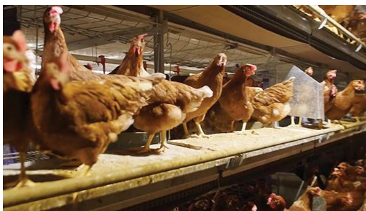
Slika 6. Etažni sustav držanja nesilica