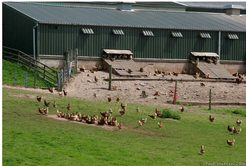
Slika 4. Slobodan način držanja nesilica

peradarniku moraju biti slični onima držanju na stelji ili na etažama. 1/3 poda mora biti prekrivena steljom, mora se ugraditi prečka za odmaranje dužine 15 cm koja ne smije biti postavljena iznad stelje i ne smije imati oštre rubove. Udaljenost između 2 prečke ne smije biti manje od 30 cm, a između prečki i zida ne smije biti manje od 20 cm. Prednost ovakvog načina držanja je u većoj dobrobiti nesilica, a nedostaci su manji broj jaja po nesilici, utjecaj okoliša i vremenskih uvjeta na zdravlje peradi, otežana preventiva i provođenje zdravstvene zaštite, veći utrošak ljudskog rada, lošija higijena jaja, slabija ekonomičnost i dobit u odnosu na intenzivan sustav proizvodnje.