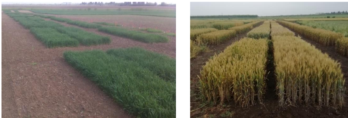
Slika 2. Izgled pokusnih parcela u fazi vlatanja i pred žetvu

količine dušika u tlu, stoga nije bilo potrebe za većom gnojidbom. Gnojidba pšenice obavljena je 18.02.2019. godine sa 150 kg/ha KAN-a. Prva zaštita pšenice obavljena je početkom travnja 2019. s herbicidom Sekator (u količini od 1,5 l/ha), insekticidom Direkt (u količini od 1 dl/ha) i fungicidom Duett ultra (u količini od 0,5 l/ha). Druga zaštita pšenice obavljena je 20.05.2019. s insekticidom Nurel D (u količini od 0,5 l ha) i fungicidom Amistar extra (u količini od 1 l/ha). Do potrebe za jačom zaštitom došlo je zbog većih količina oborina u proljeće-ljeto.