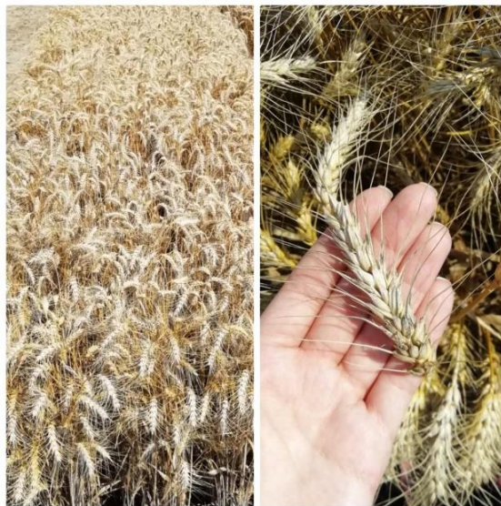
Slika 13. Sorta Maja

Sorta BC Anica (Slika 14.) spada u najbolje sorte u regiji. Visokorodna je, rana, krušna, ozima pšenica. Klas joj je bijele boje. Visina se kreće od 75 do 80 cm. Otporna je na polijeganje. Masa 1000 zrna kreće se od 40 do 45 g, a hektolitarska masa kreće se od 80 do 84 kg/hl. Optimalni rok sjetve je od 10. do 25. listopada, a preporučena norma sjetve za ovu sortu je od 650 do 700 kljavih zrna/m 2 . Ima visok sadržaj proteina (od 12,6 % do 14,2 %) te vlažnog lijepka (26 do 34,2 %) (BC institut Zagreb, 2019.).