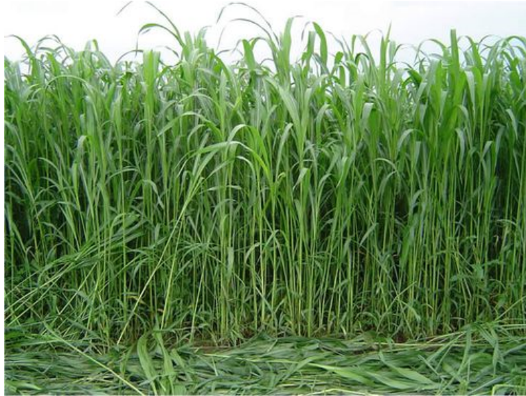
Slika 1: Sudanska trava