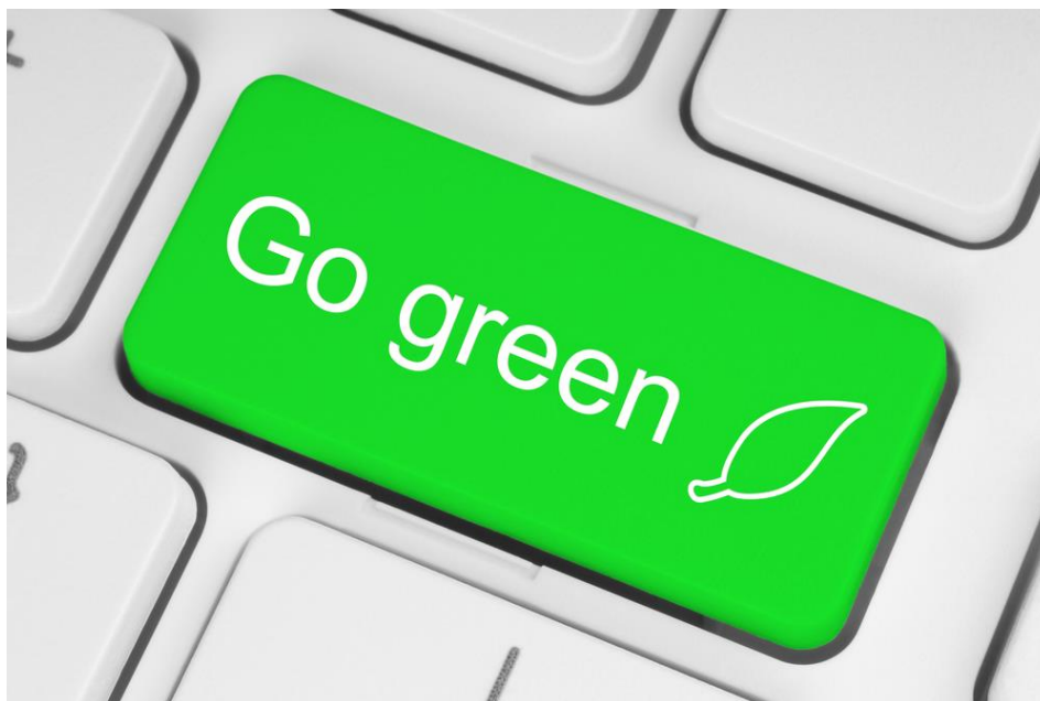
Slika 9. Zeleni marketing

Za zeleni marketing možemo reći da je jedna od vrsta društveno odgovornog marketinga u kojem se proizvodi i usluge te marketinške aktivnosti provode uzimajući u obzir kako će utjecati da okoliš i društvo. Prema Pervišiću (2007.) zeleni ili marketing okoliša se sastoji od svih aktivnosti oblikovanih da generiraju i omogućavaju bilo koju razmjenu u cilju zadovoljenja ljudskih potreba ili želja, na način da zadovoljenje tih potreba i želja ima minimalan štetan utjecaj na prirodni okoliš. Ukoliko poduzeće usvoji koncept zelenog marketinga, svjedočimo o kvalitetnom pristupu poslovanja te da bolje zadovoljava potrebe ciljanih tržišnih skupina.