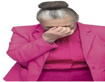
Slika 6. Komparativno oglašavanje

Izvor: https://www.dnevno.hr/magazin/a1-se-narugao-drugim-operaterima-pogledajte-sto-su-im-gradani-porucili-1350882/