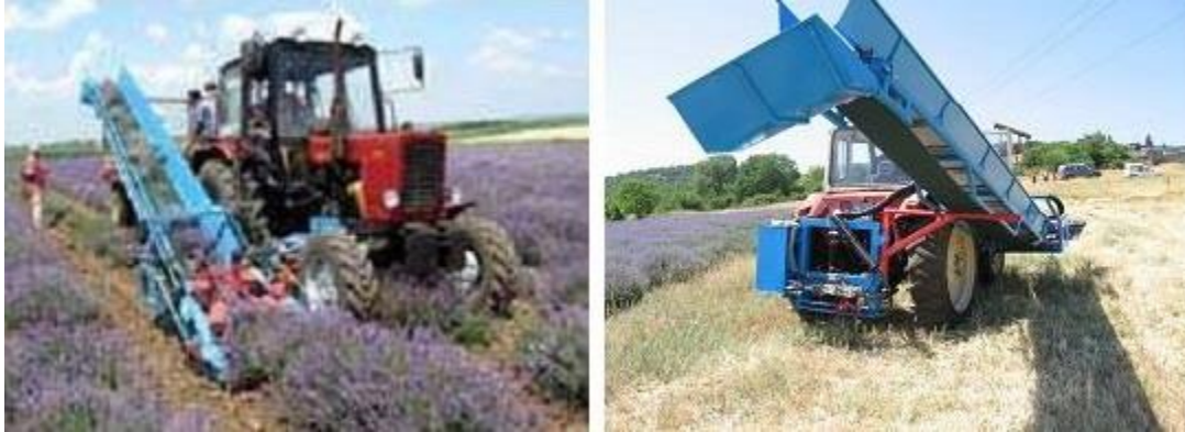
Slika 2. i 3. Žetva lavande