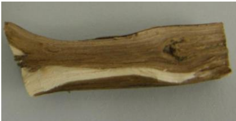
Slika 7. Fusarium sporotrichioides simptomi na korijenu lavande

njihove makrokonidije blago zakrivljene i obično imaju tri do pet septa. Mnogi od njih imaju brojne smeđe klobučaste hlamidospore promjera 7-15 \mu\text{m} i služe kao važna značajka za njihovo razlikovanje. Glavna mjera zaštite je da proizvođači osiguraju zdrav sadni material kod uzgoja, te treba voditi računa o plodoredu.