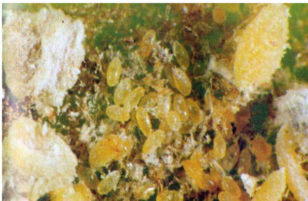
Slika 12. Lozin medić ( Pseudococcus vitis )