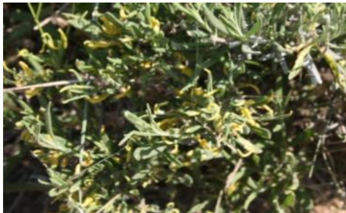
Slika 6. AMV bolest na lavandi

Stoga se preporučava da se ostavi određeno područje lucerne i tretira se insekticidima. AMV se također može prenositi sjemenom, peludom, mehaničkom inokulacijom biljnog soka i parazitskom biljnom vrskom ( Cuscuta ). Kombinacija biljaka zaraženih sjemenom i širenje lisnih uši uglavnom rezultira visoku razinu infekcije. Glavna mjera zaštite je da proizvođači osiguraju zdrav sadni material kod presadnica, kontrola korova, izbjegavanje uzgoja usjeva uz zaražene pašnjake i druge kulturne prakse kako bi se smanjio AMV. Mora se voditi računa da nema prisutnosti lisnih ušiju.