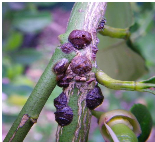
Slika 9. Maslinov medic ( Saissetia oleae )