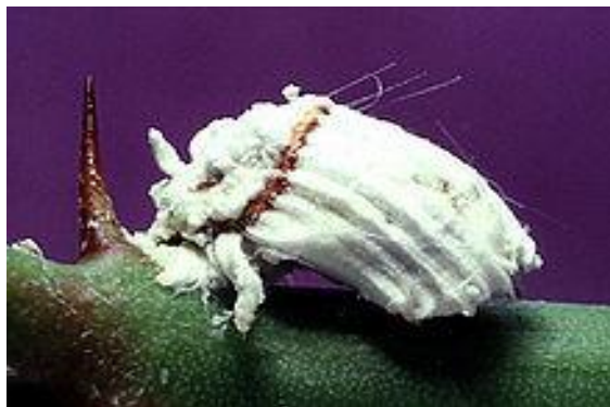
Slika 8. Narančin crvac ( Icerya purchasi )