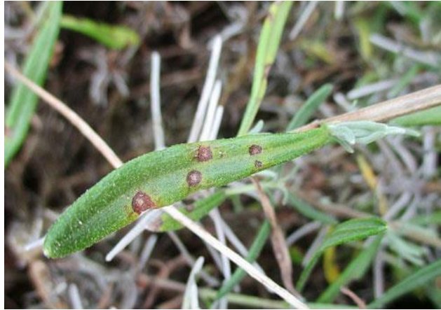
Slika 5. Simptomi pjegavosti lista lavande

pjega, sušenjem i opadanjem listova. Molekularnim ispitivanjima i morfološkim metodama potvrđuje se da tu bolest prouzročava gljiva iz roda Septoria .