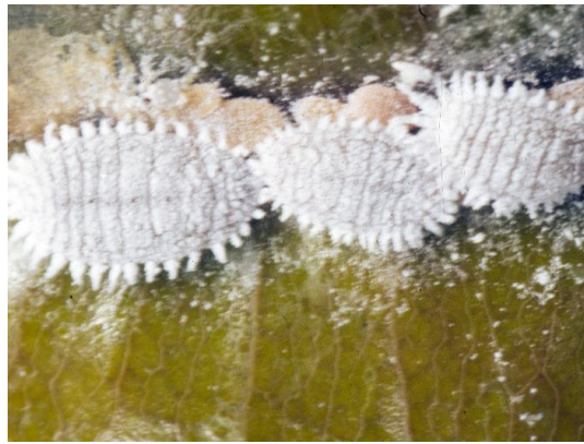
Slika 10. Limunov crvac ( Pseudococcus citri )

neprijatelja kao što su: božje ovčice, muhe tahine i ose najeznice. U svijetu se suzbija biološkim putem pomoću božje ovčice Cryptolaemus montrouzieri i parazitske osice Leptomastix dactylopii . Mehaničkim putem moguće ih je ukloniti ručno skidanjem s biljaka ili pomoću usisavača pažljivo usisati da se ne oštete biljke. Kako ne bi dospjele s vinove loze na pravu lavandu preporučuje se struganje stare kore i zimsko prskanje čokota te primjena insekticida u vrijeme vegetacije. U RH prema FIS bazi od aktivnih stvari koristi se klorpirifos-metil (pripravak Reldan 22 EC). Preporučuje se da se lavanda ne uzgajaju u blizini zaraženih pašnjaka, vinove loze, te voća kao što su smokva, limun, naranda i dr.