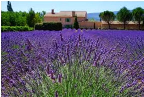
Slika 1. Prava lavanda ( Lavandula officinalis )

za proizvodnju parfema Bonazza (2009.) navodi kako je parfem proizveden od Lavandule officinalis jedan od najstarijih popularnih parfema na području Velike Britanije. Osim parfema lavandini cvjetovi se ističu i u drugim korisnim proizvodnjama kao što su u biljnim jastucima, čaju te mirisnim vrećicama koje služe za odbijanje moljaca. Destilacijom cvijeta lavande moguće je dobiti eteričnog ulja 0,5 % - 1,5 %. Ono se nakuplja u žlijezdama smještenim blizu cvjetne čaške. Glavni sastojci eteričnog ulja su linalol i linalilacetat. Ova vrsta sadrži 35-60 % linalilacetata. Klijavost lavandinog sjemena traje 3-4 godine, a posijano sjeme klija do dva mjeseca. U početku biljka vrlo sporo raste, ali cvjetna stabljika se već može pojaviti u prvoj godini razvoja. U drugoj godini započinje vegetacija porastom temperatura. Prava lavanda započinje u lipnju sa cvjetanjem, ali ukoliko uslijedi hladno vrijeme tada cvjetanje kasni i po par tjedana, a kada je toplo tada cvjetanje kreće i ranije. Eterično ulje najbolje je kakvoće kada je lavanda u punom cvatu.