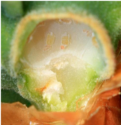
Slika 13. Zelena smrekina uš šiškarica ( Sacchiphantes viridis )

Uzročnici stvaranja šiškarica su lisne uši: Sacchiphantes viridis (zelena smrekvina uš), Sacchiphantes abietis , Adelges laricis (rana smrekova uš) i Adelges tardus (smrekova uš). Štetnici osim smreke napadaju i jelu i ukrasno bilje u koje spada i lavanda. Najčešće dolaze na običnoj smreci, arišu. Zelena smrekina uš dolazi na smrekama do starosti 12 godina. U nedostatku prehrane prelaze na druge biljke, a uvom slučaju pravu lavandu. Na lavandi uši se hrane na lišću i stabljici. Štete prave ličinke u vidu narušavanja samog izgleda biljke, grančice se savijaju i požute. Ličinke se zavlače ispod kore i hrane se sadržajem biljke. Uzrokuju žućenje i sušenje biljaka. Uslijed velikog napada biljke propadaju (Slika 13).