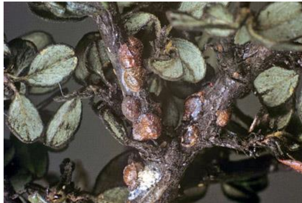
Slika 11. Šljivasta štitasta uš ( Parthenolecanium corni )

višim od 13 °C, a manjim od 8 °C su neaktivne. Krajem zime odlaze na vršne dijelove grana gdje je kora tanka i sočna. U travnju je prva pojava ženki. Razmnožavaju se spolno i partogenezom. Ovipozicija započinje krajem zime, a ispod tijela ostaju jajašca. Oko sredine mjeseca lipnja izlaze mlade ličinke koje naseljavaju lišće i kreću sa ishranom, ali jako su osjetljive i njihova smrtnost je velika. Završetkom kolanja sokova u lišće, počinju prelaziti na grane. Smještaju se oko pupova ili rašlja i tamo prezimljavaju. Nakon prezimljavanja opet izlaze i hrane se. Štete prave na vršnim dijelovima hraneći se na kori i izlučuju mednu rosu. U lipnju ličinke se hrane na lišću hraneći se sokovima, a biljke koje imaju plod također stradavaju. Zbog jako velikog broja zaraženih uši dolazi do propadanja biljaka, a ostatak propadne zimi od smrzavanja zbog oštećenja. Za suzbijanje primjenjuju se prirodni neprijatelji kao što su božje ovčice i osice najeznice, a često se i primjenjuje gljivice Isaria lecanicola . Zimi se obavlja prskanje uljanim sredstvima kao što su bijelo ulje, modro ulje, mineralno svijetlo ulje, crveno ulje itd.