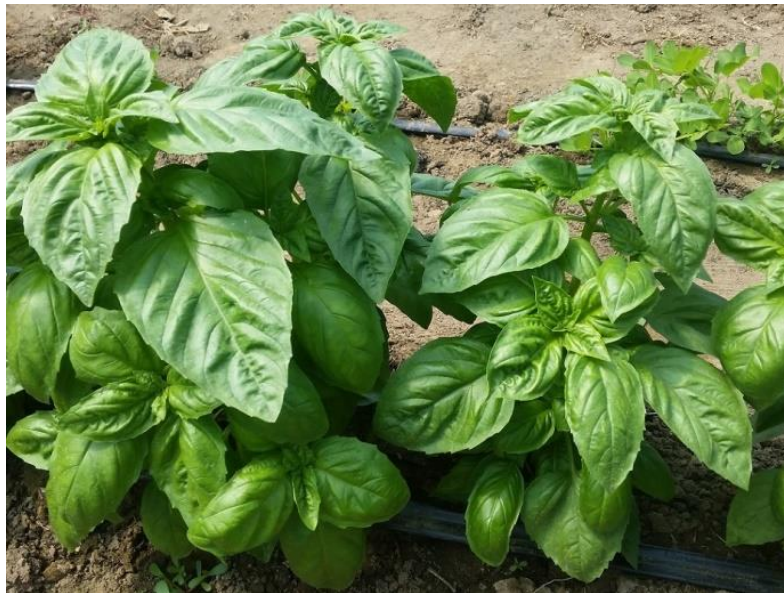
Slika 1. Bosiljak

vitamin C i karotin. Ukoliko je bosiljak uzgojen iz sadnica, vegetacijsko razdoblje mu traje 170 do 180 dana. Cvjetati počinje sredinom lipnja i ponekad cvate dva mjeseca. Ako se pokosi u početku cvjetanja, novi izbojci procvjetaju početkom rujna. Razdoblje sazrijevanja plodova traje dugo, pa plodovi koji sazru prvi dotad se ospu. Pored eteričnog ulja bosiljak sadrži i tanin, flavonid, saponin i druge aktivne tvari (Šilješ i sur., 1992.).