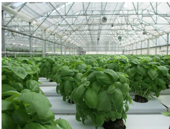
Slika 4. Uzgoj bosiljka na stolovima

Na malim površinama se sadi ručno, sadilicom ili u brazde, s razmakom između biljaka 30 – 40 cm te između redova 50 - 70 cm. Na većoj površini sadnja se obavlja sadilicom. Time se postiže optimalni sklop sadnje od 140 000 do 200 000 biljaka po ha ili 14 – 20 biljaka po m 2 (Putyevski i Galambosi, 1999.). Odmah poslije sadnje obavezna mjera je navodnjavanje.