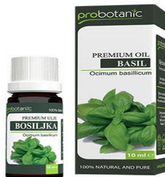
Slika 7. Čaj i biljno ulje od bosiljka