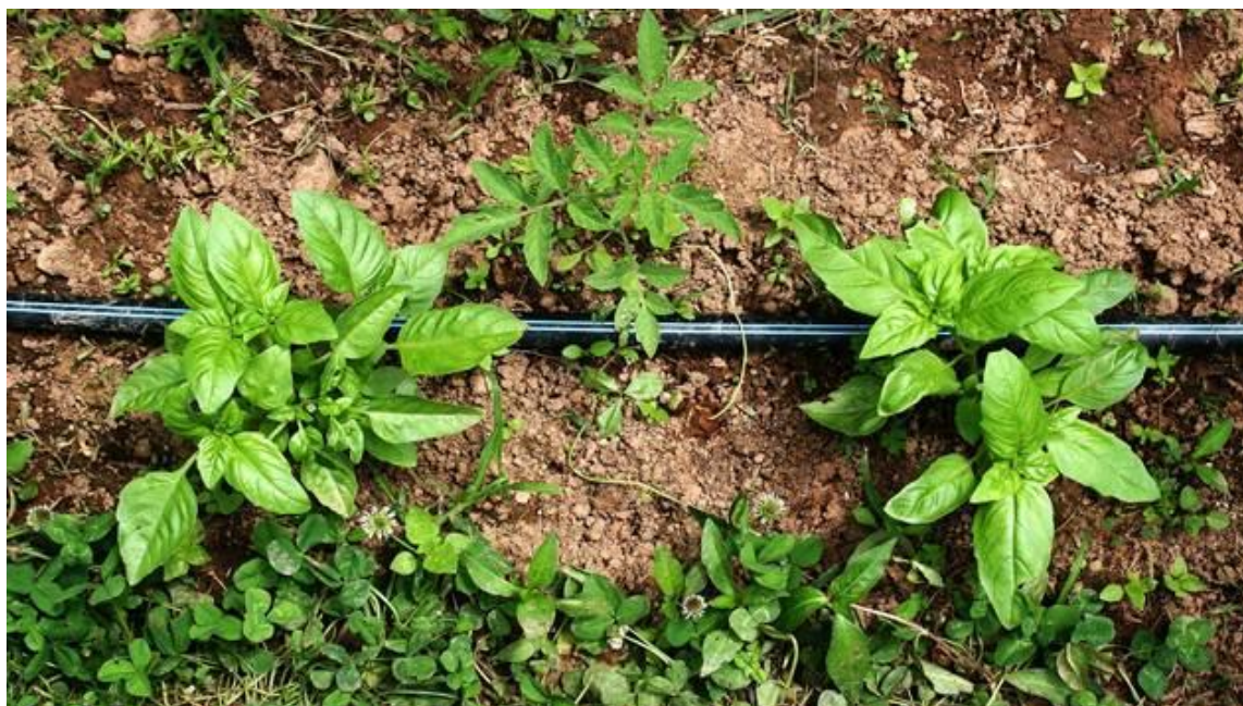
Slika 3. Navodnjavanje bosiljka sustavom kap po kap

U pojedinim istraživanjima je utvrđeno da malč folija utječe na povećanje prinosa eteričnog ulja i herbe kod bosiljka jer se tlo pod njom jače zagrijava što pogoduje razvoju bosiljka, ali i sintezi eteričnog ulja (Putievsky i Galambosi, 1999.).