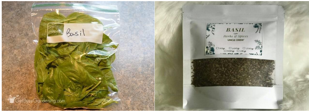
Slika 6. Pakiranje listova bosiljka