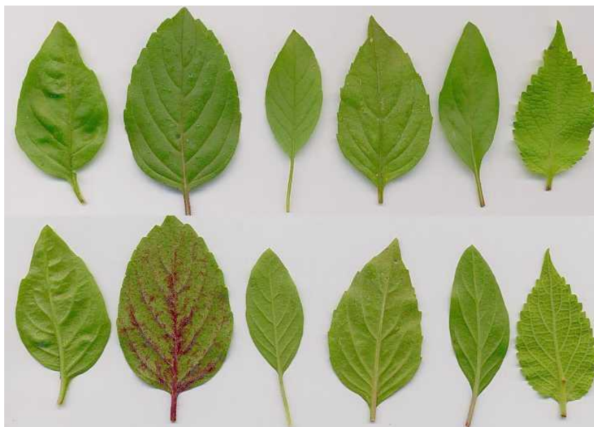
Slika 2. Različite sorte bosiljka

Trima glavnim centrima proizvodnje bosiljka u svijetu se smatraju: tropski dio Afrike, Azija te Južna Amerika. Prema povijesnim izvorima, u nekim područjima Azije bosiljak se uzgaja već 5000 godina (Carević-Stanko, 2013.). Uzgoj bosiljka na većim površinama, primjerice na području Europe se odvija u Poljskoj, Mađarskoj, Francuskoj i Italiji, a najveći svjetski proizvođač su Sjedinjene Američke Države. Unutar roda Ocimum postoji 30 do 160 vrsta, a od komercijalne važnosti valja istaknuti sorte: O. africanum , O. americanum , O. campehianum , O. gratissimum , O. kilimandscharum i O. tenuiflorumb (Carević – Stanko, 2013.). Proizvodnja bosiljka je moguća i na području Južne Afrike gdje se mogu ostvariti dvije vegetacije godišnje, a očekivani prinos eteričnog ulja je 10-20 kg ulja po 1 ha.