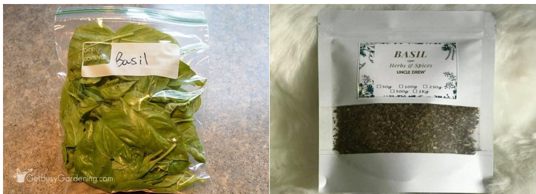
Slika 6. Pakiranje listova bosiljka