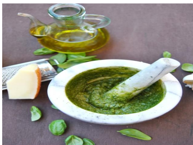
Slika 8. Pesto od bosiljka

Zbog svog slatkastog i ugodnog mirisa jedan je od omiljenijih začina u mnogim profinjenim kuhinjama svijeta, pogotovo u talijanskoj i francusko-maritimnoj kuhinji. Od njega se dobiva i poznati talijanski regionalni specijalitet pesto (slika7.).