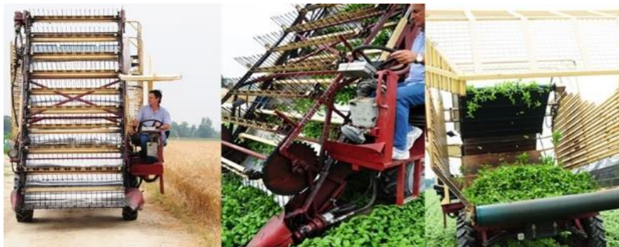
Slika 5. Postupak košnje i prikupljanja herbe bosiljka

Košnja bosiljka se obično provodi dva puta tijekom same vegetacije, vremenski obično prva košnja se obavi početkom cvjetanja, donosno početkom srpnja ili možda malo ranije u zavisnosti od vremenskih uvjeta, dok se druga košnja obavlja krajem rujna, a svakako prije nadolazećih jesenskih mrazeva.