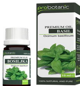
Slika 7. Čaj i biljno ulje od bosiljka