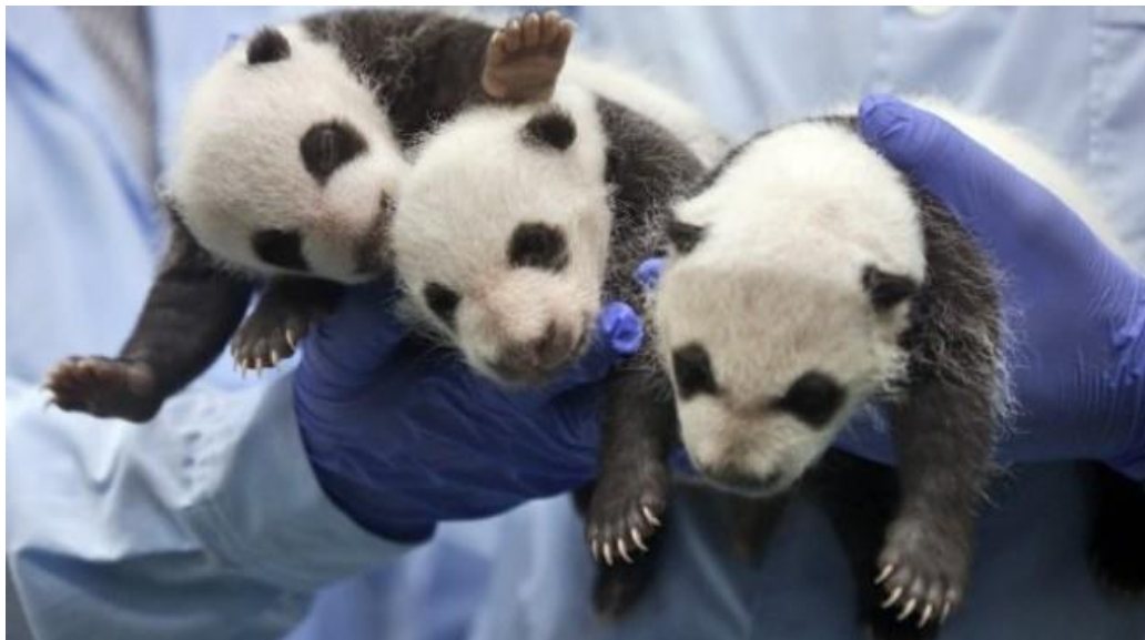
Slika 9. Tri male pande, jedine trojke na svijetu rođene u kineskom zoološkom vrtu u Guangžou

se pod strogom kontrolom da ne bi došlo do situacije da se razmnožavaju životinje koje se nalaze u bliskom srodstvu (Đekson, 2007).