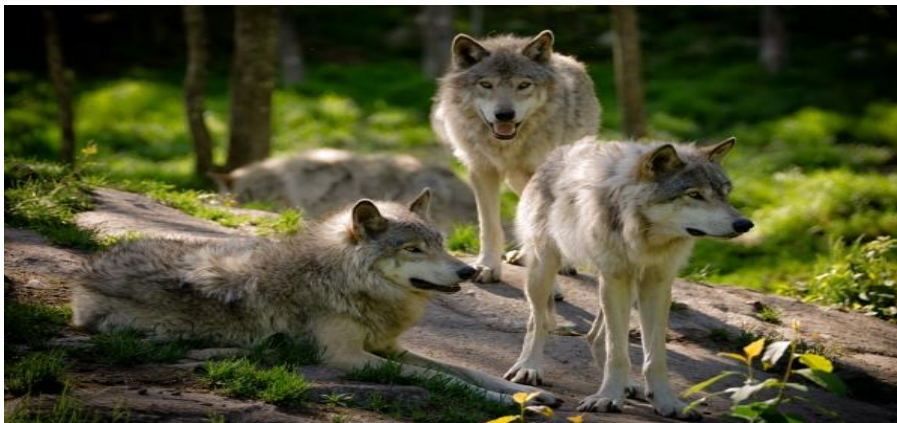
Slika 6. Vuk

Procjenjuje se da u Hrvatskoj danas živi između 130 i 170 vukova. Smatra se da su vukovi još 1894. živjeli na cijelom području Hrvatske, a da su zatim zbog masovnog, nagradama poticanog izlova počeli nestajati. Vukovi su se danas uspjeli održati na području Gorskog kotara. Like i Dalmacije, odnosno na 32,4% ukupne površine kopnenog dijela Hrvatske. Prema dostupnim podacima, u Hrvatskoj je u razdoblju od 1986. do kraja 2003. zabilježeno smrtno stradavanje 108 vukova. Za 87% odgovoran je čovjek. Ovaj podatak ipak ne pokazuje stvarnu sliku, jer se nezakonito ubijanje ne prijavljuje (Štrbenac i sur., 2004). Prema procjenama brojnosti u Hrvatskoj populacija vuka kreće se od najmanje 142 jedinke do najviše 212 jedinki. U prosjeku to iznosi 177 jedinki raspoređenih u 49 čopora. Od toga su 23 čopora granična (47%) – Slovenija i Bosna i Hercegovina. Unutar granica RH nalazi se 26 čopora koji žive na teritoriju 9 županija, a neki čopori imaju životni prostor na području dvije ili čak i tri županije (Jeremić i sur. 2013).