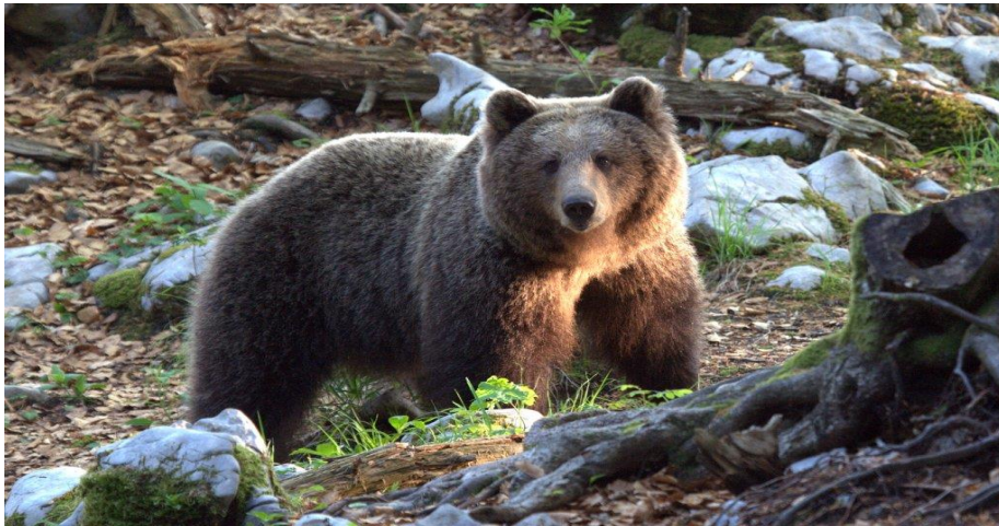
Slika 8. Smeđi medvjed

Ukupna površina rasprostranjenosti medvjeda u Hrvatskoj iznosi 12.372,17 km 2 . U Hrvatskoj živi oko 1.000 jedinki smeđeg medvjeda koje su dio populacije Dinarskog masiva. Iako je medvjed zaštićen u državnoj i međunarodnoj razini, čovjek i dalje predstavlja najveću opasnost njegovu opstanku. Veliku opasnost predstavlja gusta mreža prometnica koja onemogućuje prirodne migracije medvjeda i na kojima oni često stradavaju. Osim stradavanja na prometnicama, one ponekad mogu izazvati i genetičku izolaciju pojedinih manjih populacija. Nestanak medvjeda u velikom dijelu Europe posljedica je lova i krivolova kojima je ova vrsta uništavana jer je smatrana nepoželjnom. Međutim danas u mogućnosti povratka dodatno ograničene gubitkom staništa ili neprihvatanjem od lokalnog stanovništva (Oković i sur. 2010).