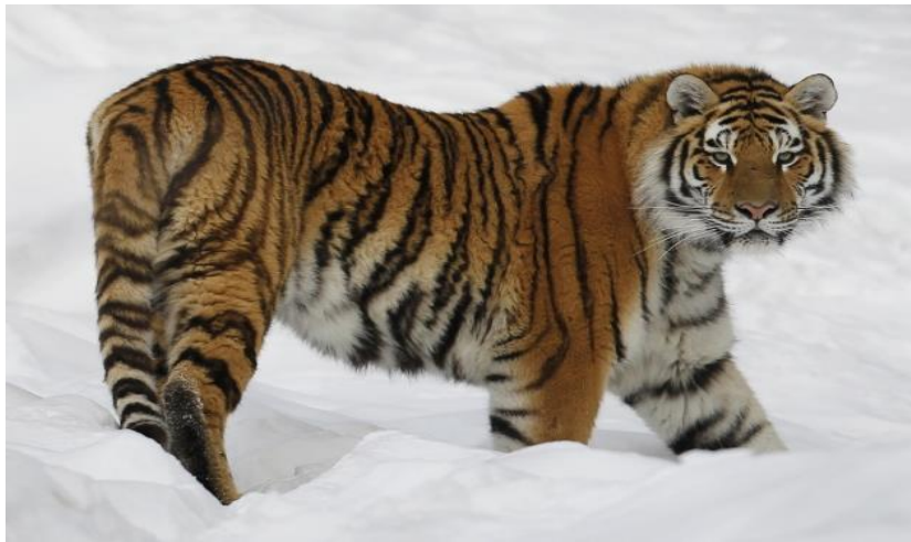
Slika 2. Sibirski tigar