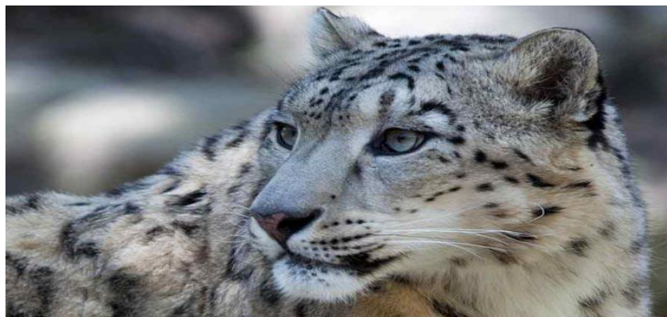
Slika 3. Snježni leopard

U svim zemljama u kojima živi zaštićena je vrsta, no krivolov ga i dalje ugrožava. Jedan od razloga jest prelijepo bijelo krzno, ali i visoka cijena koja se postiže zbog potreba tradicionalne kineske medicine. Procjenjuje se da između 4 500 i 7 500 jedinki živi u divljini na površini od oko 2 milijuna kvadratnih kilometara (Kovač, 2015).