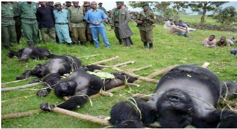
Slika 5. Krivolovci ubili planinske gorile

Krivolov, uništavanje staništa, bolesti i proizvodnja drvenog ugljena uništavaju njihovo stanište, a oko 880 jedinki bori se za opstanak (Kovač, 2015).