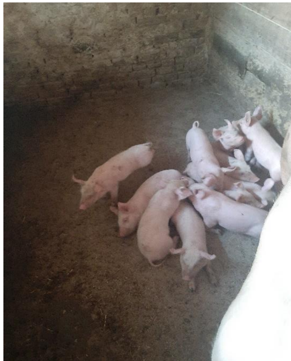
Slika 8. Prasadi u uzgoju

Uzgoj prasadi traje od odbića i dobi od 35 dana pa do dobi od 80-90 dana, kada prasadi dostigne tjelesnu težinu od približno 30 kg (slika 6). Držanje prasadi je skupno, a hranidba tijekom uzgoja podešena je tako da prasadi ima prosječni dnevni prirast od približno 400 grama. Ovo razdoblje uzgoja je ključno za daljnju proizvodnju tovljenika i rasplodne nazimadi, zbog čega je potrebno da prasadi dobija kvalitetnu hranu u obliku koncentriranih krmiva, te dovoljne količine svježe lucerne. (Kralik i sur. 2009.)