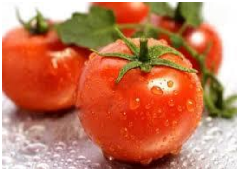
Slika 2. Rajčice

Najveća masa korijenovog sistema razvija se do dubine od 40-50 cm što ovisi o kvaliteti tla. Biljka isto tako stvara i adventivno korijenje. Stablo je zeljasto, razgranato, a visina se kreće od 0,5-3 m što ovisi o uzgoju. Svi zeleni dijelovi biljke obrasli su dlačicama, a cvjetovi su skupljeni u grozd. Boja cvjeta je žuta. Oprašuje se uglavnom autogamno (samooprašivanje), ali u suvremenoj proizvodnji u zaštićenom prostoru oprašivanje potiče čovjek (Agro klub, 2015.).