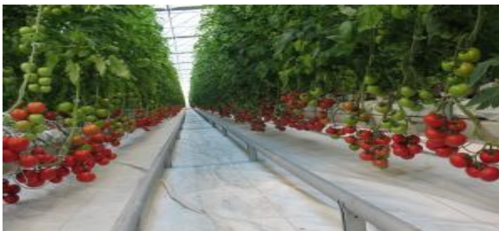
Slika 4. Rajčica u plasteniku

Što se tiče navodnjavanja, od formiranja plodova, pa sve do berbe i tijekom berbe, rajčici je dovoljno 25-30 l/m 2 ili 3 l/min po jednoj dužini, ako se vrši navodnjavanje kišenjem. Normalno da su u zimskom uzgoju potrebe biljke za vlagom u tlu manje, ali u ljetnom uzgoju na otvorenom potrebno je tjedno dodati 40-50 l vode/m 2 . Idealni je sustav navodnjavanja kap po kap ili primjena perforiranih plastičnih cijevi koje već prema određenom pritisku crpke doziraju vodu pokraj biljke. Idealno zalijevanje je ono u ranim jutarnjim satima jer su biljke i tlo u to vrijeme najhladniji, što je posebno važno u ljetnim mjesecima. Ovo je jednako važno i za proizvodnju rajčice u zaštićenom prostoru(Agro klub, 2015.).