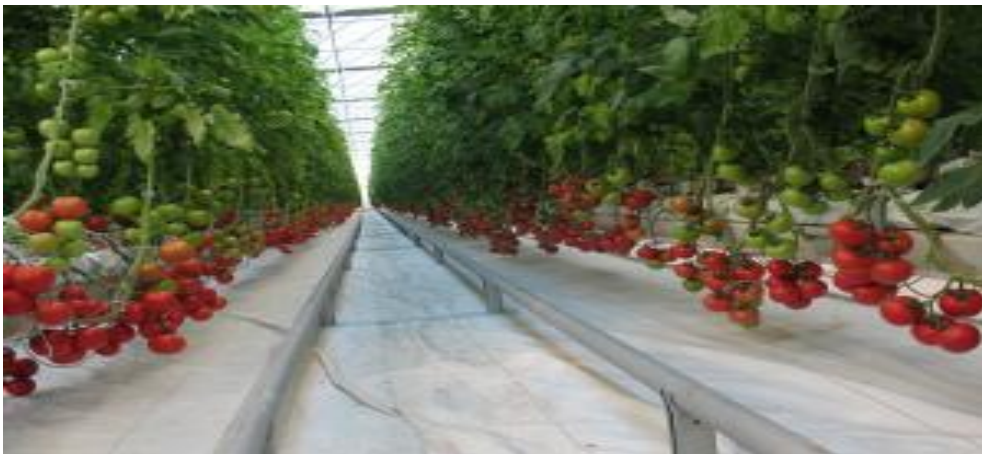
Slika 4. Rajčica u plasteniku

Što se tiče navodnjavanja, od formiranja plodova, pa sve do berbe i tijekom berbe, rajčici je dovoljno 25-30 l/m 2 ili 3 l/min po jednoj dužini, ako se vrši navodnjavanje kišenjem. Normalno da su u zimskom uzgoju potrebe biljke za vlagom u tlu manje, ali u ljetnom uzgoju na otvorenom potrebno je tjedno dodati 40-50 l vode/m 2 . Idealni je sustav navodnjavanja kap po kap ili primjena perforiranih plastičnih cijevi koje već prema određenom pritisku crpke doziraju vodu pokraj biljke. Idealno zalijevanje je ono u ranim jutarnjim satima jer su biljke i tlo u to vrijeme najhladniji, što je posebno važno u ljetnim mjesecima. Ovo je jednako važno i za proizvodnju rajčice u zaštićenom prostoru(Agro klub, 2015.).