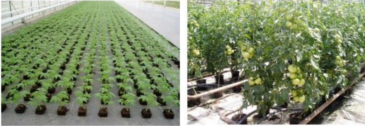
Slika 3. Presadnice rajčice (lijevo) i uzgoj rajčice u kokos supstratu (desno)

odluči na uzgoj u hidroponu. Hidroponska proizvodnja odvija se u grijanom ili povremeno grijanom zaštićenom prostoru (staklenici ili plastenici), što znači da je proizvodnja moguća tijekom cijele godine u vertikalnom uzgoju s 20-34 etaža plodova(Ćorić, 2007.).