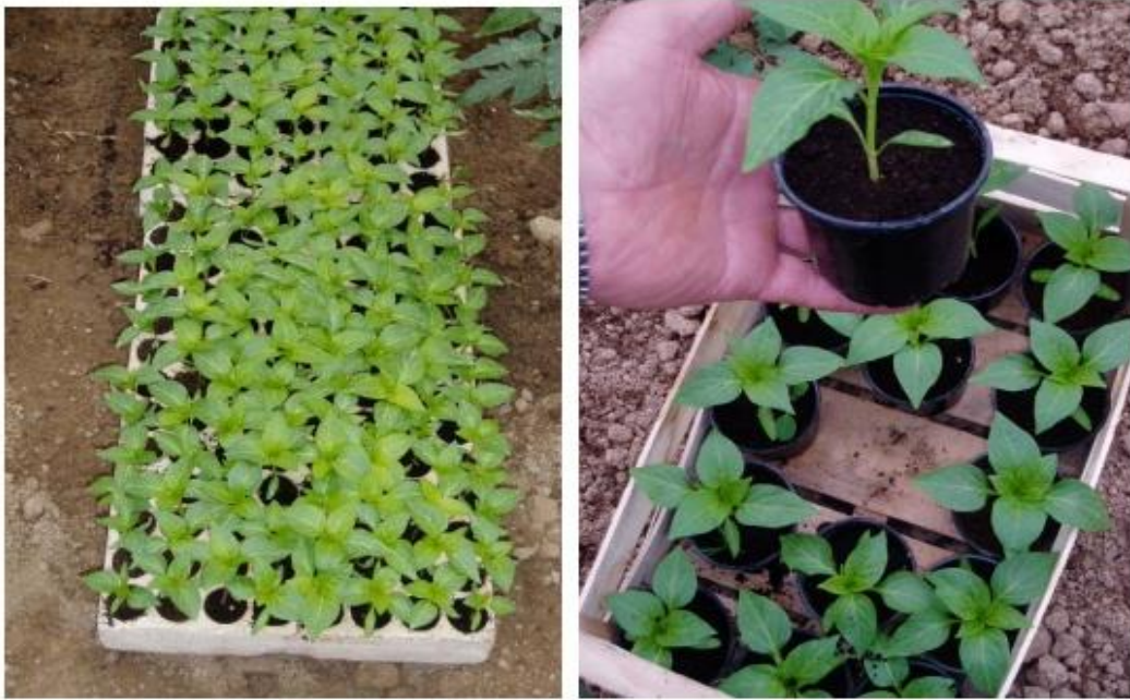
Slika 5. Presadnice paprike

Osim uzgoja paprike u zaštićenom prostoru na tlu, paprika se uspješno može uzgajati i na inertnim supstratima uz ishranu hranjivim otopinama. Kao i kod rajčice, od supstrata u hidroponskom načinu uzgoja paprike najviše se koriste blokovi kamene vune, kokosova vlakna i piljevina od mekog drveta. Presadnice za hidroponski način uzgoja paprike proizvode se u grijanim zaštićenim prostorima sjetvom u čepove kamene vune s kojima se u fazi pune razvijenosti kotiledonskih listova presađuju u veće blokove na stalna mjesta uzgoja.