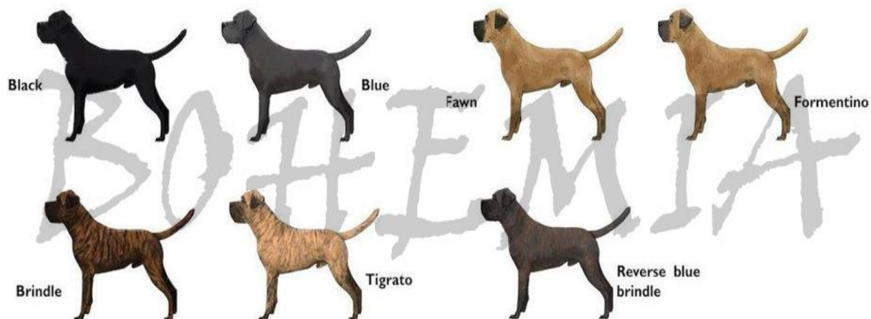
Slika 4: Boje dlake pasa pasmine Cane Corso