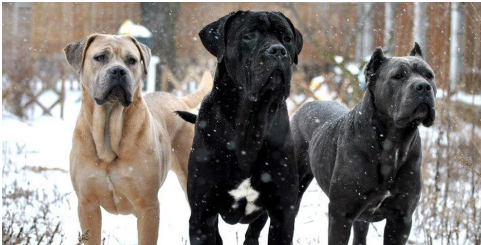
Slika 9. Različite boje dlake pasa pasmine Cane Corso

Crna, olovno siva, škrljac siva, svijetlo siva, svijetlo smeđa, jelensko smeđa, tamno smeđa i sivo-smeđe-tigrasto (jasno razdvojene linije različitih nijansi smeđe i sive). Kod smeđih i sivo-smeđe-tigrastih postoji crna ili siva maska samo na njušci i ne bi trebala prelaziti liniju očiju. Manje bijele oznake na grudima, vrhovima šapa i nosniku su dozvoljene. ( http://www.mojker.com/cane-corso1.html )