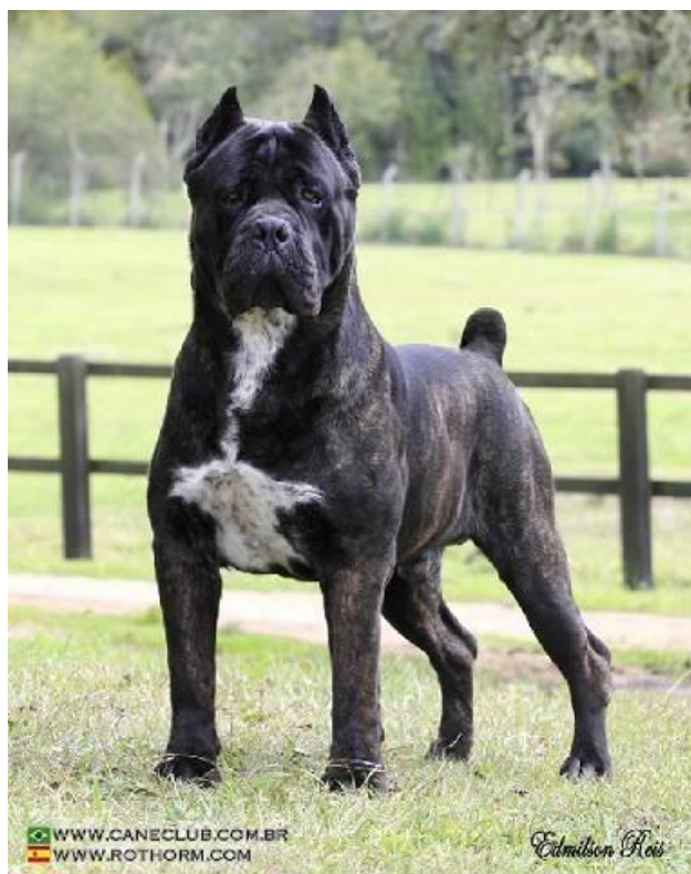
Slika 7: Cane Corso sa kupiranim ušima