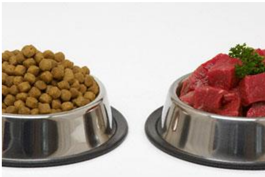
Slika 11: Dehidrirana i sirova hrana za pse