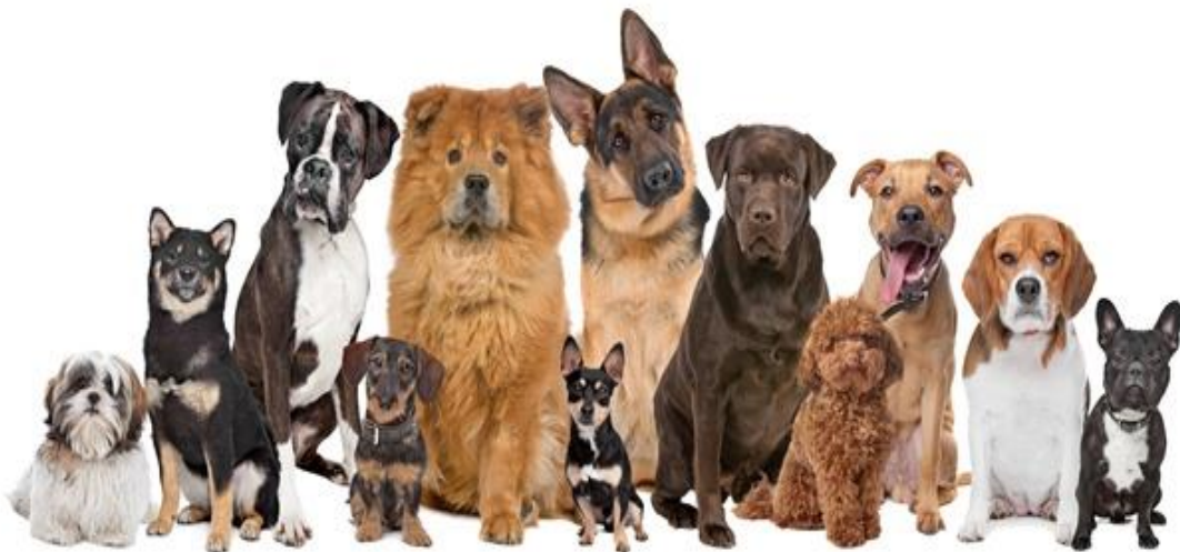
Slika 1: Različite pasmine pasa

Današnji buldog, na primjer, ne bi mogao obaviti zadatke za koje su uzgojeni prvi primjerci te pasmine (jer su imali ravnije noge i veću njušku). Zanimljivo je nagađati što bi se moglo dogoditi sa psima u budućnosti. ( http://zivotinje.pondi.hr/psi.html )