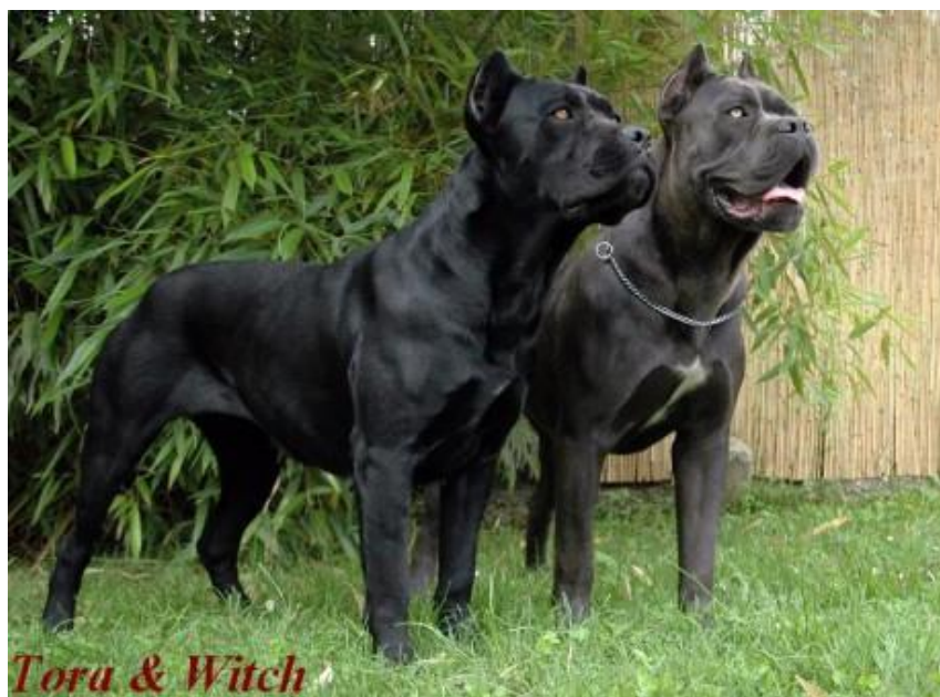
Slika 3. Mužjak i ženka pasmine Cane Corso