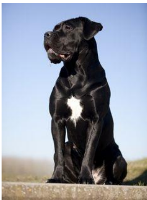
Slika 5: Odrasli mužjak pasmine Cane Corso