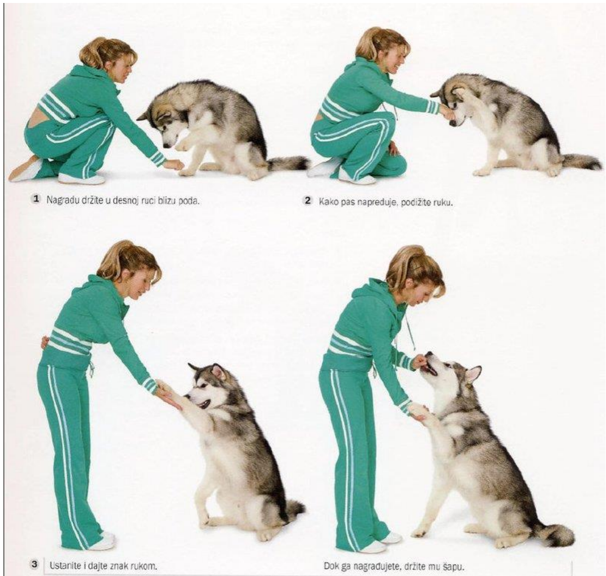
Slika 2: Postupak učenja psa da pruži šapu

Složenija dresura pasa predstavlja učenje posebnih vještina poput pripreme za izložbe ili utakmice pasa, školovanje za psa čuvara, za traganje, spašavanje, školovanje za psa vodiča i slično ( http://www.mojipsi.com/dresura-pasa/ ).