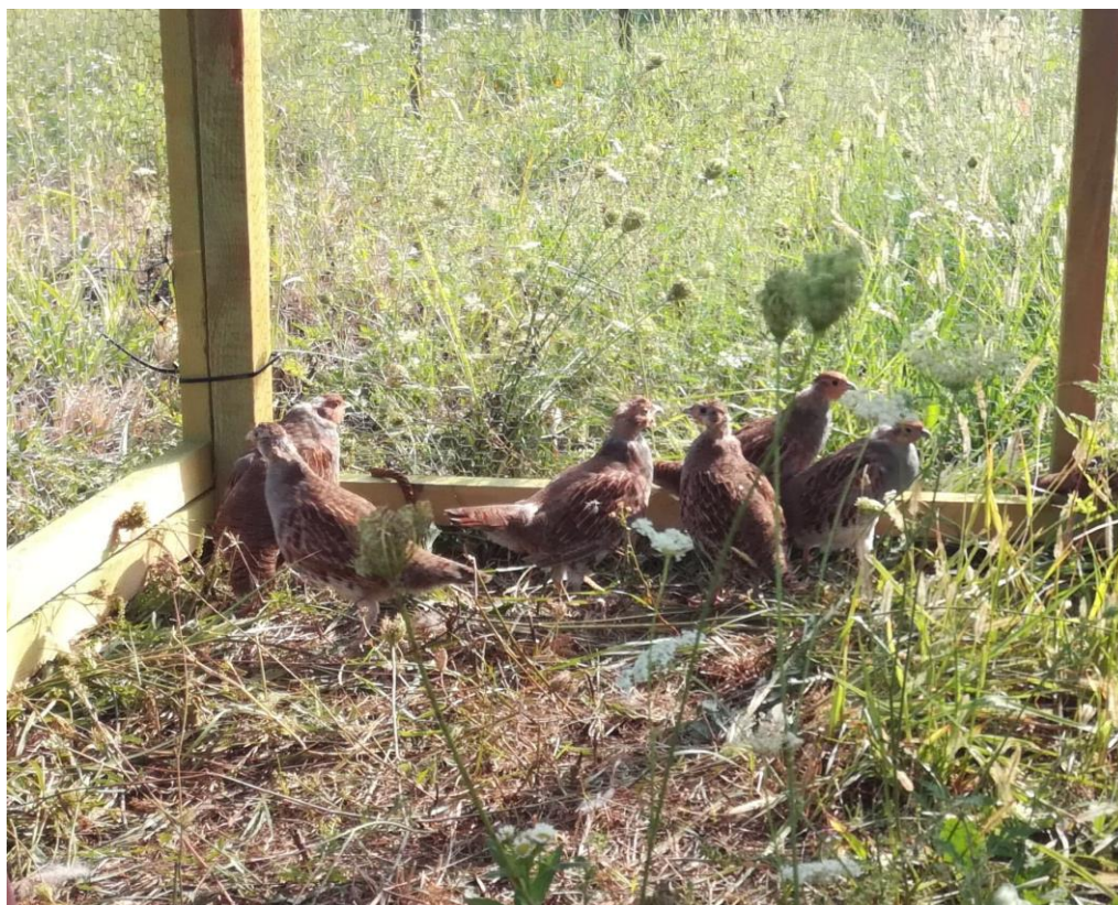
Slika12. Priprema za ispuštanje prvih parova trčki.