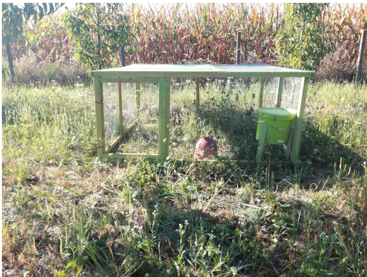
Slika 10. Volijera na drugoj lokaciji.

Za lokaciju postavljanja druge volijere izabran je privatni voćnjak smješten na području sela Hrastovac. Prednost kod postavljene volijere biti će u tome što je voćnjak ograđen metalnom žicom te će ptice na taj način biti dodatno zaštićene od predatora koji bi potencijalno mogli uznemiravati i ugrožavati život pticama. Kao i prethodna volijera i ova je okružena manjim oraničnim parcelama na kojima su zasijane žitarice te će hranidba biti olakšana.