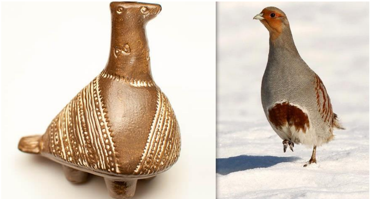
Slika 1. Vučedolska golubica i trčka skvržulja

Trčka skvržulja ( Perdix perdix L. ) u našim krajevima oduvijek je bila prepoznatljiva kao simbol u agrokulturnom eko sustavu kao jedna od vrsta koja je regulirala brojnost nametnika i štetnika na usjevima. Osim svog ekološkog značaja trčka skvržulja također ima veliki kulturni značaj, posebice na području Vukovarsko-srijemske županije. U današnje vrijeme malo ljudi zna da je vučedolska golubica zapravo poljska jarebica, odnosno trčka skvržulja. Za vrijeme eneolitika (bakrenog doba) i razvoja metalurške proizvodnje u Vučedolu za potrebe rata trčka skvržulja, odnosno poljska jarebica, bila je simbol kovača koji su u to vrijeme nažalost oboljevali od hromosti. Udisajući otrovne plinove u tvornicama simptomi hromosti manifestirali su se tako što su radnici šepali na jednu nogu. Tadašnji radnici kao svoj simbol uzeli su trčku skvržulju zbog sličnosti u tome što mužjak odvrćući predatora od svoje ženke i potomstva također „šepa“ na jednu nogu te se pretvara da je ranjen. Nakon što odvrti pozornost predatora i uspije ga odvući podalje od gnijezda mužjak se i sam daje u bijeg.