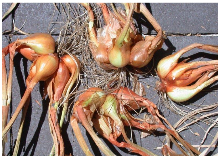
Slika 5. Izvađena ljutika