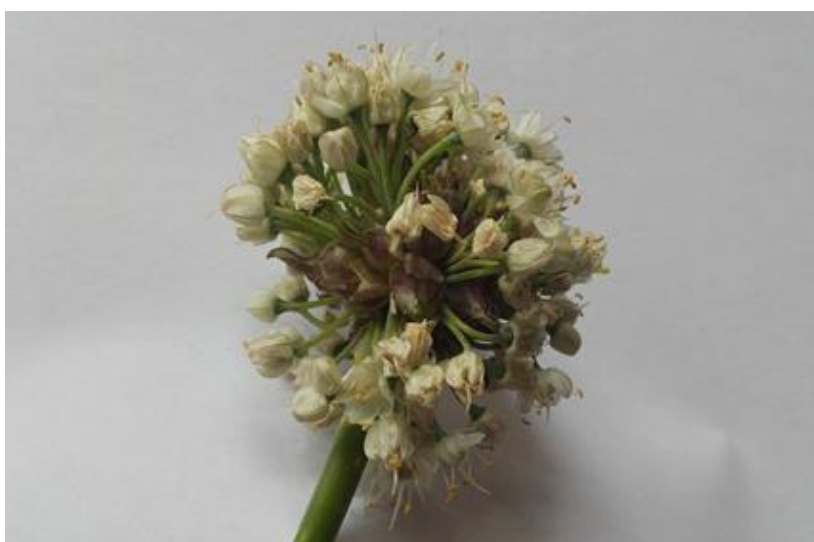
Slika 3. Cvat sitne lukovice

Iako morfološki ljutika izgleda vrlo slično A. cepa , postoje neke razlike. Biljke su višegodišnje i za razliku od A. cepa . generalno imaju manje cvjetove (Slika 3.), cvat, lukovice. U usporedbi sa listovima A. cepa , listovi ljutike su tanki (Slika 4.), nježni, mogu se presaviti i pomalo su plosnati, blago konkavni na unutarnjem dijelu lista.