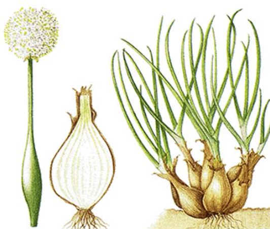
Slika 2. Lukovice ljutike

Lukovice se koriste tijekom jeseni i zime, a sitnije se lukovice mariniraju. U svijetu se uzgaja na oko 100.000 ha, najviše u Japanu, Meksiku, i jugoistočnoj Aziji, a u Europi u Italiji i Španjolskoj. Dobro podnosi različite uvjete uzgoja te zahtjeva malo vode. Pogodna je za komercijalni uzgoj i za uzgoj u vrtovima. (Sablić, 2016.). U novije vrijeme svi lukovi su svrstani u porodicu Alliaceae. Lukovi su prije bili klasificirani u porodice Liliaceae i Amaryllidaceae. U podancima i korijenu i lukovici sakupljaju reserve asimilata za sljedeću vegetaciju. (Lešić i sur., 2006.). Ljutika je prije smatrana zasebnom vrstom, A. ascalonicum , no danas je klasificirana unutar grupe običnog luka pod trenutno prihvaćenog imena A. cepa Agregatum grupa. Pored najpoznatijeg imena A. ascalonicum postoje i ostali sinonimi koji su u upotrebi: A. cepa var. Agregatum , A. cepa var. Ascalonicum , A. cepa cv. 'Shallot'. (Puizina, 2013.).