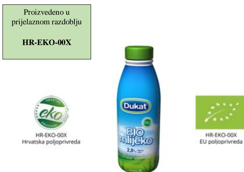
Slika 1. Znak ekološkog proizvoda (zeleni listić sa zvjezdicama oznaka je EU za eko proizvode)