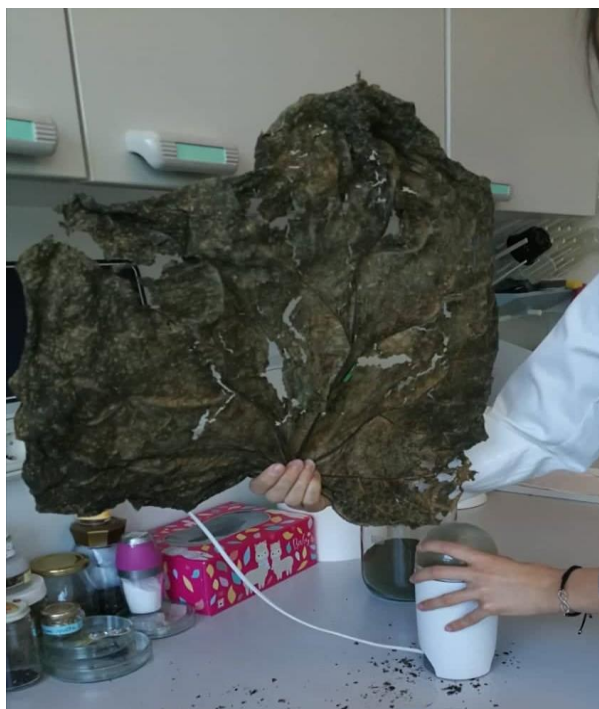
Slika 8. Osušeni list carske paulovnije