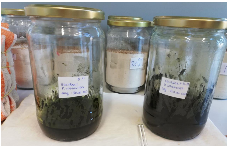
Slika 13. Prašivo paulovnije miješano s vodom i alkoholom (2-propanol)

platno (slika 14.) i prosijani kroz sito otvora 150 \mu\text{m} (slika 15.). Zatim su vodeni biljni ekstrakt i alkoholni biljni ekstrakt pomiješani u omjeru 1:1 (slika 16.). U tretmanu je posebno primjenjen ekstrakt s vodom, ekstrakt s alkoholom te kombinacija navedenog pri omjeru 1:1. Ekstrakti su primjenjeni Kartell mikropipetom (slika 17.) u koncentraciji od 200 \mu\text{l} na 100 g pšenice (slika 18.), a uz to je postavljen i kontrolni tretman. Očitavanje mortaliteta vršilo se nakon 7. i 14. dana ekspozicije.