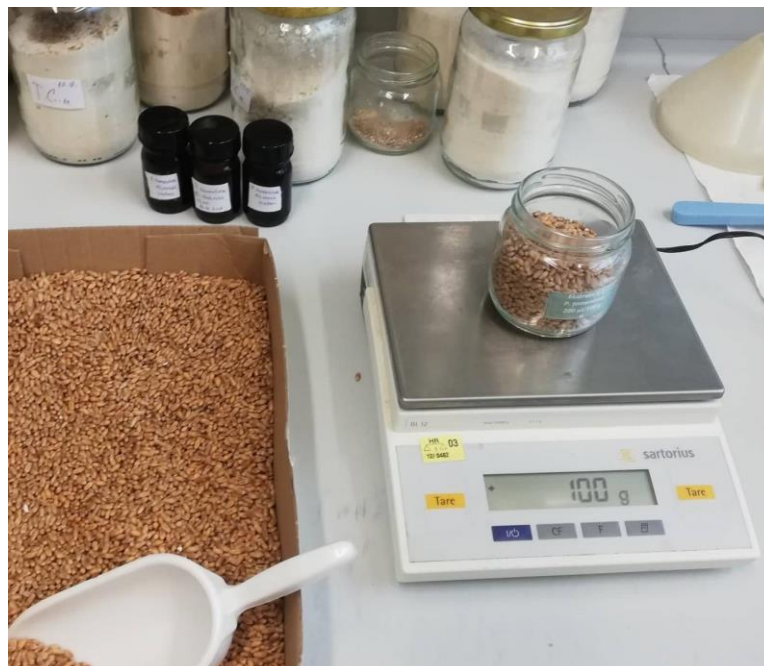
Slika 18. Odvaga 100 g pšenice za primjenu ekstrakta