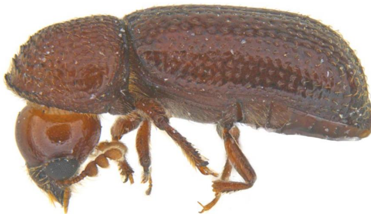
Slika 1. Žitni kukuljičar ( R. dominica )

Žitni kukuljičar ( R. dominica ) je jedan od glavnih primarnih štetnika u skladištu. Tijelo mu je dugo 2,3-3 mm, tamnosmeđe boje, valjkastog oblika. Vratni štit u potpunosti prekriva glavu (slika 1.). Ženka odloži 100-500 jajašaca na razne proizvode. Ličinka ima razvijena tri para nogu, bijele je boje i pokrivena je kratkim dlačicama. Za razvoj potrebna je temperatura viša od 30 °C. Termofilna je vrsta. Ličinke oštećuju različite proizvode, a mogu se ubušiti u zdravo zrno žitarica u kojem izgrizaju endosperm i hrane se njime. Prisutnost štetnika prepoznaje se po slatkastom mirisu zaražene pšenice. Zaraza se širi i letom jer ima dobro razvijena krila, a godišnje se pojave dvije generacije. Mjere suzbijanja su sljedeće: higijenske mjere (čišćenje skladišnog objekta i robe od primjesa), fizikalne i mehaničke mjere (primjena visoke i niske temperature, hermetičko čuvanje, inertna prašiva), biološke mjere (primjena predatora i parazita) i kemijske mjere (primjena insekticida i fumigacija) (Korunić, 1990.).