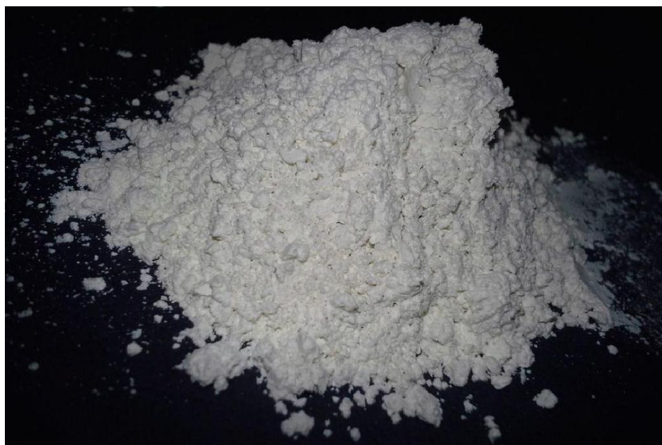
Slika 3. Dijatomejska zemlja

Dijatomejska zemlja (slika 3.) je geološki depozit nastao od silikatne sedimentne stijene koja je nastala taloženjem ostataka dijatomeja. Dijatomeje su jednostanične alge poznate još i kao alge kremenjašice, a različitog su oblika i boja. Sadrže pigmente klorofila a i c, karotenoid i ksantofil (fukoksantin). Na zemlji ima preko 100 000 vrsta razvrstanih u 250 rodova. Sitne čestice, odnosno dijatomi ili dijelovi dijatoma, se zalijepe na tijelo kukca te sorpcijom, abrazijom i fizikalnim snagama oštećuju voštani sloj na tijelu koji štiti kukca od gubitka vlage iz tijela (Korunić, 2007). Uloga dijatomejske zemlje je da se koristi kao insekticid u skladištima, filtriranje vode i ulja, odstranjivanje crijevnih parazita, za suzbijanje parazita i buha kod kućnih ljubimaca. Dijatomejska zemlja je stabilna, inertna supstanca koja ne stupa u kemijske reakcije niti s jednom supstancom u prirodi pa tako ne stvara opasne ili otrovne rezidue (Korunić, 2007.). Dijatomejska zemlja oštećuje probavni trakt kukaca (Smith, 1969.) i blokira respiracijski otvor (Webb, 1945.). Ebeling (1971.) navodi da kukci ugibaju nakon što izgube oko 60 % vode ili 30 % tjelesne mase.