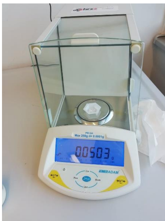
Slika 12. Odvaga inertnog prašiva

Inertno prašivo primijenjeno je u staklene posude volumena 200 ml ispunjene sa 100 g sterilne pšenice. Staklene su posude hermetički zatvorene i sadržaj je ručno protresen u trajanju od 60 s. Nakon toga inducirano je 20 odraslih jedinki po tretmanu. Zatim su staklene posude prekrivene perforiranim poklopcima i odložene u kontrolirane uvjete ( 29 \pm 1 °C; 70-80 % rvz). Inertna prašiva SilicoSec ® i Celatom Mn-51 ® su primijenjena u trima koncentracijama: 250, 500 i 700 mg kg -1 (slika 12.), a uz to je postavljen i kontrolni tretman. Očitavanje mortaliteta vršilo se nakon 7. i 14. dana ekspozicije.