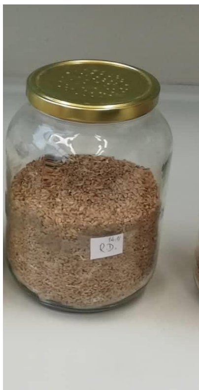
Slika 7. Žitni kukuljičar u pšenici