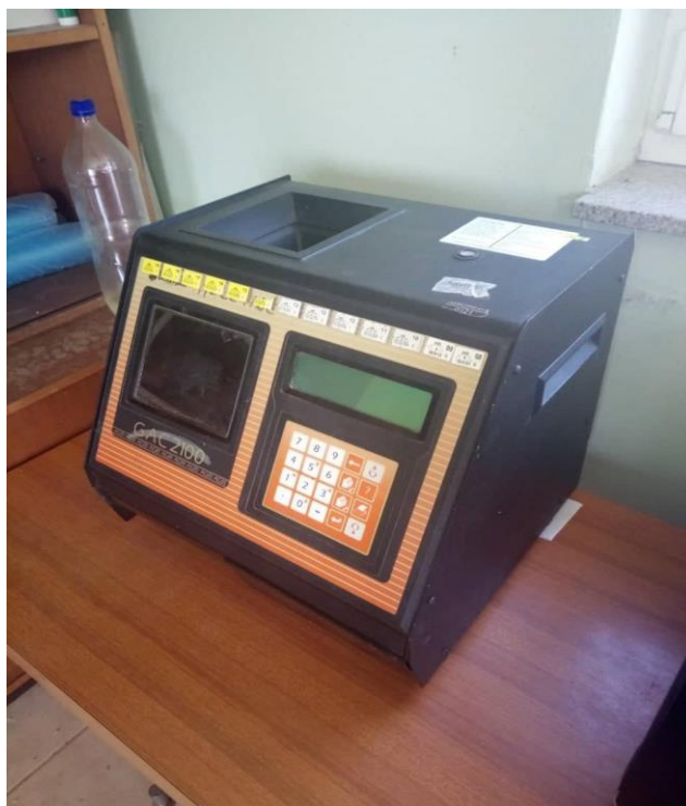
Slika 6. Dickey-John GAC 2100