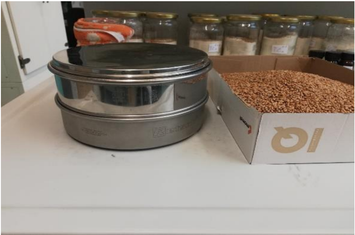
Slika 4. Sito promjera 2,0 mm

Uzgoj testnih kukaca obavljen je u kontroliranim uvjetima pri temperaturi od 29 \pm 1 °C, relativnoj vlazi zraka 70-80 % u tami. Za potrebe istraživanja koristili su se F1 generacije odraslih testnih kukaca vrste R. dominica . Kao uzgojni medij korištena je pšenica s 14 % vlage. Pšenica je prethodno prosijana kroz sito promjera 2,0 mm (slika 4.) i sterilizirana u sušioniku (slika 5.) pri 60 °C u trajanju od 1 sat. Sadržaj vlage izmjeren je uređajem Dickey-John GAC 2100 (slika 6.). U istraživanju su korištene odrasle jedinke starosti 7-21 dan.