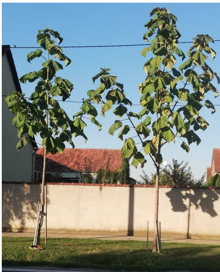
Slika 2. Carska paulovnja ( P. tomentosa )

Carska paulovnja ( Paulownia tomentosa (Thunb.) Steud.), (slika 2.) je listopadno stablo iz porodice Paulowniaceae . Naraste do 15 m u visinu, ima uspravno deblo promjera do 60 cm te zaobljenu krošnju. Kora je u početku glatka, tanka i sivosmeđa, kasnije postane plitko ispucana. Listovi su nasuprotni, veliki do 30 cm, srcoliki, ušiljenog vrha, cjelovitog ruba. Cvjetni pupovi stvaraju se od jeseni, no početkom proljeća prije listanja procvjetaju u plavu boju. Zvonolikog su oblika, promjera 3-5 cm, mirisni su, skupljeni su u cvatove na krajevima grana. Plod je ovalna, čvrsta kapsula ušiljena na samom vrhu, sadrži mnogobrojne sitne sjemenke. Sadi se kao ukrasno stablo, cijeni se zbog izrazito brzog rasta, u jednoj godini može narasti i do 5 m. Nakon što se posječe, drvo se brzo regenerira. Drvo je lagano, mekano, otporno na štetočinke i omogućuje različitu upotrebu. Paulovnja je izrazito medonosna biljka. Zbog navedenih karakteristika vrlo je traženo drvo za izradu namještaja, ploča, igračaka kao i sirovina za papir, biološko gorivo itd. Drvo se koristi u brodogradnji, avio-industriji. Također je vrlo cijenjeno i traženo za izradu glazbenih instrumenata.