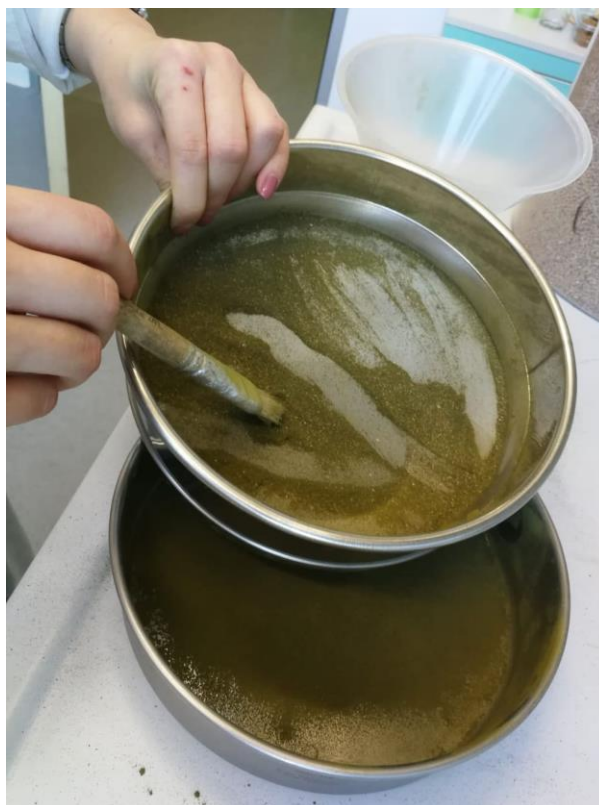
Slika 11. Carska paulovnja prosijana kroz sito promjera 150 \mu\text{m}