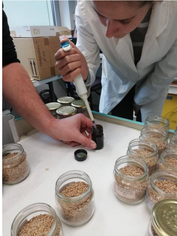
Slika 17. Primjena ekstrakta Kartell mikropipetom