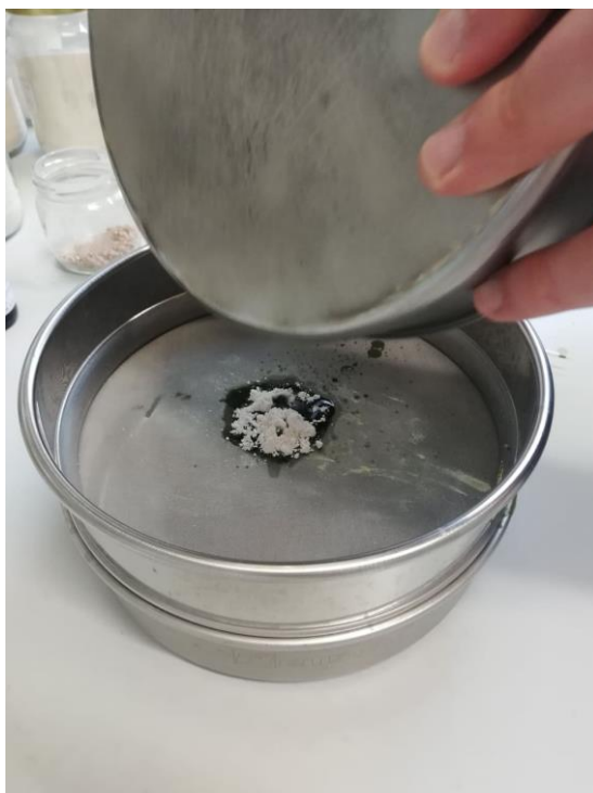
Slika 15. Ekstrakt prosijan kroz sito (150 \mu\text{m} )