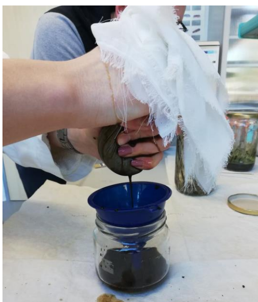
Slika 14. Ekstrakt iscijeđen kroz mlinsko platno