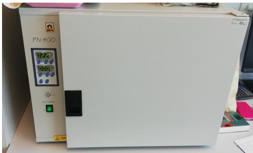
Slika 5. Uređaj za sušenje

Staklene posude volumena 720 ml ispunjene su s 300 g pšenice te je introducirano 200 odraslih jedinki obaju spolova različite starosti (slika 7.). Staklene posude prekrivene su perforiranim poklopcima, kako bi bilo moguće disanje. Nakon kopulacije u trajanju od 7 dana, roditelji su uklonjeni iz uzgojne podloge, a nakon 63 dana pojavljuju se prve odrasle jedinke F1 generacije, koji su se koristili u istraživanju.