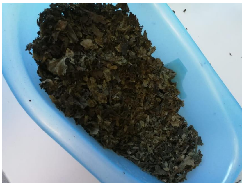
Slika 9. Usitnjeni list carske paulovnije