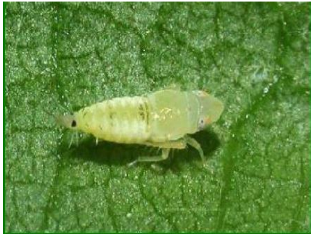
Slika 8. Ličinka trećeg stadija