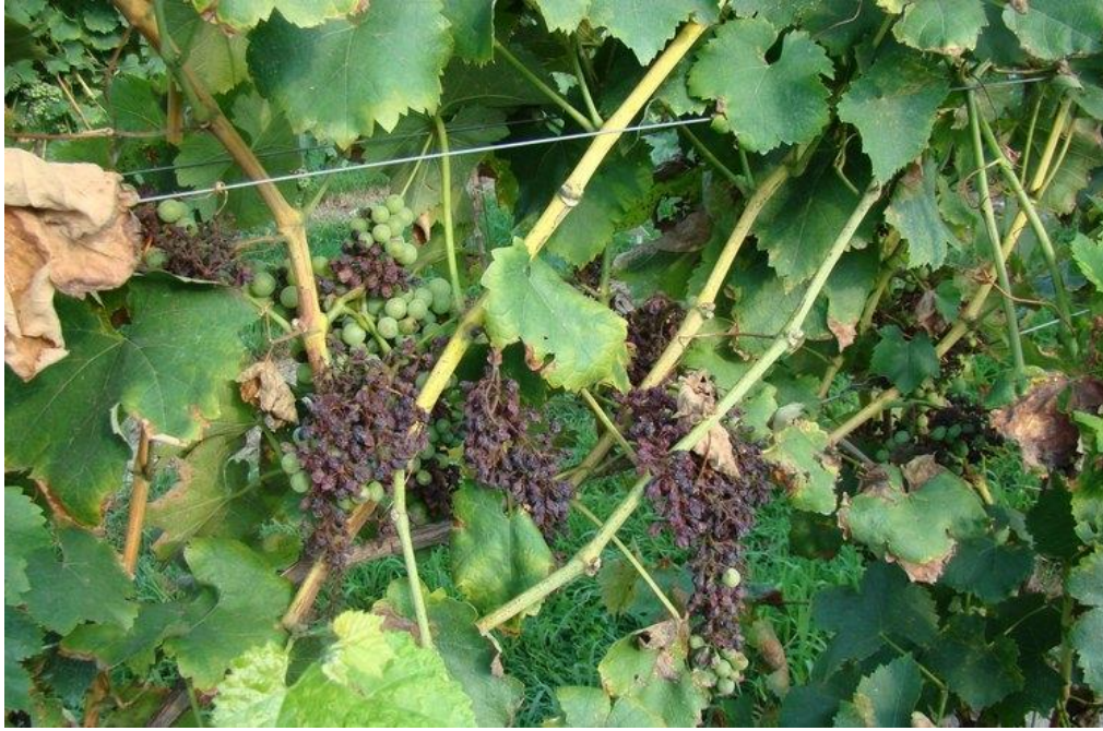
Slika 3. Plamenjača na grožđu

Na mladim listovima nastaju svijetlozelene do žute zone tzv. "uljane mrlje" koje se postupno povećavaju dosežući promjer 1 do 3 cm. Uskoro, nakon inkubacije, s donje strane lista na mjestu "uljanih mrlja" izbijaju bijele prevlake. To su brojni sporangiofori sa sporangijima. Zaražene zone postaju crvenkasto-smeđe. Na starim listovima nastaju žuta do crvenkasta polja omeđena žilama formirajući mozaik sa zelenim zdravim dijelovima lista. Bez obzira radi li se o primarnoj ili sekundarnoj zarazi, zaražene zone lista počinju smeđiti, a tkivo odumire i suši se. Na posmeđenom dijelu nema fruktifikacije jer je gljiva obligatni parazit i može egzistirati samo u živim stanicama. Micelij ulazi u zdravi dio lista, a pjega se postupno širi. Pjege se javljaju na nekoliko mjesta na listu, ali kada je zahvaćen veći dio plojke dolazi do sušenja i otpadanja lista. Do defolijacije može doći već krajem srpnja. Zaraženi listovi izvor su zaraze za ostale zelene organe ( www.pinova.hr ).