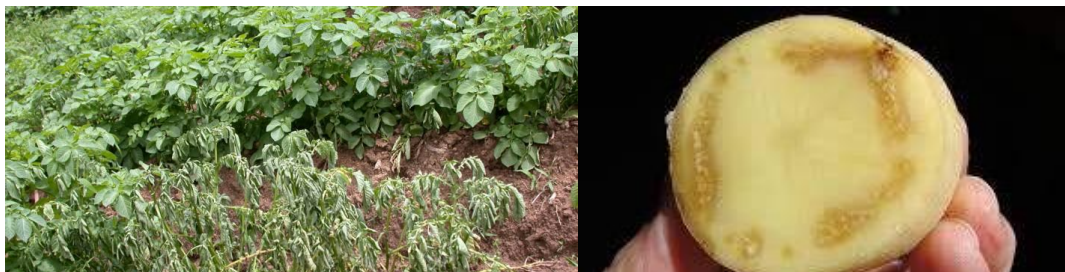
Slika 4. Štete na krumpiru uzrokovane Ralstonia solanacearum

od 24-48 sati pojavit će se žućkasti iscjedak. Sadnja ovakvog gomolja ne daje novu biljku. Gomolj će istrunuti ali će doći do kontaminacije tla. U rijetkim slučajevima takav gomolj će se razviti u biljku koja će također biti zaražena.