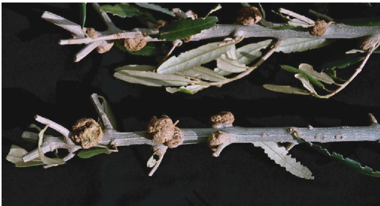
Slika 6. Bakterijski rak masline