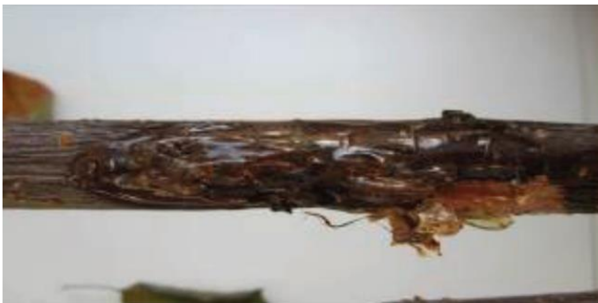
Slika 2. Smola iznad rak rane

Simptomi bolesti mogu se pojaviti na gotovo svim vidljivim dijelovima stabla: izbojcima, granama, deblu, listovima i plodovima. Simptomi ovise o sorti, starosti stabla, soju bakterije i drugim čimbenicima. Rak-rane mogu nastati na stablu i granama. Najčešće nastaju na mladicama, i to na mjestu na kojem je cvjetna stapka pričvršćena za izbojak. Na mjestu infekcije kora zaraženih mladica i grana puca i nastaju rak-rane. Na mjestu rak-rana pojavljuje se smola kao reakcija tkiva na prisutnost patogena (slika 2) dok provodno tkivo ispod kore mijenja boju i nastaje nekroza floema.