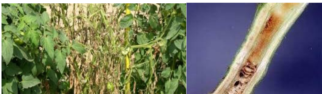
Slika 5. štete na listovima i stabljici rajčice uzrokovane Ralstonia solanacearum

Prve simptome bolesti vidjet ćemo pri kraju cvatnje na najmlađem lišću koje vene i propada. U vrijeme kada je temperatura tla oko 25°C i velika vlažnost biljka počne venuti s jedne ili obje strane te u roku nekoliko dana potpuno propadne. Ukoliko je temperatura tla niža od 21°C na stabljici se može razviti čupavo tj. adventivno korijenje. Provodno tkivo u stabljici poprima smeđu boju, a ukoliko je prerežemo vidljive su kapljice bijele i žućkaste bakterijske sluzi.