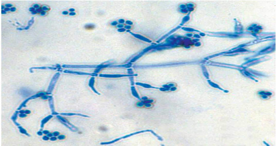
Slika 7. Trichoderma spp.

Pozitivan učinak gljivica ovog roda na biljke predmet su brojnih znanstvenih istraživanja u kojima je istražena učinkovitosti ovih gljiva u kontroli bolesti brojnih poljoprivrednih i povrtlarskih kultura, ukrasnog bilja, te pri uzgoju voća (Harman, 2000.; Howell, 2003.; Benitez i sur., 2004.; Smolinska i sur., 2007.).