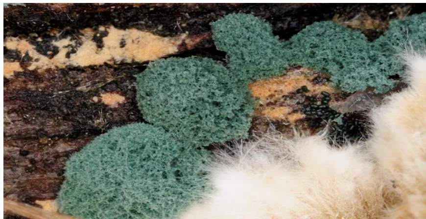
Slika 9. Trichoderma viride

Trichoderma viride stimulira rast korijena, povećava usvajanje i upotrebu hranjiva što dovodi do bujnijeg rasta. Danas se smatra kako je utjecaj T. viride od velike važnosti za poljoprivrednu proizvodnju kao i shvaćanje uloge Trichoderma vrsta u ekosustavu (Topolovec - Pintarić i sur. 2013.).