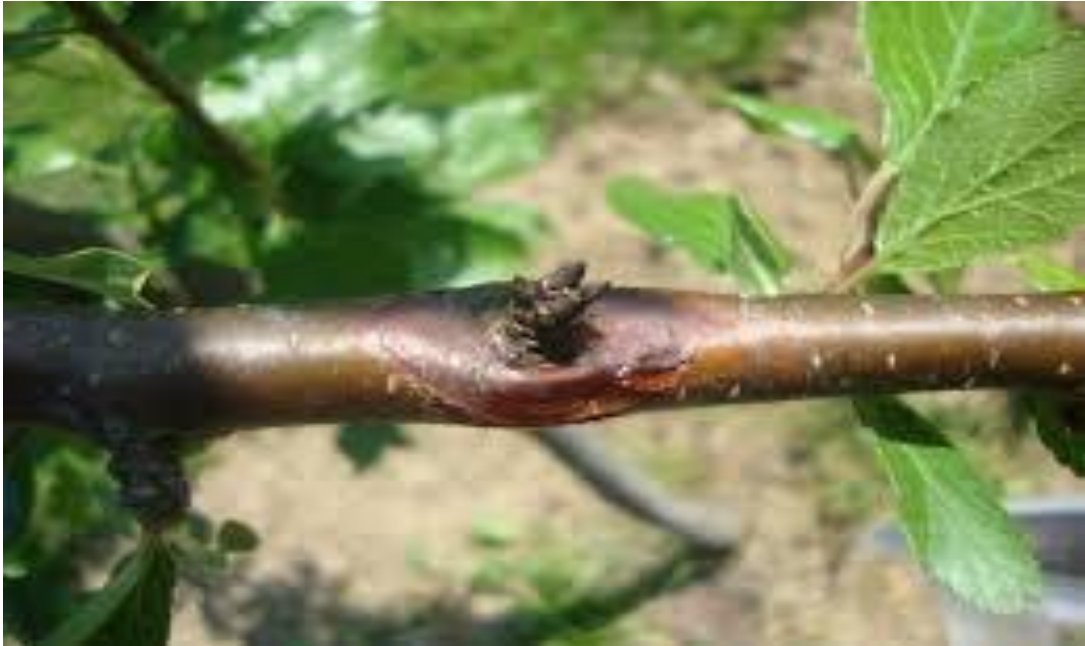
Slika 3. Bakterijski rak trešnje