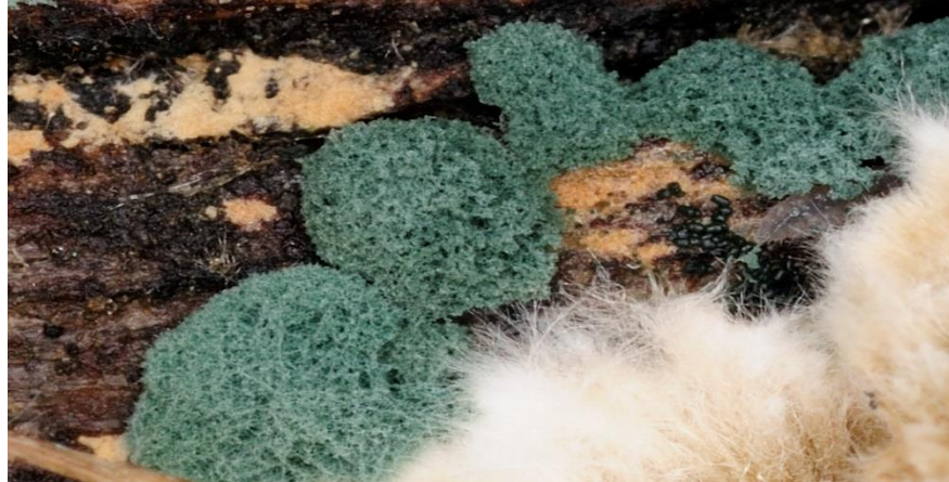
Slika 9. Trichoderma viride

Trichoderma viride stimulira rast korijena, povećava usvajanje i upotrebu hranjiva što dovodi do bujnijeg rasta. Danas se smatra kako je utjecaj T. viride od velike važnosti za poljoprivrednu proizvodnju kao i shvaćanje uloge Trichoderma vrsta u ekosustavu (Topolovec - Pintarić i sur. 2013.).