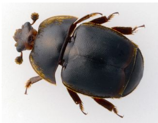
Slika 1: odrasla jedinka

Mali kornjaš košnice ( Aethina tumida ) je mali (oko 1/3 jedne trećine tijela radilice) ali izrazito opasan kukac. Ličinke ovog štetnika se hrane nepoklopljenim i poklopljenim leglom, peludom i medom u potpunosti uništavajući saće. Mali kornjaš se brzo razmnožava, a odrasle jedinke mogu bez hrane i vode preživjeti i do dva tjedna. U samo jednoj godini u košnici se može izmijeniti 4-5 generacija ovog kornjaša. Ovaj kornjaš nije opasan za pčele u Africi, odakle i potječe, već problem nastaje kad se seljenjem i prodajom pčelinjih zajednica bolest proširi na europske pčele koje nemaju dovoljno razvijen sustav za obranu od ovog štetnog kornjaša.