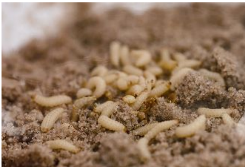
Slika 5: ličinke u zemlji

U rijetkim slučajevima, ličinke će puzati i do 200m kako bi pronašle tlo pogodno za ukapanje. Za dovršetak životnog ciklusa ličinke nužna je rahla i vlažna zemlja te temperatura iznad 10°C, iako uzročnik etinioze može preživjeti i na nižim temperaturama, no samo u periodu do tri tjedna. Odrasle jedinke obično se pojavljuju nakon 3-4 tjedna, iako se mogu pojaviti u bilo kojem trenutku između 8-84 dana ovisno o temperaturama. Također, odrasle jedinke mogu aktivno letjeti najmanje 10km, te je mogućnost prenošenja vrlo velika. Kornjaši mogu preživjeti do 9 dana bez vode ili hrane, na saću 50 dana, a na voću i do nekoliko mjeseci.