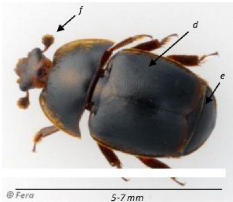
Slika 4: građa odrasle jedinke