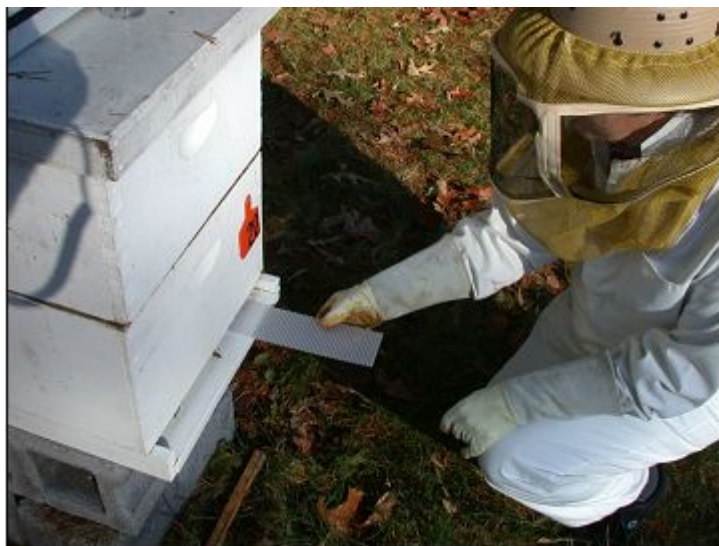
Silka 6: postavljanje klopke