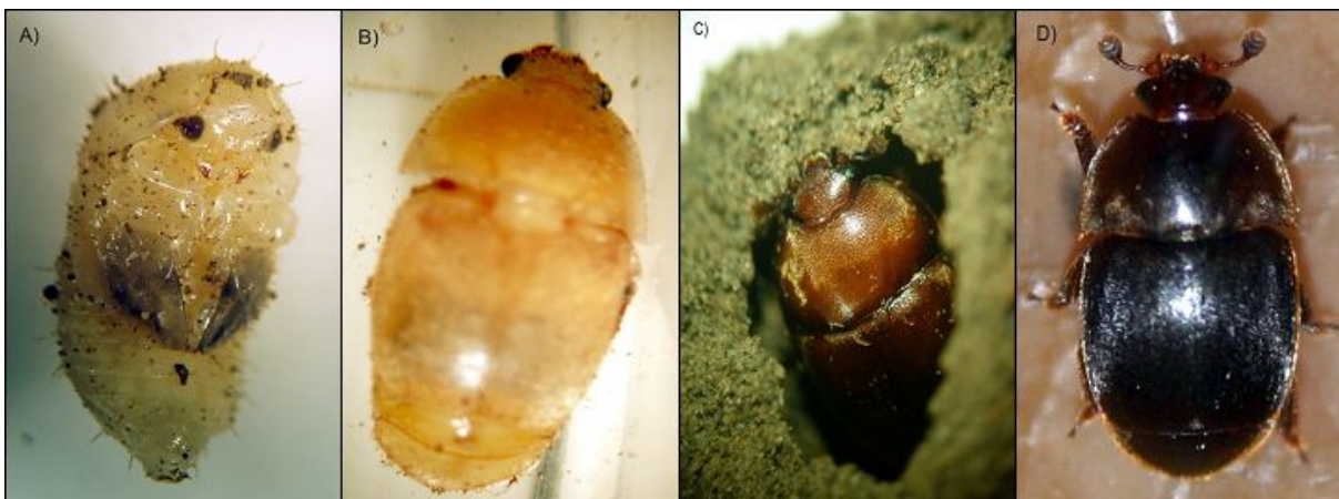
Slika 7: faze razvoja malog kornjaša

potamne i do tamno smeđe, čak i crne boje. Glava, grudni koš i abdomen su razdvojeni. Cijelo tijelo mu je prekriveno dlakom.