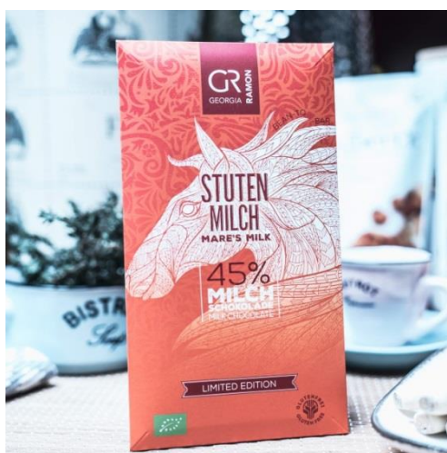
Slika 12. GR čokolada od kobiljeg mlijeka