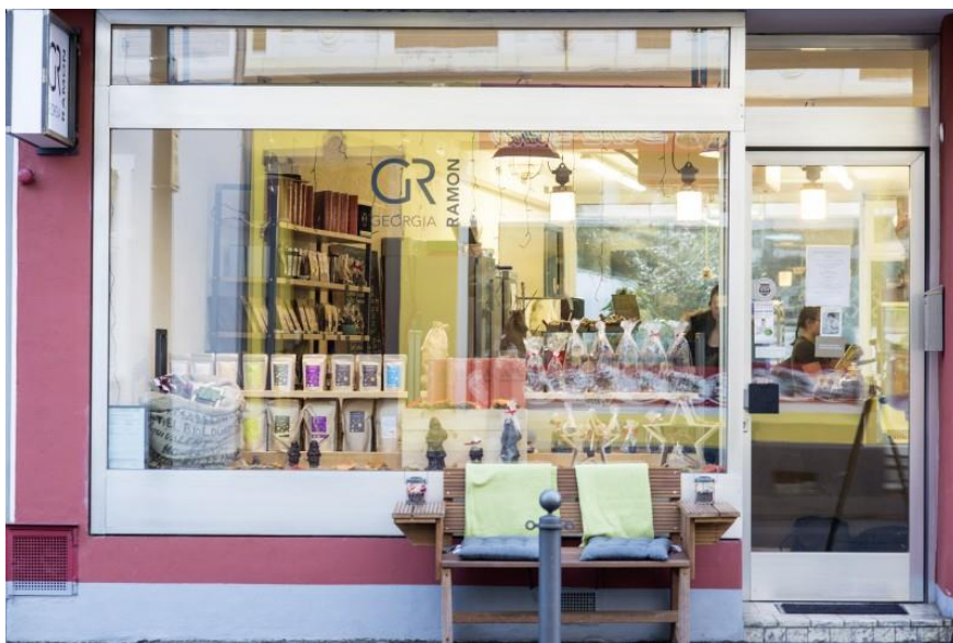
Slika 11. Georgia Ramon trgovina