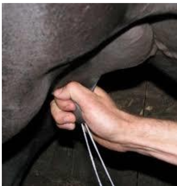
Slika 1. Ručna mužnja kobilu

Mlijeko iz sise se izmuzuje u posudu laganim stiskom između palca i kažiprsta u njenom bazalnom dijelu i povlačenjem prema vrhu sise (Alatrović i sur., 2017.). Izmuzuje se i u vidu dva mliječna mlaza radi postojanja dva sisna kanala u svakoj sisi. Postupak se ponavlja sve do završetka mužnje. Tijekom mužnje prvo se izmuzuje mlijeko iz cisterne sise i vimena, potom iz kanala i alveola vimena. Stoga se tijekom mužnje uočava prva faza mužnje u kojoj se izmuzuje mlijeko iz cisterni, zatim slijedi jedna kraća faza „slijepe mužnje“ u kojoj djelovanje oksitocina nije izraženo te slijedi drugi val alveolarnog mlijeka koje se sintetizira u vimenu neposredno tijekom mužnje pod utjecajem oksitocina (Ivanković i sur., 2014.).