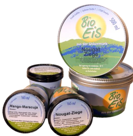
Slika 10. Pakiranje sladoleda

Proizvodnja kobiljeg mlijeka počela se razvijati u drugoj polovici prošlog stoljeća. U Njemačkoj je registrirano oko 40 gospodarstava koji se bave proizvodnjom kobiljeg mlijeka (Gregić i sur., 2018.a). Njemački slastičar Koller u svoje proizvode dodaje kobilje mlijeko. Proizvodi sladoled i distribuira ga na tržište po cijeloj Njemačkoj. Njegov asortiman sadrži više od 60 različitih vrsta sladoleda koji se proizvodi ručno prema staroj tradiciji. Koller koristi prirodne sirovine od ekoloških uzgoja kao što su voće i povrće za veganske sladolede. Proizvodi sladoled od ovčjeg, kozjeg i kobiljeg mlijeka. Mlijeko za pripremu sladoleda nabavlja izravno s poljoprivrednih gospodarstava, koja su specijalizirana za proizvodnju organskog mlijeka. Koller proizvodi razne kreacije sladoleda kao što su maline s fermentiranim kobiljem mlijekom ili sladoled od ovčjeg mlijeka s ružičastim paprom. Sladoled se pakira u šalice kapaciteta 500 i 165 ml ( https://koeller-organic-manufactory.de/koeller.icecream.html ).