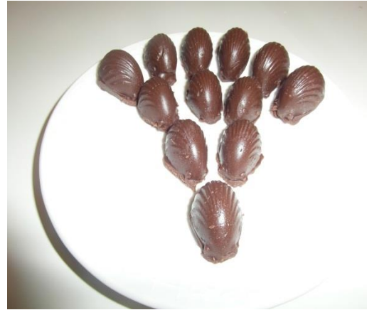
Slika 26. Čokolada kalup praline (Janković, 2019.)