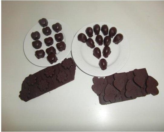
Slika 25. Čokolada od kobiljeg mlijeka (Janković, 2019.)