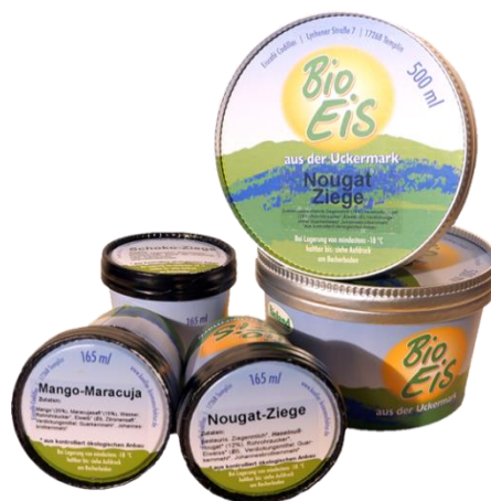
Slika 10. Pakiranje sladoleda

Proizvodnja kobiljeg mlijeka počela se razvijati u drugoj polovici prošlog stoljeća. U Njemačkoj je registrirano oko 40 gospodarstava koji se bave proizvodnjom kobiljeg mlijeka (Gregić i sur., 2018.a). Njemački slastičar Koller u svoje proizvode dodaje kobilje mlijeko. Proizvodi sladoled i distribuira ga na tržište po cijeloj Njemačkoj. Njegov asortiman sadrži više od 60 različitih vrsta sladoleda koji se proizvodi ručno prema staroj tradiciji. Koller koristi prirodne sirovine od ekoloških uzgoja kao što su voće i povrće za veganske sladolede. Proizvodi sladoled od ovčjeg, kozjeg i kobiljeg mlijeka. Mlijeko za pripremu sladoleda nabavlja izravno s poljoprivrednih gospodarstava, koja su specijalizirana za proizvodnju organskog mlijeka. Koller proizvodi razne kreacije sladoleda kao što su maline s fermentiranim kobiljem mlijekom ili sladoled od ovčjeg mlijeka s ružičastim paprom. Sladoled se pakira u šalice kapaciteta 500 i 165 ml ( https://koeller-organic-manufactory.de/koeller.icecream.html ).