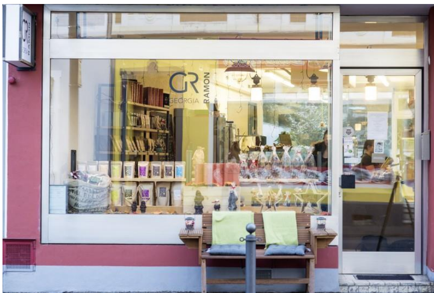
Slika 11. Georgia Ramon trgovina