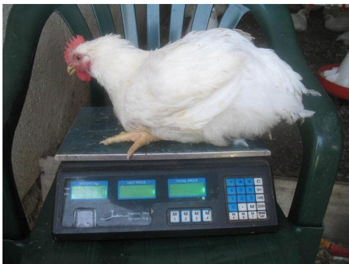
Slika 4. Hibrid Ross

Ross hibridi potječu s Novog Zelanda. Ovaj hibrid je poznat po svojim širokim prsima, bijelim stopalima i divljem apetitu koji im omogućuje da brzo rastu. ( http://www.cobb-vantress.com/products/cobb500 )