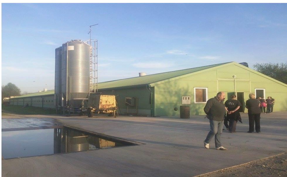
Slika 1. Peradarska farma

Osim peradarstvom, OPG „Mirjana Lučić“ se bavi još i uzgajanjem šećerne repe, kukuruza, pšenice i soje koje se nakon uzgoja prodaju na tržište. Zaposlen je 1 radnik koji obrađuje zemlju ukupne površine 30 hektara i pomaže na farmi oko uzgoja brojlera.