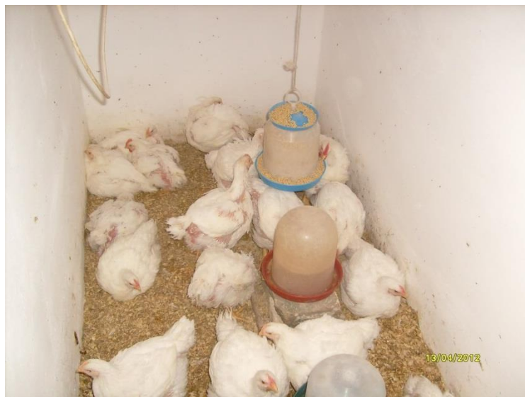
Slika 5. Hibrid Cobb

svijeta. Cobb ima najnižu cijenu žive vage, vrhunske performanse na nižoj cijeni obroka hrane, izvrsnu stopu rasta i malu konverziju hrane.