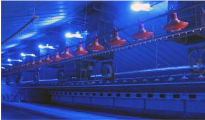
Slika 3. Način osvjetljenja na farmi OPG-a „Mirjana Lučić“