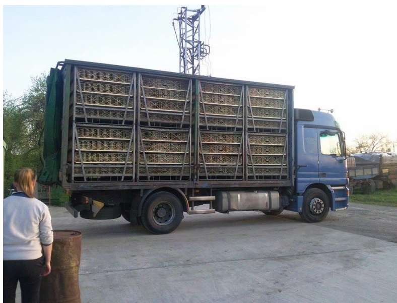
Slika 9. Kamion za izlov pilića

Na OPG-u „Mirjana Lučić“ primjenjuje se drugi način. Nikada uhvaćene piliće ne treba predavati iz ruke u ruku. Posebnu pažnju treba obratiti na sam čin stavljanja brojlera u gajbu jer se tu mogu stvoriti ozljede. Brojleri se prvo stavljaju u gajbe, a zatim se gajbe pažljivo stavljaju na kamion. I gajbe i kamion moraju biti temeljito oprani i dezinficirani. Broj pilića u gajbama zavisi od završne težine. Smrtnost tokom hvatanja i transporta brojlera ne smije biti veća od 1,5%.