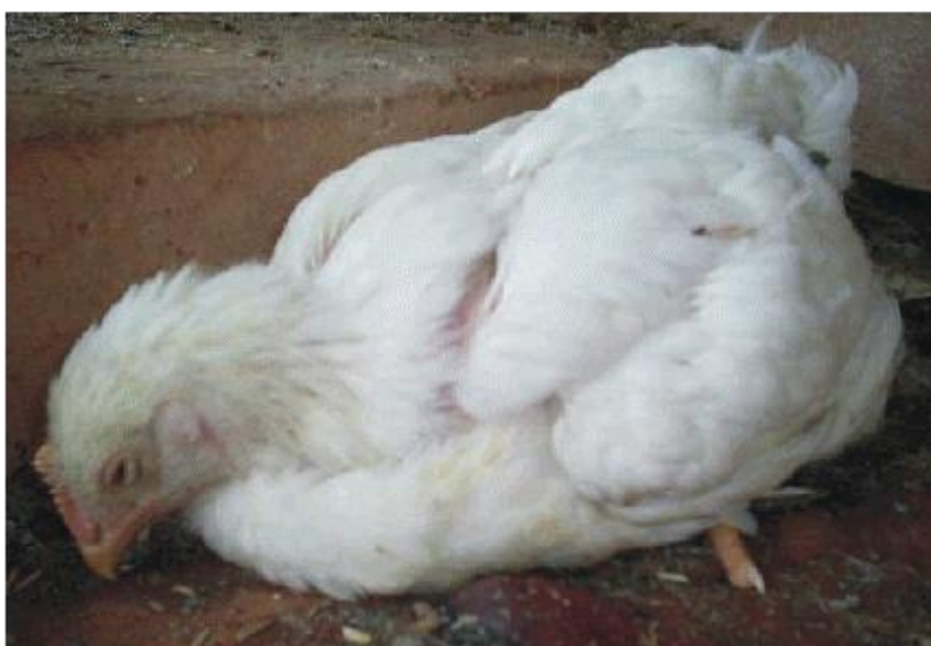
Slika 12. Posljedice kokcidioze