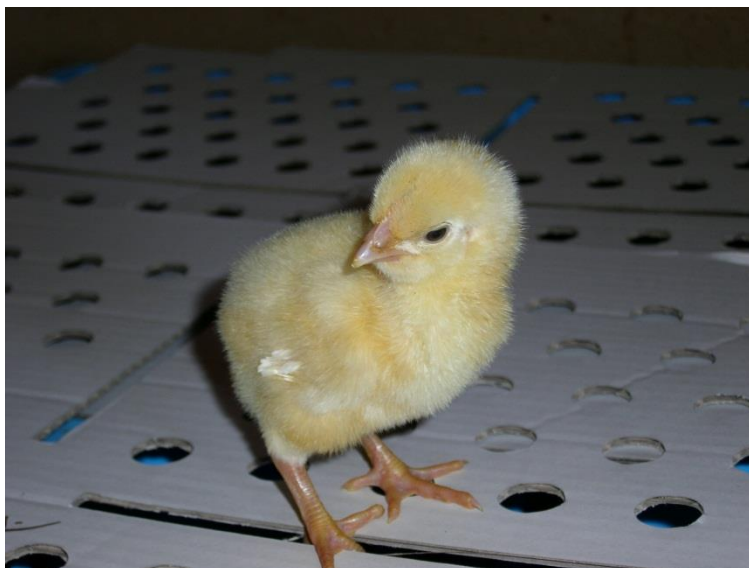
Slika 7. Kvalitetno pile

Pile treba biti dobro osušeno, mora imati dugo paperje, mora imati jasne, okrugle i aktivne oči, izgled aktivan i vitalan, noge svijetle i voštane na dodir, da nemaju crvenih zglobova, bez vidljivih deformacija. Težina pilića na prijemu trebala bi biti oko 40 grama, a ovisi o starosti matičnog jata. Pile može iznositi 45-47 grama na starost od 35-40 tjedana matičnog jata ili 40-45 grama na starost od 30 tjedana.