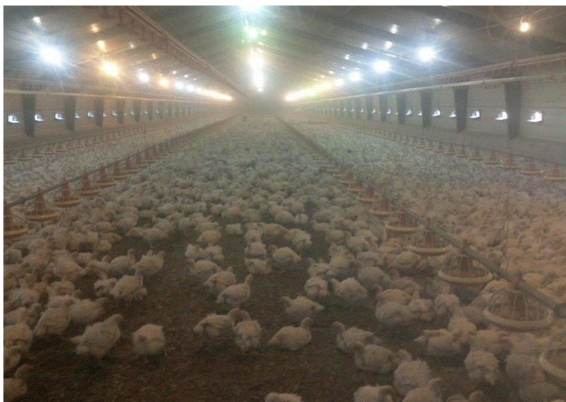
Slika 10. Pilići pred izlov