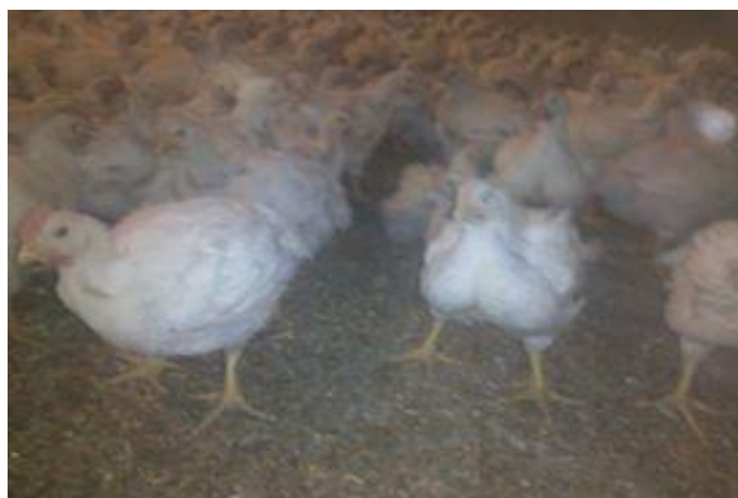
Slika 6. Hibridi