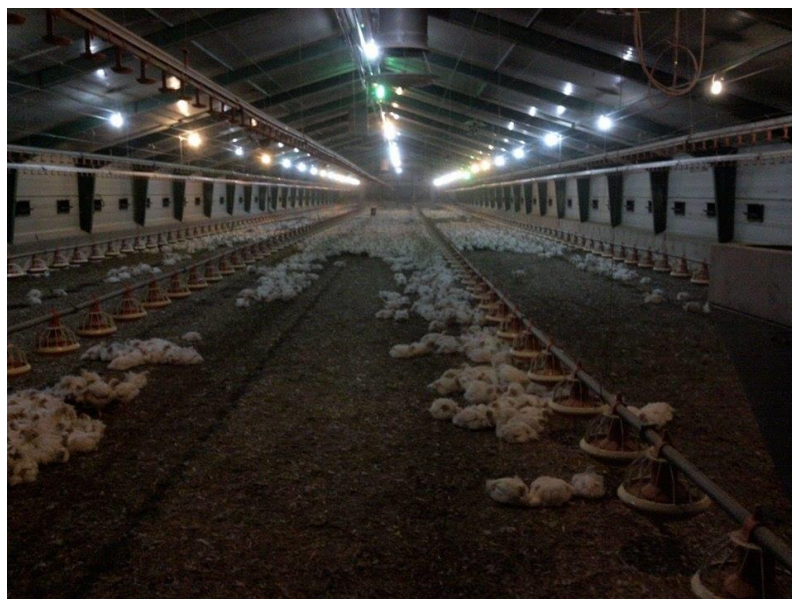
Slika 8. Hranilice i pojilice