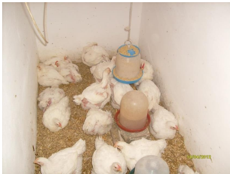
Slika 5. Hibrid Cobb

svijeta. Cobb ima najnižu cijenu žive vage, vrhunske performanse na nižoj cijeni obroka hrane, izvrsnu stopu rasta i malu konverziju hrane.