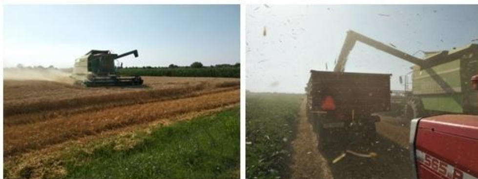
Slika 15. Žetva pšenice žitnim kombajnom na OPG-u Ivica Jurić