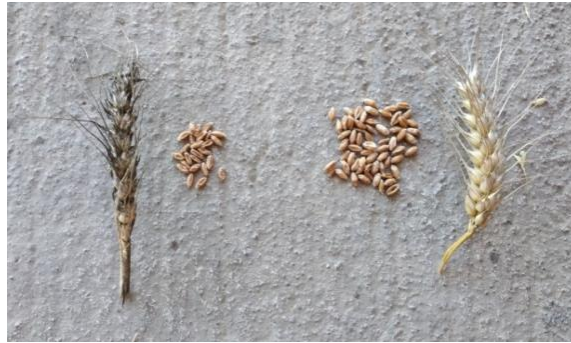
Slika 1. Izgled zdravog klasa i klasa oštećenog suviškom vlage

promatranjem izgleda klasa uočeno je kako je zasićenost tla vodom na pojedinim mjestima rezultirala šturošću klasa, slabijom nalivenošću i reduciranim brojem zrna (slika 1.).