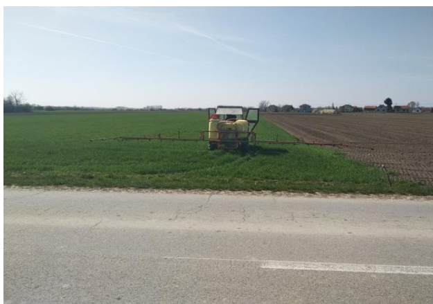
Slika 9. Tretiranje pšenice herbicidom „Sekator OD“

Ovo sredstvo se nalazi na popisu Glasila biljne zaštite za 2019. godinu i kao takvo ima dozvolu za korištenje u ovoj vegetacijskoj sezoni, a rabi se za potrebe prevencije protiv biljnih bolesti kao: pepelnica ( Blumeria graminis ), hrđa ( Puccinia spp. ), pjegavost lista ( Zymoseptoria tritici ), pjegavost pljevica ( Parastagonospora nodorum ), palež klasa ( Fusarium spp. ) i polijeganje žita ( Oculimacula yallundae )