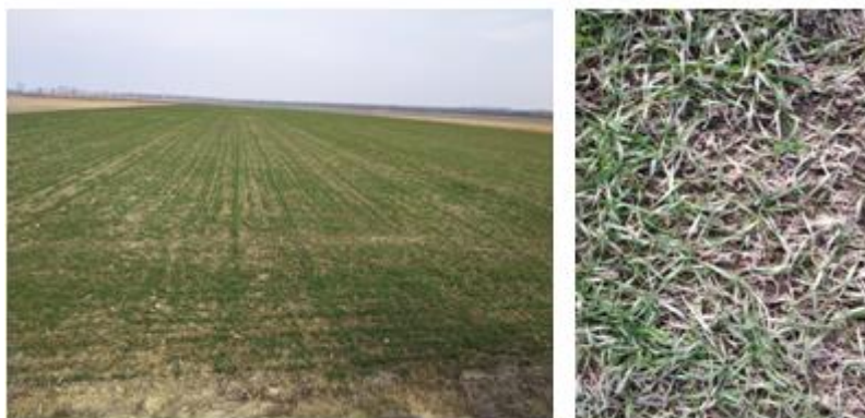
Slika 9. Izgled pšenice prilikom prve prihrane

Prva prihrana pšenice obavila se 20.2. 2019. u fazi busanja pšenice, dok druga prihrana, ona koja se inače obavlja u fazi vlatanja, nije bila provedena zbog učestalih oborina koji su u tom periodu vladali, pa je zato prolongirana u vrijeme prije klasanja pšenice.