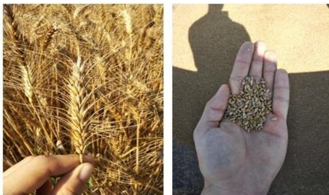
Slika 14. Klas i zrno pšenice u vrijeme žetve

Na OPG-u Ivica Jurić, žetva je u sezoni 2018./2019. započela 3. srpnja i završila se 5. srpnja. Vremenske prilike tog razdoblja su bile povoljne i žetva je protekla vrlo brzo i bez poteškoća. Slika 18. prikazuje izgled klasa i zrna pšenice, a slika 19. daje prikaz procesa žetve.