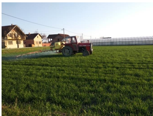
Slika 8. Prvo tretiranje pšenice fungicidom „Pointer“

Ovo sredstvo se nalazi na popisu Glasila biljne zaštite za 2019. godinu i kao takvo ima dozvolu za korištenje u ovoj vegetacijskoj sezoni, a rabi se za potrebe prevencije protiv biljnih bolesti kao: pepelnica ( Blumeria graminis ), hrđa ( Puccinia spp. ), pjegavost lista ( Zymoseptoria tritici ), pjegavost pljevica ( Parastagonospora nodorum ), palež klasa ( Fusarium spp. ) i polijeganje žita ( Oculimacula yallundae )