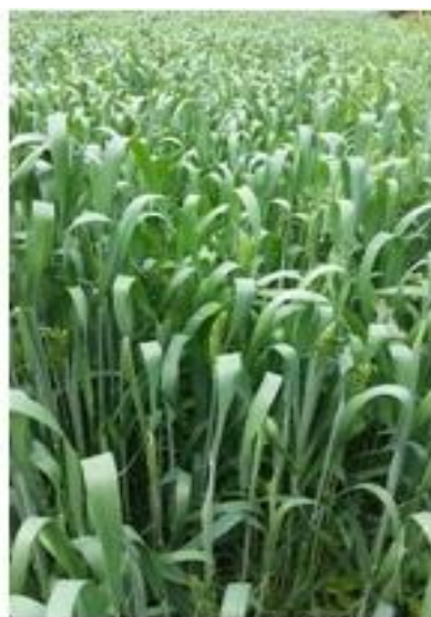
Slika 11. Izgled pšenice prilikom druge prihrane

Druga prihrana je provedena početkom svibnja s KAN-om u količini od 100 kg/ha. Slika 11. prikazuje vizualno stanje pšenice u tom razdoblju.