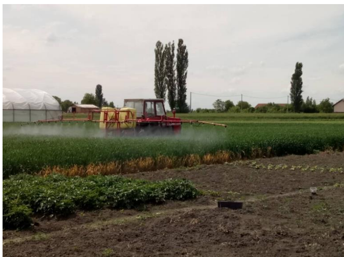
Slika 11. Drugo tretiranje pšenice fungicidom Amistar Extra

Iako je obavljeno tretiranje protiv smeđe hrđe ( Puccinia recondita ), monitoringom usjeva 11.6. 2019. je ustanovljeno kako je ova bolest ipak prisutna i to kod obje sorte. Stanje usjeva na prethodno napisan datum je izgledalo kao što je prikazano slikom 16.