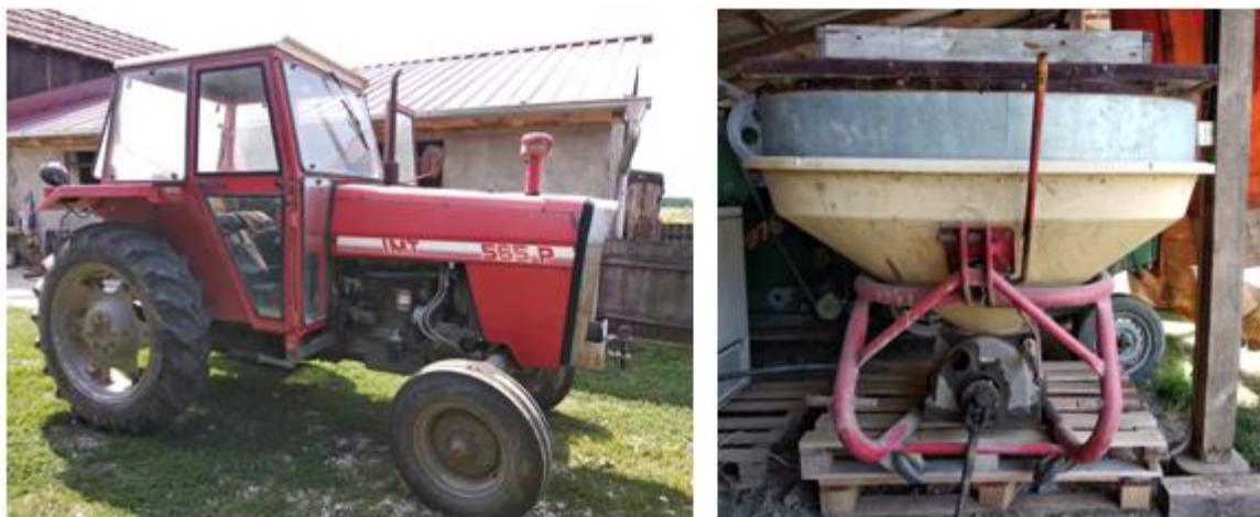
Slika 6. Mehanizacija korištena prilikom osnovne gnojidbe

Slika 6. prikazuje traktor IMT 565 koji posjeduje 65 konjskih snaga i rasipač kojim se ovo mineralno gnojivo ravnomjerno raspodijelilo po parcelama.