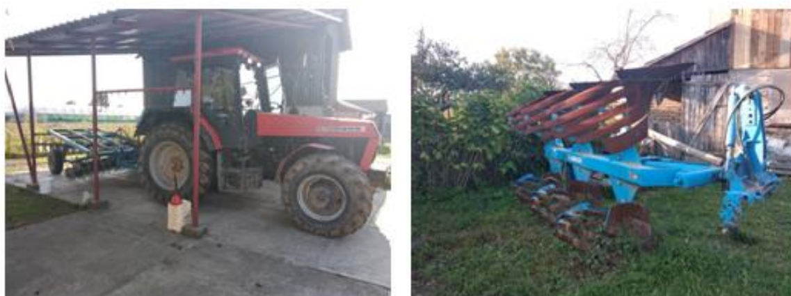
Slika 4. Korištena mehanizacija prilikom osnovne obrade tla

Nakon oranja, uslijedilo je tanjuranje. Tanjuranje je suzbilo izniknule korove koji su, u određenoj mjeri, postali vrijedna organska masa koja je inkorporirana u tlo, koja uz prisustvo mikrobiološke populacije biva razgrađena do razine humusa koji je neophodan za svako tlo i biljku pokazujući i samu kvalitetu istoga. Nedostatak kiše u rujnu i listopadu je uvjetovao pliće tanjuranje zbog nemogućnosti dubljeg prodiranja tanjurače uvjetovane sušnim periodom. Nedugo nakon prvog tanjuranja, započelo je i drugo tanjuranje kojemu je cilj bio jednak kao i prvi put. Slika 4. prikazuje mehanizaciju kojom je obavljena osnovna obrada tla u vidu oranja plugom i dvostrukog tanjuranja tanjuračom. U oba slučaja korišten je traktor „Ursus 1234“ koji ima 120 konjskih snaga.