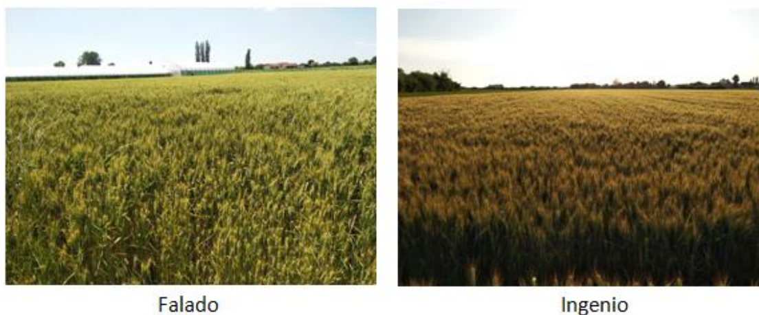
Slika 10. Izgled usjeva obaju sorti pred kraj vegetacije

Tretiranje ovim herbicidom se pokazalo iznimno uspješnim o čemu svjedoči slika 14. na kojoj je jasno vidljivo da je usjev čist od korova, uz iznimku ponekog korova na rubovima parcela koji ne predstavljaju opasnost za sam usjev.