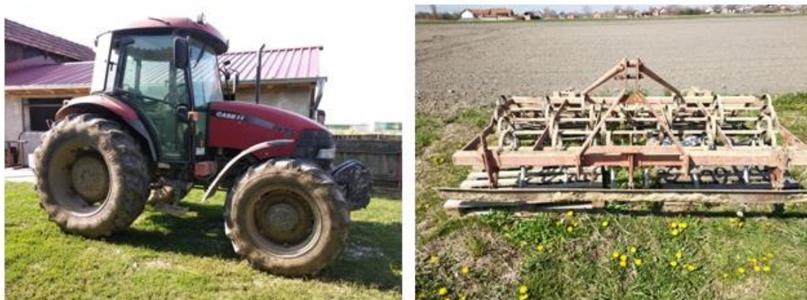
Slika 5. Mehanizacija korištena prilikom predsjetvene pripreme tla

nošeni sjetvospremač je u trenutku rada postao vučen od strane traktora Case-a JX koji posjeduje 95 konjskih snaga što je dovoljno za rad sa ovim 270 cm širokim mehanizacijskim uređajem (Slika 5.)