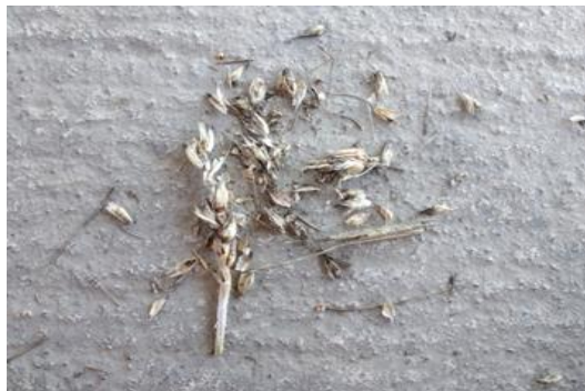
Slika 2. Potpuni gubitak zrna u klasu uslijed dugotrajne vlažnosti

Također, rubovi parcela su zbog povećanog broja okretanja i sabijanja tla tijekom obrade, sjetve i njege usjeva bili više sabijeni poljoprivrednim strojevima nego središnji dio, a to je dovelo i do teže propusnosti tla, pa je na takvim dijelovima bilo i 100%-tnih gubitaka uslijed povećane vlažnosti tla (Slika 2.)