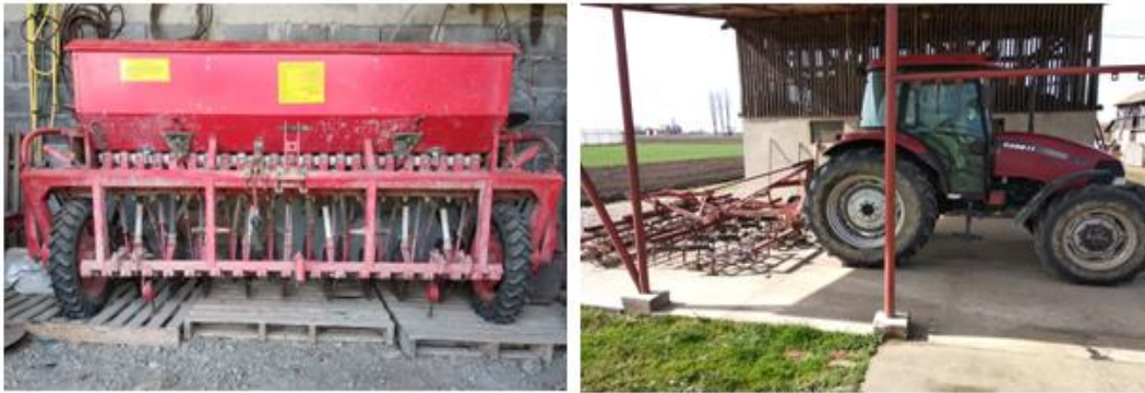
Slika 7. Mehanizacija za sjetvu – žitna sijačica i drljača

Obje sorte su posijane unutar optimalnih rokova sjetve, s tim da je sorta „Falado“ posijana oko 10. listopada, a sorta „Ingenio“ oko 25. listopada. Najveći razlog zbog kojeg pšenica nije posijana točno u dan je što je zbog velikih površina bilo tehnički nemoguće uspjeti posijati sve unutar jednog dana. Pšenica je sijana žitnom sijačicom s razmakom od 12,5 cm. Sjetva je obavljena na dubinu od 3 do 5 cm, s tim da je nakon sjetve dodatno zagrnuta drljačom kako ptice ne bi pozobale dio sjemena, ali također i iz razloga što je tlo u periodu sjetve, a i prije, bilo dosta suho. Sjetvena norma je kod obje sorte iznosila 220 kg po hektaru. Slika 7. prikazuje mehanizaciju kojom je obavljena sjetva.