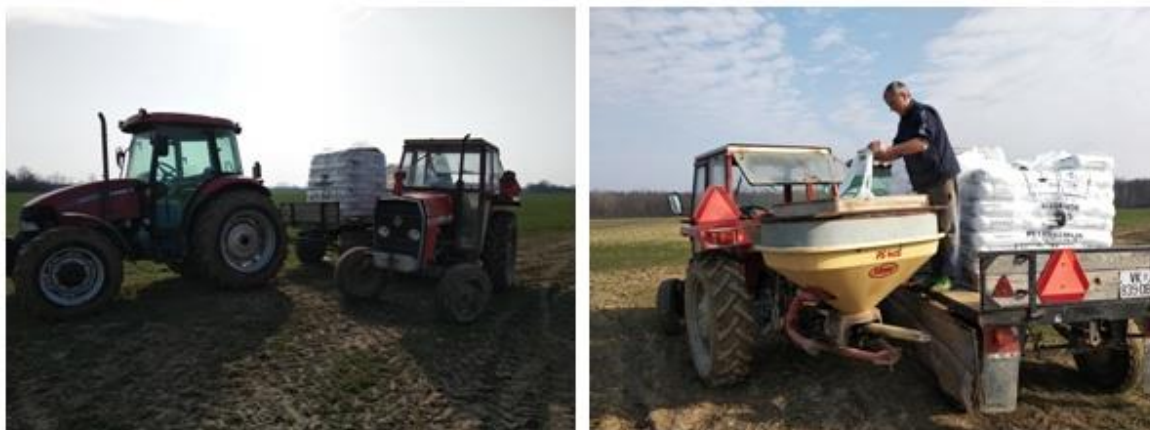
Slika 10. Mehanizacija korištena prilikom prve prihrane

Druga prihrana je provedena početkom svibnja s KAN-om u količini od 100 kg/ha. Slika 11. prikazuje vizualno stanje pšenice u tom razdoblju.