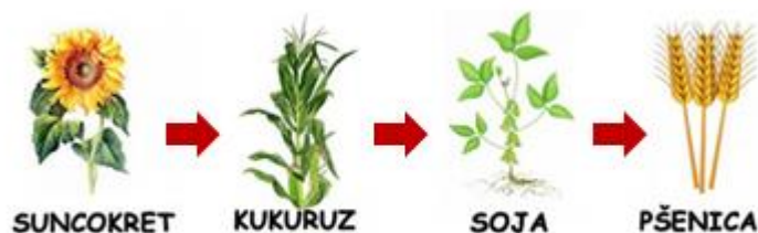
Slika 3. Primijenjen plodored za sjetvu pšenice na OPG-u Ivica Jurić

Na OPG-u Ivica Jurić, primijenjen je sljedeći plodored koji je prikazan slikovno slikom broj 3.