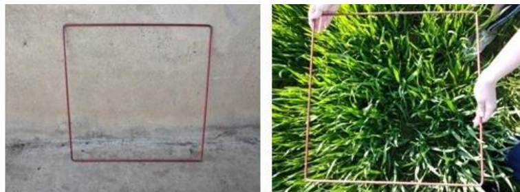
Slika 8. Utvrđivanje gustoće sklopa pšenice na kvadratnome metru

Tijekom vegetacije utvrđen je sklop biljaka pomoću okvira koji obuhvaća površinu od 0,5 m 2 (slika 8.). Unutar okvira su na više mjesta unutar parcele izbrojane biljke te je prosječna vrijednost sklopa kod obje sorte iznosila oko 650, što je zadovoljavajuće za postizanje dobrih prinosa