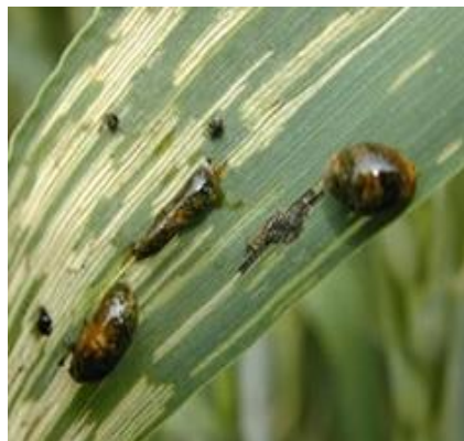
Slika 13. Crveni žitni balac ( Oulema melanopus ) u stadiju ličinke

Suzbijanje ovog najznačajnijeg štetnika obavilo se početkom svibnja primjenom insekticida „Vantex“. Djelatna tvar je gama - cihalotrin koja se pojavljuje u količini od 60 g/L. Formulacijska oznaka je MC, a označava da se ovaj insekticid pojavljuje kao mikroinkapsulirani koncentrat za suspenziju.