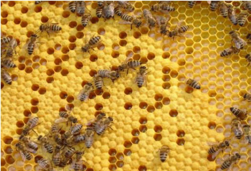
Slika 4 Pčelinja zajednica

Pčele se organiziraju u zajednice u obliku košnica. U jednoj košnici nalazi se od 50 do 80 tisuća pčela, podijeljenih u zadatke, prema svojoj starosti. Mlade pčele do 21 dana života uglavnom se brinu oko izgradnje saća, čišćenja košnica, hranjenja ličinki iz kojih će se izlijeći novi naraštaji pčelinje zajednice u kojoj žive.