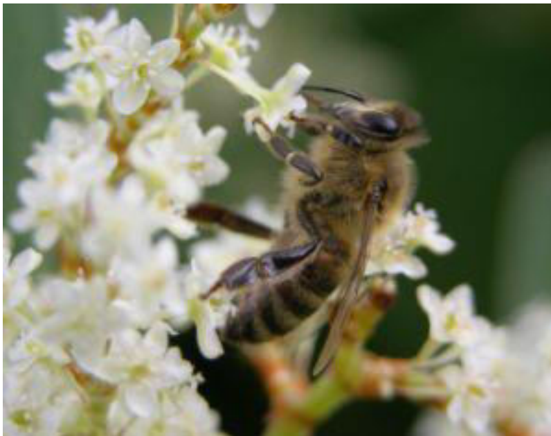
Slika 2 Oprašivanje

Oprašivanje pčelama povećava postotak ulja odnosno proteina u ratarskih i industrijskih kultura. U voćarstvu se povećava udio plodova I. klase, što je utvrđeno u proizvodnji jabuka, kivija, jagoda, trešanja. U sjemenarstvu bi oprašivanje pčelama trebalo postati nezaobilazna mjera jer se značajno povećava klijavost, te tako bitno utječe na prinose, naročito leguminoza.