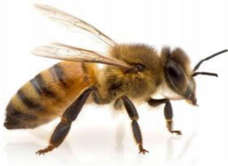
Slika 1 Apis mellifica var. carnica Poll

Apis mellifera carnica ili siva medonosna pčela, kranjska pčela veličinom je gotovo ista kao talijanska medonosna vrsta i zapadnoeuropska tamna vrsta ( Apis mellifera mellifera ) s nešto dužim jezikom od 6,5-6,7 mm s kojim može dohvatiti i zahtjevnije paše te tanjim trbuhom od tamne pčele.