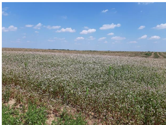
Slika 19. Stanje usjeva heljde, 17.srpnja, kontrola, Ivankovo