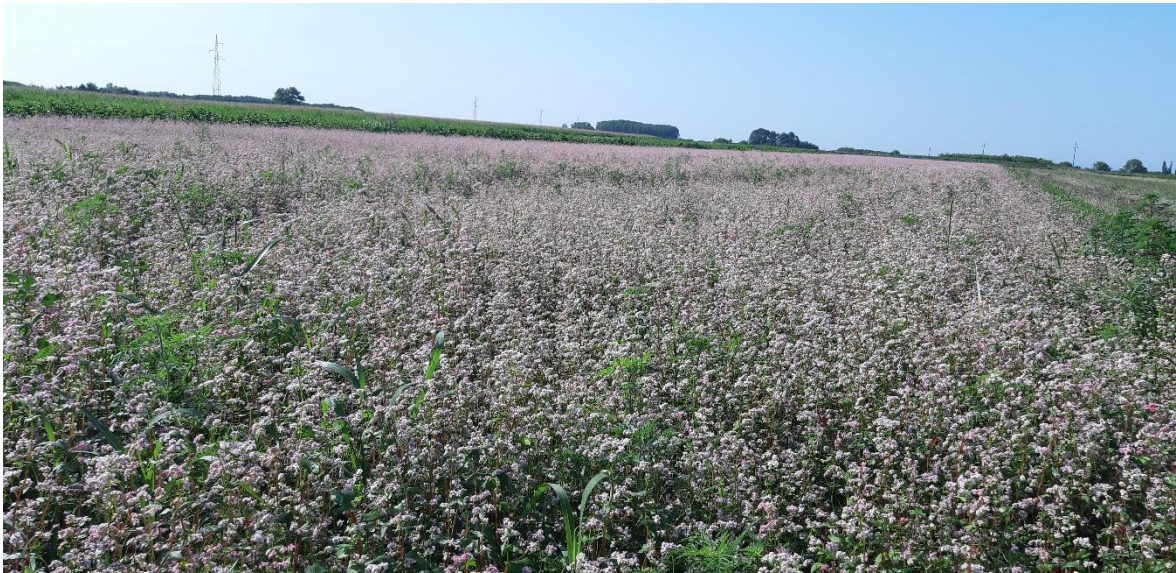
Slika 2. Heljda

boju, a zrela stabljika poprima smeđu boju. Može biti visoka od 50 do 150 cm. Listovi, koji su također crvenkasti, građeni su od peteljke i sroljke plojke. Plodni dio nalazi se na vrhu stabljike, u obliku cvjetova skupljenih u cvatove. Svaki cvijet sastoji se od 5 lapova, 5 latica, 8 prašnika i jednog tučka. Boja latica varira od bijele do ružičaste. Svaka biljka nosi mnogo cvjetova, ali zbog nepovoljnih klimatskih uvjeta, koji uzrokuju smanjenu pojavu kukaca koji vrše oprašivanje, samo mali broj njih se razvije u smeđe trokutasto sjeme puno škroba, dužine 5-6 mm. Stanice perikarpa su tvrd, a hranjivo staničje je bijele boje. Oljušteno zrno sadrži oko 80 % škroba, 10 -15 % bjelančevina, 1- 2 % sirovih vlakana, 2-3 % masti i 1-2 % mineralnih tvari. 100 kilograma zrna može se dobiti do 70 kilograma tamnog brašna.