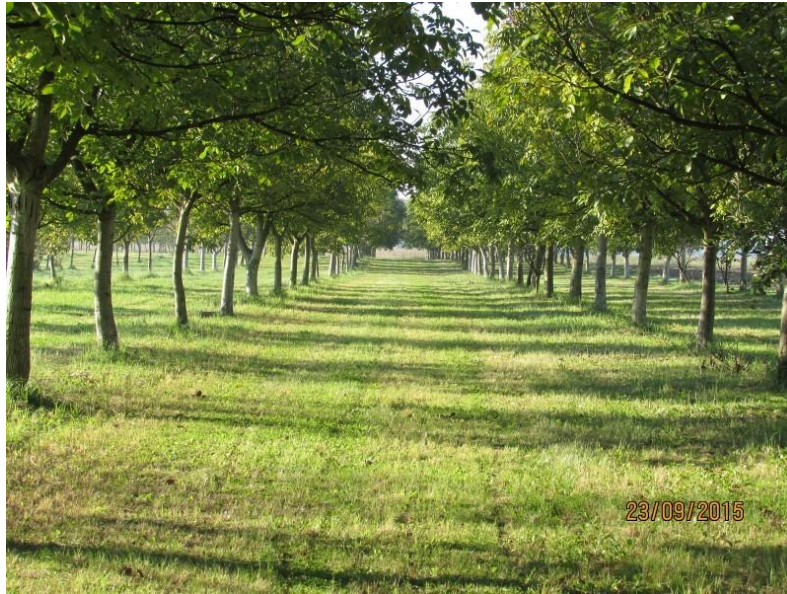
Slika 11. Nasad oraha