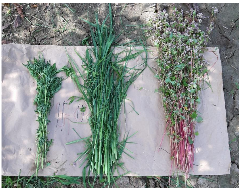
Slika 13. Đakovo, Orah/heljda; ambrozija, ostale korovne vrste, heljda