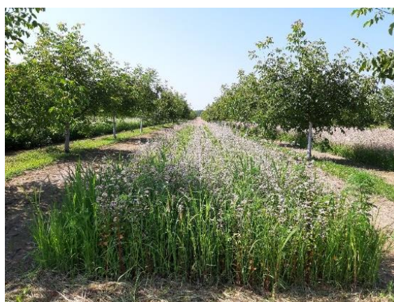
Slika 18. Stanje usjeva heljde u konsocijaciji s orahom, 17. srpnja, Đakovo