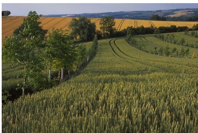
Slika 8. Orasi i žitarice

Smatra se da je agrošumarstvo održiva uporaba zemljišta, budući da kombinira šumarstvo s proizvodnjom ratarskih kultura ili stočarstvom. Burgess i sur. (1999.) definiraju agrošumarstvo kao praksu namjernog integriranja drvenaste vegetacije (drveća ili grmlja) i usjeva ili sustava uzgoja životinja radi pozitivnih ekoloških i ekonomskih interakcija. Sve je veći broj poljoprivrednika koji kombiniraju ratarske kulture kao međuredni usjev u nasadima i voćnjacima kako bi osigurali prihod dok nasad ne počne davati plodove. Maline, borovnice, aronija i slično bobičasto voće dobar su izbor zbog visoke vrijednosti ploda. Združena proizvodnja osigurava veći broj pozitivnih čimbenika kao što su sekvestracija ugljika, poboljšano kruženje elemenata i povećana bioraznolikost. Zbog porasta stanovništva u drugoj polovini 20. stoljeća bilo je potrebno povećati prinose. Kao rezultat takve intenzivnije poljoprivredne proizvodnje i mehanizacije, zastupljenost drvnih biljnih vrsta na poljoprivrednom zemljištu se smanjila (Quinkenstein i sur., 2009). Iako je takva promjena dovela do pozitivnih poboljšanja u produktivnosti i iskoristivosti zemljišta, dovodi se u vezu s nekim negativnim čimbenicima kao što su gubitak bioraznolikosti, erozija i zagađenje vode. Potencijalni pozitivan utjecaj agrošumarstva na ekosistem opisalo je više autora (Jose i sur., 2013; Quinkenstein i sur., 2009; Tsonkova i sur., 2012.).