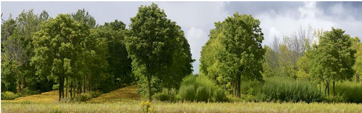
Slika 10. Primjer agrošumarstva s raznim međuusjevima

Preporučeni razmak između redova drveća je 10 do 20 metara, ovisno o svrsi i kulturi s kojom se kombinira. Najpovoljnije je ostaviti što veći razmak između kultura, kako zbog veće površine po kulturi, tako i zbog lakšeg prolaza mehanizacije. Istraživanja na nekim kulturama su dokazala da je duboko tanjuranje međurednog prostora imalo utjecaja na dublje ukorjenjivanje. To je smanjilo kompeticiju za usjev u zoni korijena. U svijetu se u drvorede oraha, pekana, hrasta i topole najčešće sade kukuruz, soja, pšenica i zob. Uspjeh združenih usjeva temelji se na minimalizaciji negativnih interakcija dok se poboljšavaju sinergističke interakcije između komponenata sustava. Sučeljavanje drveća i usjeva je ključ modernog agrošumarstva.