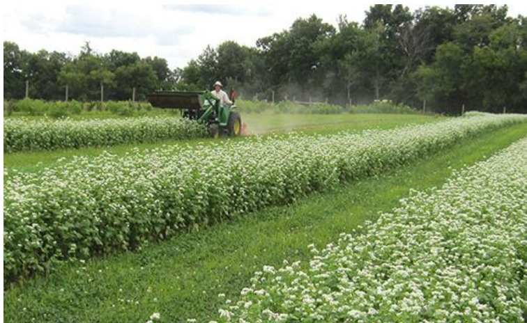
Slika 4. Žetva usjeva heljde

ekološku vrijednost. Kao ljetni usjev sije se s ciljem sprečavanja rasta korova, a i izvor je dodatnih prihoda. Osim toga, zbog dugotrajnog cvjetanja, dobar je izvor nektara za pčelinju pašu, ali je i stanište za druge korisne kukce (Cawoy i sur., 2007.). U združenim usjevima s voćkama može pridonijeti smanjenju napada štetnika na voćke.