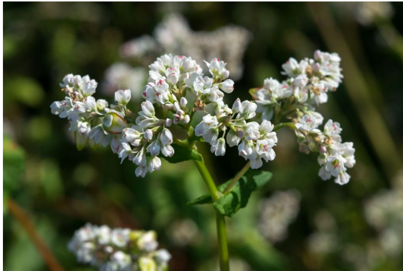
Slika 3 . Cvijet heljde

Navodi se da je heljda izvor rutina, kemijske komponente koja se koristi u medicini za reguliranje krvnog tlaka i kolesterola u krvi, te za zaustavljanje kapilarnog krvarenja. Također se može koristiti za liječenje ozeblina i gangrene. Medicinska svojstva heljde su povezana s visokim sadržajem kolina koji može utjecati na snižavanje krvnog tlaka ( Jiang i sur., 1995). Heljda ne sadrži gluten te je stoga često korištena u prehrani ljudi alergičnih na gluten, a koristi se i za pripravu dijetalnih proizvoda.