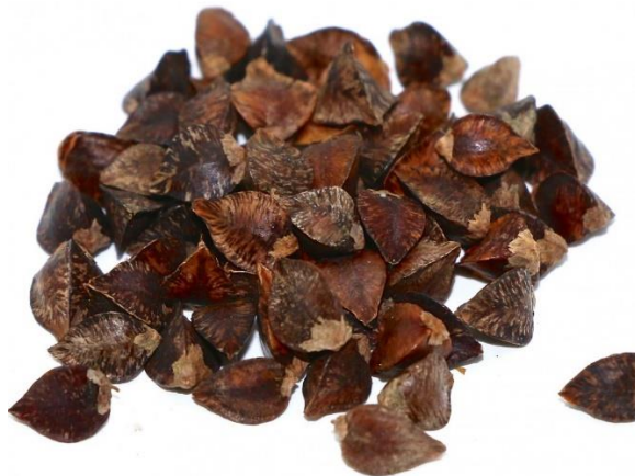
Slika 6. Sjeme heljde

izazvati osip, a slama od heljde može uzrokovati gastrointestinalne tegobe. Stoga se pri korištenju heljde kao ishrane preporuča miješanje s drugim žitaricama, u omjeru 1:2.