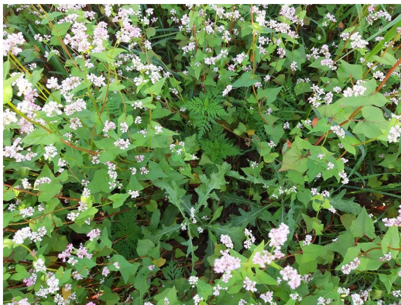
Slika 16. fotografija usjeva heljde s orasima, vidljivo je zakorovljenje ambrozijom i poljskim osjakom

Obrada podataka za promatrane parametre: suhu tvar (biomasu po jedinici površine), prinose, gustoću sklopa te pojavu ambrozije (broj biljaka ambrozije i postotni udio ambrozije) je pokazala da postoje određene statistički značajne razlike između lokaliteta. Rezultati su pokazali da postoji statistički značajna razlika između Ivankova i Đakova u iznosu suhe tvari po hektaru unutar konsocijacije orah/heljda, tj. u Ivankovu je heljda imala statistički značajno veću biomasu kada promatramo biomasu unutar kosocijacije. Na kontrolnim parcelama, tj. oranici nije bilo statistički značajne razlike u biomasi između dva lokaliteta (Tablica 1.). Prinos heljde u Đakovu u konsocijaciji iznosio je 1,8 t/ha, dok je u Ivankovu bio 2,5 t/ha, no nije bio statistički značajno viši. Prinos heljde u Đakovu s parcele kontrole znatno je viši od prinosa heljde s parcele u Ivankovu. Također, broj biljaka tj. sklop heljde po metru kvadratnom na parceli kontrole u Đakovu, statistički je znatno viši od broja biljaka na kontroli u Ivankovu (Tablica 1). Iako postoje razlike u zakorovljenosti dvaju lokacija, ta razlika nije statistički značajna. Ambrozija nije utjecala na smanjenje ili povećanje prinosa heljde, ni na parceli s orasima i heljdom, niti na kontroli. Analize tla s parcela u Đakovu ukazuju na više razine dostupnog kalija i organske tvari na kontroli nego na parceli orah/heljda.