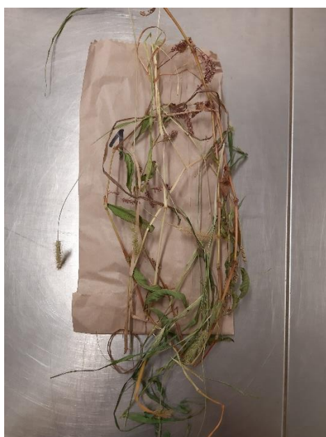
Slika 14. Korovi izdvojeni iz uzorka broj 1