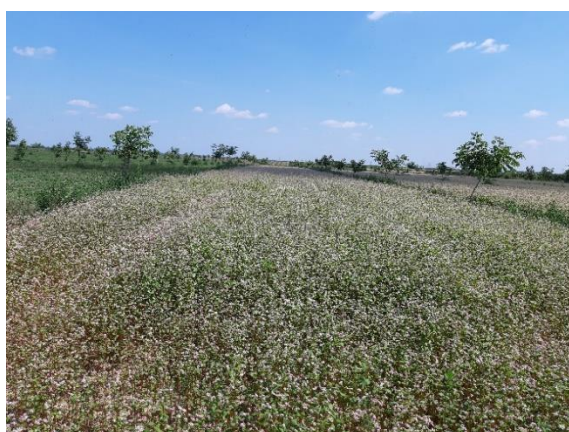
Slika 17. Stanje usjeva heljde u konsocijaciji s orahom, 17. srpnja, Ivankovo

n- broj uzoraka, ns – nije statistički značajno, *** p<0,0001, * p<0,05