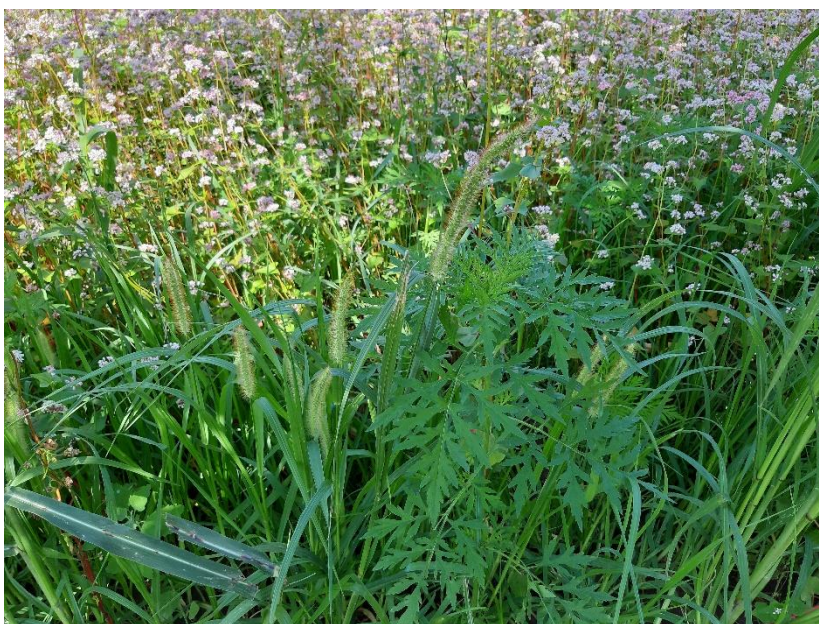
Slika 7. Ambrozija i sivi muhar

( Amaranthus povelii S. Wats.), rusomače ( Capsella bursa-pastoris L.) i poljskog jarmena ( Anthemis arvensis L.) potisnut je ostacima heljde u tlu (Kumar i sur., 2009.). Golisz i sur. (2007.) smatraju da je upravo rutin glavna alelopatska komponenta heljde. Nadzemni dio biljke sadrži galnu kiselinu koja je pokazala inhibicijski učinak na rast dikotiledona (Iqbal i sur., 2003.). Unatoč mnogim istraživanjima, nije sigurno koje tvari izazivaju alelopatiju kod heljde. Kumar i sur. (2008.) tvrde da je razlog supresiji korova utjecaj heljde na smanjenje broja patogena i niži sadržaj dostupnog dušika u tlu. Korijenje heljde luči tvari koje mogu potisnuti rast oštrodakavog šćira ( Amaranthus retroflexus Lam.) (Gfeller i sur. 2018.).