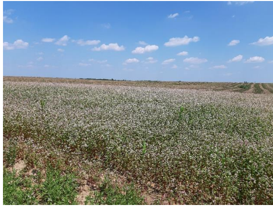
Slika 19. Stanje usjeva heljde, 17.srpnja, kontrola, Ivankovo