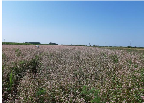
Slika 20. Stanje usjeva heljde 17.srpnja, kontrola, Đakovo