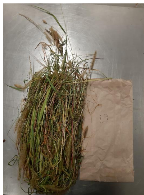
Slika 15. Korovi izdvojeni iz uzorka broj 19