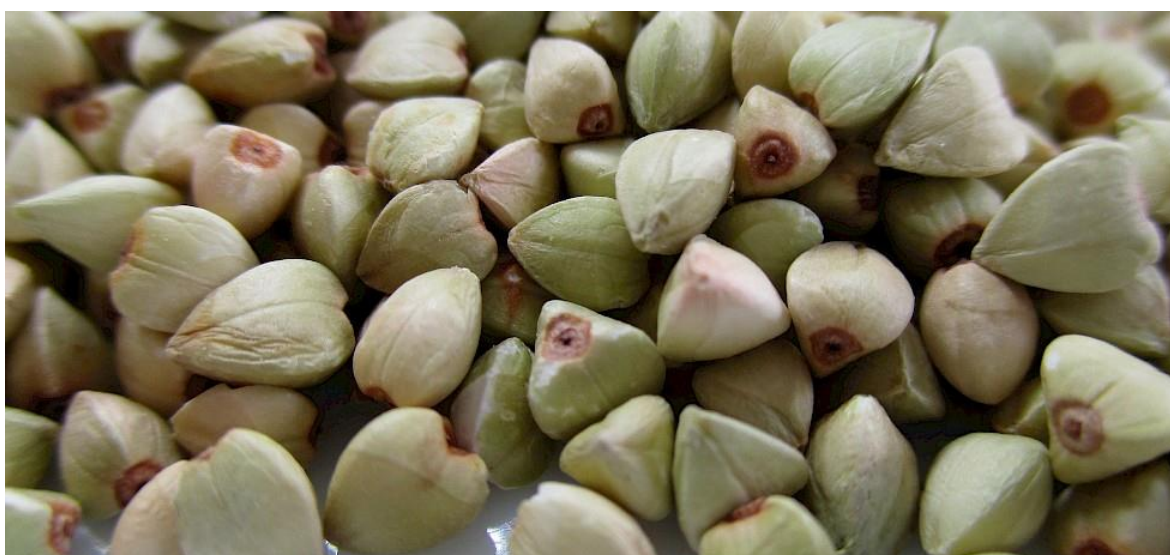
Slika 1 . Zrna heljde

Heljda ( Fagopyrum esculentum Moench) je jednogodišnja biljka iz porodice Poligonaceae . Potječe iz područja srednje i sjeveroistočne Azije, Mandžurije i Himalaja (Bernath, 2000.). Najviše se proizvodi u Kini, Rusiji, Ukrajini i Kazahstanu. Donesena je u Europu krajem četvrtog stoljeća. U Sloveniji se uzgaja uglavnom u postrnoj sjetvi radi kratkog životnog ciklusa, uglavnom kao predsjetvena kultura za povrće, ječam i pšenicu, a rijetko se uzgaja kao glavna kultura. Iako se morfološki razlikuje od žitarica, ubraja se u skupinu žitarica zbog toga što se koristi za iste svrhe. Zbog toga se Heljdu naziva i pseudo-žitaricom. Postoji više vrsta heljde, od kojih su najpoznatije obična heljda ( Fagopyrum esculentum L.), višegodišnja heljda ( Fagopyrum cymosum L.) i tatarska heljda ( Fagopyrum tataricum L.). Intenzitet proizvodnje heljde na mediteranu u skladu je s povećanjem potražnje za zdravom hranom s niskim utjecajem na okoliš (Arduni, 2018.). U istočnoj Hrvatskoj heljda se uglavnom uzgaja kao postrna kultura na manjim površinama, a prinosi zrna kreću se od 1 do 2 t/ha. Prema podacima iz agronomskog statističkog godišnjaka 1993. godine u Hrvatskoj se proizvodilo 30 tona heljde na 50 hektara, a to je iznosilo samo 0,01 % ukupnih obradivih površina u državi. Prema FAOSTAT-u u Hrvatskoj se 2013. proizvelo 390 tona heljde.