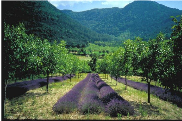
Slika 9. Primjer zdrženih usjeva pogodnijih za toplije podneblje