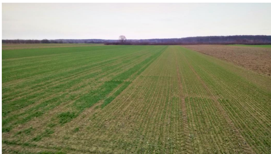
Slika 4. Utjecaj roka sjetve u ranim fazama razvoja

S obzirom da je pokus uključivao sjetvu pšenice u različitim rokovima sjetve, od optimalnih do kasnih, očekivano je razvoj biljaka bio različiti (Slika 4.). U slučaju busanja pšenice iz prvog roka ona iz trećeg je bila tek u fazi 2-4 lista (Slika 5.).