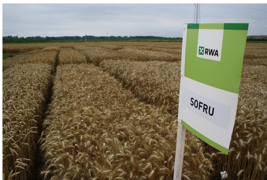
Slika 11: Sofru

Sofru je visoko rodna krušna pšenica po vegetaciji srednje rana, a klas je bijele boje sa osjem (brkulja). Niska sorta otporna na polijeganje. Tolerantnost na Septorie tritici je niska, na pepelnicu, žutu hrđu i Fusarium je prosječna, a na lisnu hrđu odlična. Po pokazateljima kvalitete ubraja se u poboljšivače, pripada kvalitetnoj grupi B2, odlikuje se krupnim naboranim zrnom. Sadržaj proteina je prosječan, težina 1000 zrna je velika oko 47g. Optimalni rok za sjetvu je od 10. do 25. listopada, norma sjetve u ovom roku iznosi 380 – 420 klijavih zrna/m 2 , odnosno 200 – 220 kg/ha (RWA, 2019.).