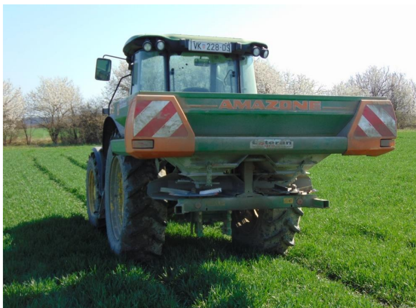
Slika 2. Obavljanje prihrane pokusa pšenice

Za razgradnju žetvenih ostataka dodano je 100 kg/ha ureje (46 % N), a predsjetvena gnojidba obavljena je sa 480 kg/ha mineralnog gnojiva N:P:K formulacije 7:20:30. Tijekom vegetacije obavljene su čak 4 prihrane dušikom. Prva prihrana obavljena je 20. 02. 2019. s KAN-om (27 % N) u količini od 150 kg/ha, a druga prihrana obavljena je 18. 03. 2019. sa KAN-om u količini 120 kg/ha (Slika 2.). Treća prihrana pšenice obavljena je 04. 04. 2019. folijarno sa tekućim gnojivom trgovačkog naziva Fertilader elite, a četvrta prihrana obavljena je 04. 05. 2019. KAN-om u količini od 90 kg/ha. Nakon sve četiri prihrane pala je dobra kiša što je povećalo uspješnost odrađenih prihrana.