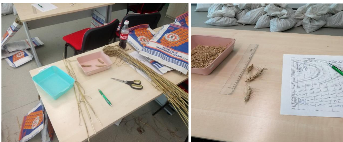
Slika 8. Određivanje ispitivanih parametara pšenice

Pored uzimanja uzoraka sa m^2 dodatno su uzeti uzorci 30 slučajno odabranih biljaka u tri ponavljanja za svaku sortu u svakom roku sjetve za određivanje broja zrna u klasu, dužinu klasa, masu klasa i masu vlati. Nakon odstranjivanja klasa od vlati obavljeno je vaganje klasa i vlati pomoću precizne analitičke laboratorijske vage (g) na dvije decimale, mjerenje dužine klasa u cm, a zatim je ručnim izdvajanjem i brojanjem utvrđen broj zrna po klasu. Sva mjerenja su provedena u prostorijama Fakulteta agrobiotehničkih znanosti Osijek (Slika 8.). Žetva pokusa odnosno uzeti uzorci od 27 m^2 su ovršeni 21. srpnja 2019. pomoću malog kombajna za pokuse (Wintersteiger). Nakon žetve određen je prinos i masa 1000 zrna.