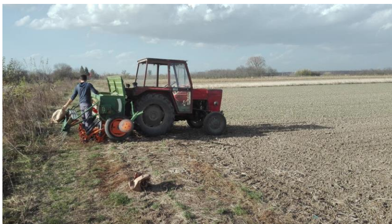
Slika 1. Sjetva pokusa pšenice u drugom roku

Predkultura na provedenom pokusu je bio suncokret nakon čega je izvršeno samo tanjuranje u tri prohoda, jedan prohod sjetvospremačem i jedan prohod drljačom nakon sjetvospremača kako bi se usitnilo i priredilo tlo za obavljanje sjetve. Sjetva pokusa obavljena je sa preciznom sijačicom za pšenicu i ostale ratarske kulture Amazone D8 (Slika 1.). Razmak između reda je 12 cm.