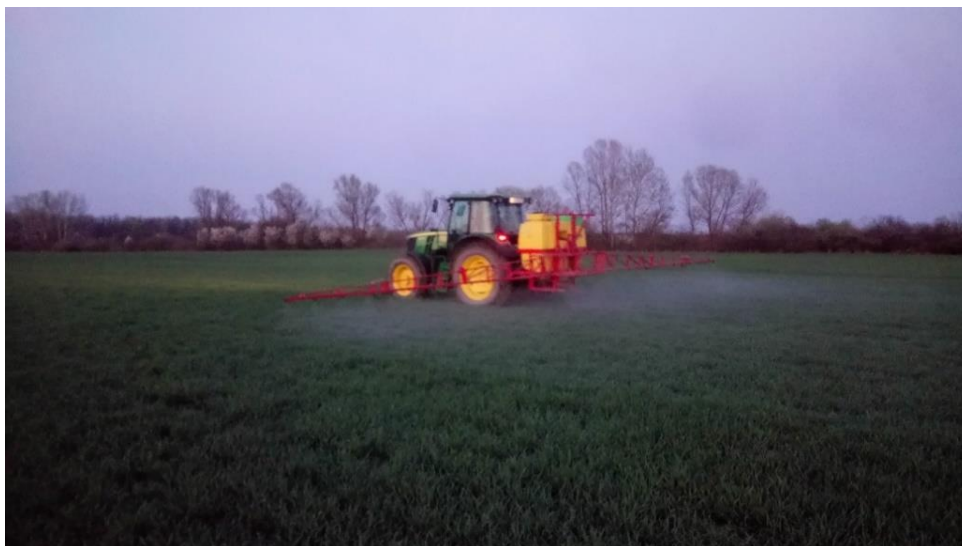
Slika 3. Zaštite pokusa pšenice od korova

Od mjera njege usjeva pšenice na pokusu je obavljena samo zaštita od korova i jedan tretman zaštite od bolesti. Zaštita od korova obavljena je 23. 03. 2019. herbicidnim sredstvom trgovačkog naziva Sekator u dozi od 150 ml/ha, dok je zaštita od bolesti obavljena sa fungicidom trgovačkog naziva Prosaro u količini od 1 L/ha (Slika 3.).