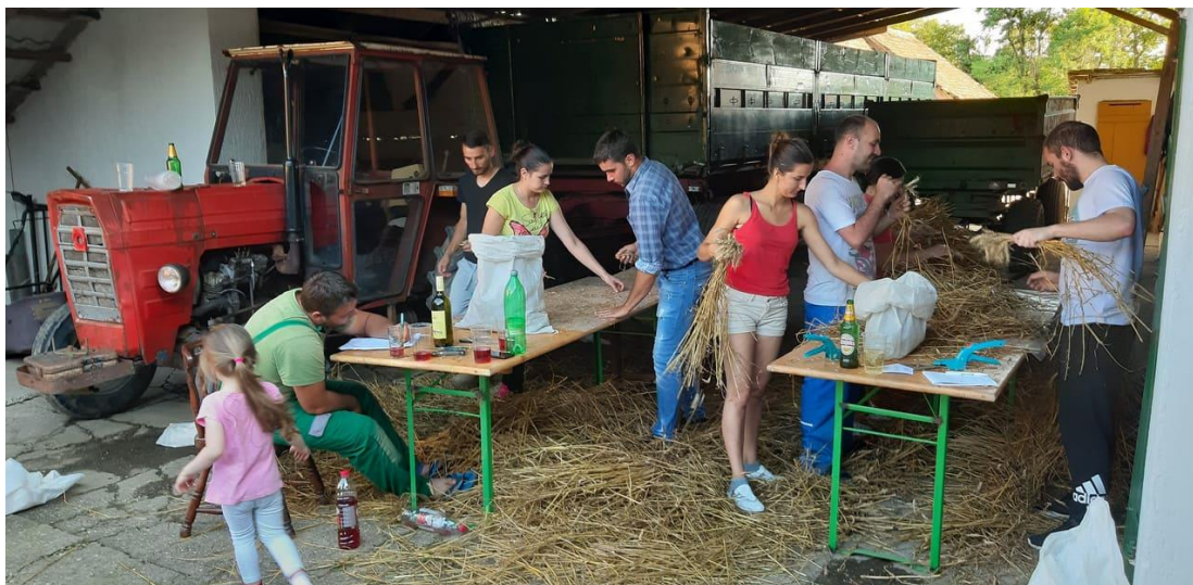
Slika 7. Brojanje klasova po m 2

Brojanje klasova obavljeno je ručno prebrojavanjem svakog klasa sa svakog ponavljanja što znači kako je ukupno uzeto i prebrojano pšenice sa 27 m 2 (Slika 7.).