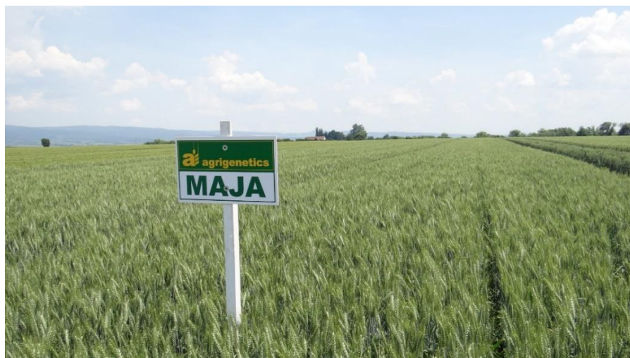
Slika 9: Maja

ekstenzogramske pokazatelje kvalitete, kvalitetna grupa A2, ubraja se u sorte poboljšivače. Tolerantna na osnovne bolesti pšenice, otporna na sušu i niske temperature. Masa 1000 zrna je 42 – 45 g, norma sjetve 650 klijavih zrna/m 2 , a optimalni rok sjetve je od 5 do 25. listopada (Agrigenetics, 2019.)