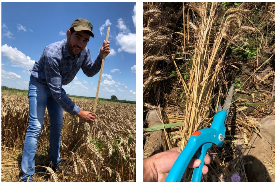
Slika 6. Mjerenje visine biljaka i uzimanje uzoraka

Brojanje klasova obavljeno je ručno prebrojavanjem svakog klasa sa svakog ponavljanja što znači kako je ukupno uzeto i prebrojano pšenice sa 27 m 2 (Slika 7.).