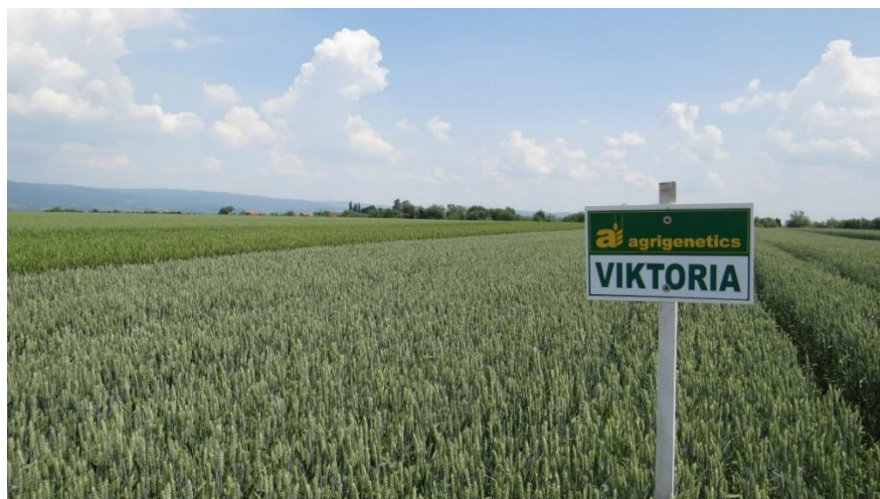
Slika 10: Viktorija

Sofru je visoko rodna krušna pšenica po vegetaciji srednje rana, a klas je bijele boje sa osjem (brkulja). Niska sorta otporna na polijeganje. Tolerantnost na Septorie tritici je niska, na pepelnicu, žutu hrđu i Fusarium je prosječna, a na lisnu hrđu odlična. Po pokazateljima kvalitete ubraja se u poboljšivače, pripada kvalitetnoj grupi B2, odlikuje se krupnim naboranim zrnom. Sadržaj proteina je prosječan, težina 1000 zrna je velika oko 47g. Optimalni rok za sjetvu je od 10. do 25. listopada, norma sjetve u ovom roku iznosi 380 – 420 klijavih zrna/m 2 , odnosno 200 – 220 kg/ha (RWA, 2019.).